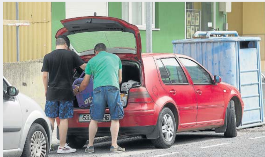
A Mariña, Lugo Tras conocerse que el Gobierno de Galicia cierra la comarca desde hoy, varias personas se apresuraban a hacer las maletas para abandonar la zona ayer