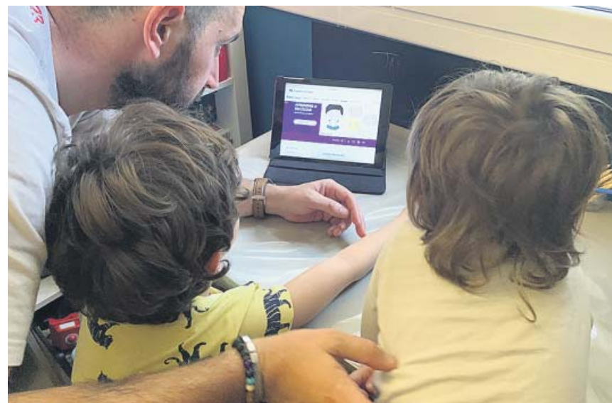
Un padre enseña a sus hijos vía internet. FUNDACIÓN LA CAIXA

El año pasado murieron durante los meses de julio y agosto un total de 215 personas en las carreteras, el 43% eran ciclistas y motoristas. ● R. A.