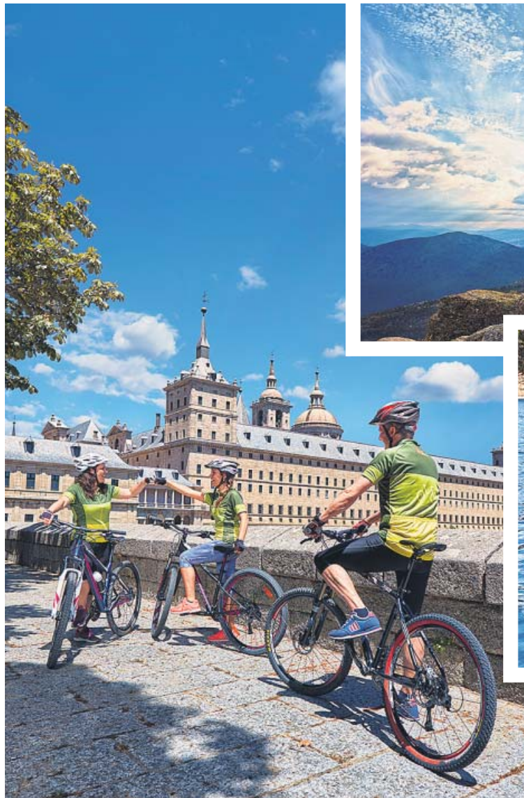
El Gran Tour CiclaMadrid es para toda la familia.

San Lorenzo de El Escorial, retiro de reyes y centro de poder político, es perfecto para recorrer en bici sus montañas.