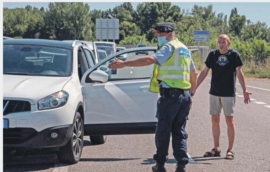
El Segrià, Lleida A las pocas horas de decretarse el confinamiento, los Mossos ya habían establecido controles de carretera para supervisar las entradas y salidas de la comarca de El Segrià