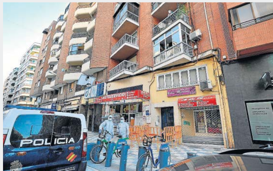
Albacete La aparición de 9 casos de coronavirus en dos familias de un mismo edificio ha obligado a confinar en él a 18 personas. Tres de los contagiados han tenido que ser hospitalizados