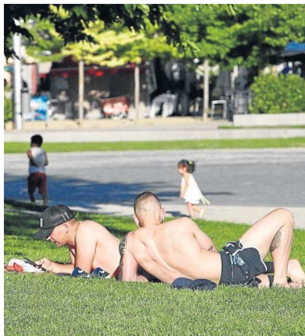
Los madrileños también han sufrido estos días el calor.

go de incendio, que es extremo o muy alto en puntos de Andalucía—sobre todo de Málaga, Jaén y Córdoba—, zonas de Galicia, País Vasco, Navarra, sur de Cataluña e interior peninsular. Asimismo, el índice de radiación ultravioleta alcanza valores muy elevados en todas las regiones y será mayor este lunes, un riesgo ante el que los ciudadanos deben protegerse, pero que también tiene su lado positivo pues, según diversos estudios científicos, la radiación ultravioleta del sol reduce