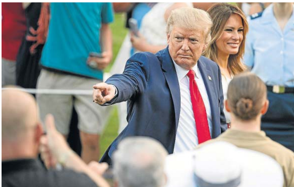
Donald Trump y Melania Trump, en los jardines de la Casa Blanca el sábado.