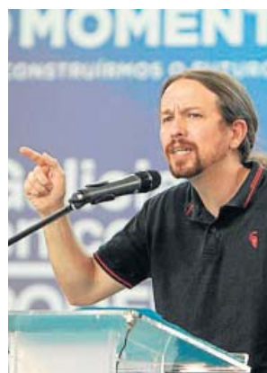
Pablo Iglesias, ayer en un mitin en Vigo.