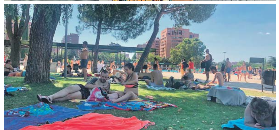
Las oficinas de empleo de la Comunidad vuelven a prestar hoy atención presencial tras semanas de parón. Debajo, ayer, aspecto que presentaba la piscina municipal del Barrio del Pilar.