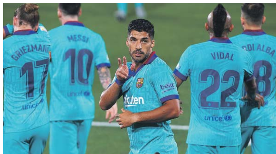
Luis Suárez celebra el segundo gol del Barcelona en La Cerámica.