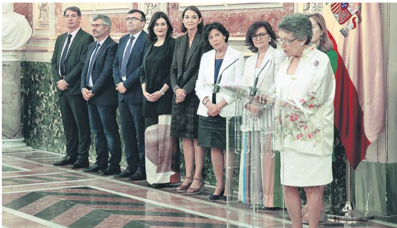
Fotografía de la toma de posesión de Rosa María Mateo en julio de 2018.