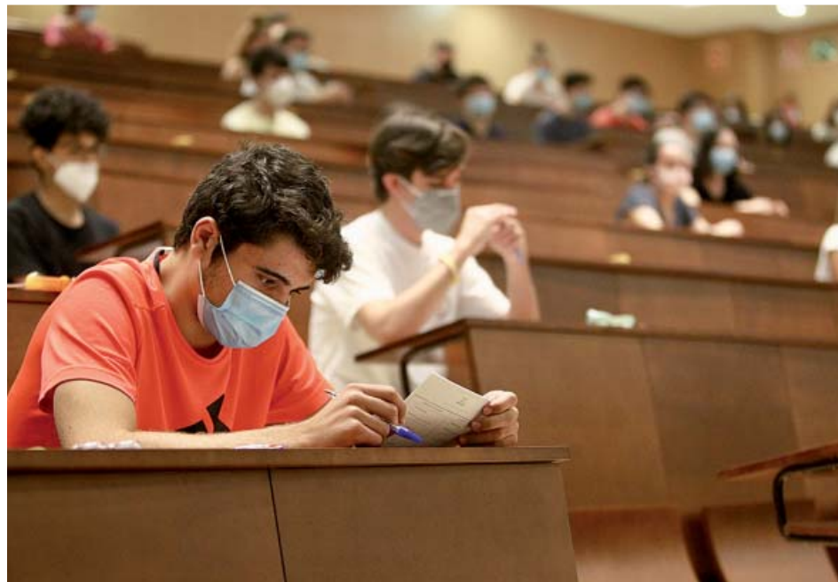
Alumnos en el Aula Magna de la Complutense, durante el primer examen de la EVAU.

Para gestionar la presencia dentro de las instalaciones cada