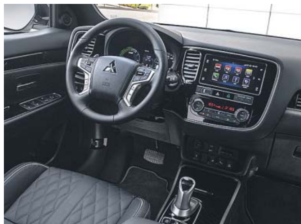
Como alto de gama que es, el interior es elegante y lujoso.

Sus 4,7 metros de largo y su altura de algo más de 1,7 metros ya adelantan que en el interior no va a faltar sitio para ninguno de los cinco ocupantes, como así sucede, y además el maletero de 500 litros da mucho juego. Debajo del suelo plano de este, por cierto, está el cable de carga para el