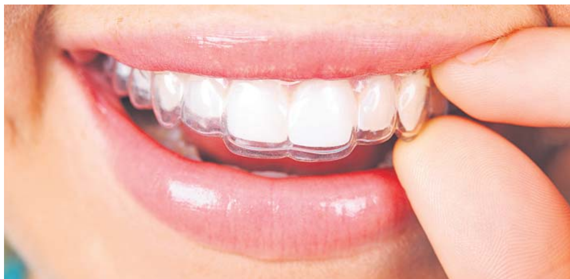
La clínica Tiiz, especializada en las ortodoncias invisibles, ayuda a los pacientes a continuar sus procesos dentales.

La falta de atención general a los pacien-