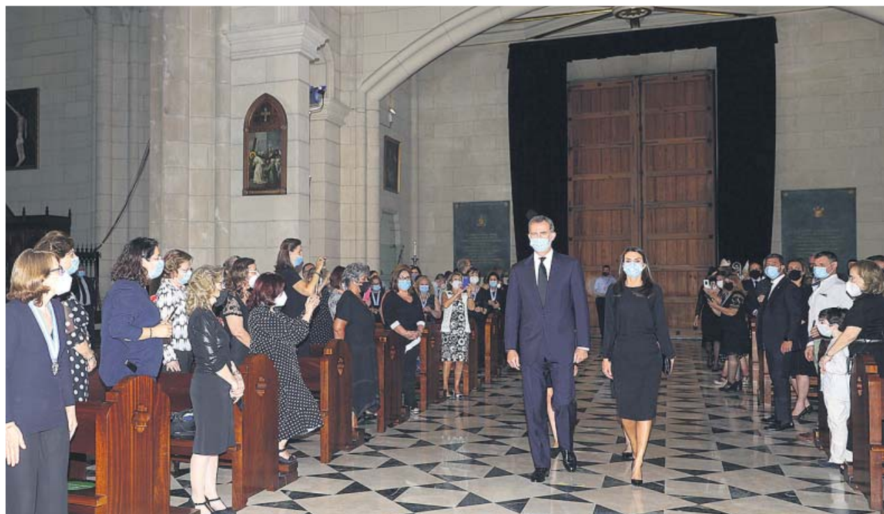
Familiares de víctimas de la Covid hacen fotos a los Reyes, con sus hijas detrás, a su entrada a la Almudena.

COVID-19 El presidente del Gobierno fue el gran ausente en la misa en honor a los fallecidos por la pandemia de coronavirus