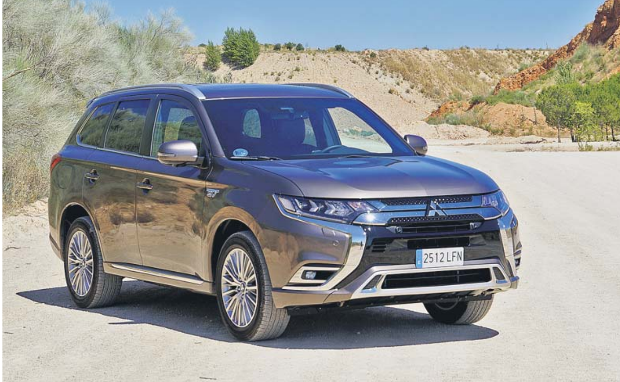
La imagen es imponente y el sistema híbrido acompaña. En sus 4,7 metros de longitud hay espacio para todo. D.P.