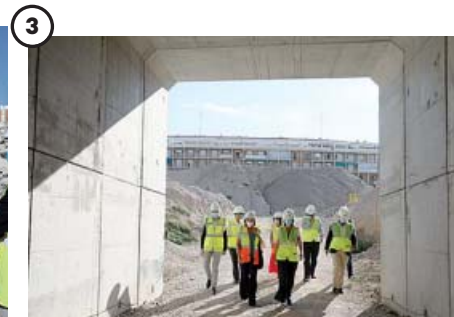
Petición de los vecinos

Según los datos facilitados por el área de Obras, en total se han llegado a retirar más de 62.500 toneladas de materia, de las que 26.000 formaban parte de la tribuna principal.