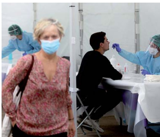
En la imagen superior, una pareja de Mossos controla los accesos a la estación de tren de Lleida. Abajo, toma de muestras en la localidad guipuzcoana de Ordizia.