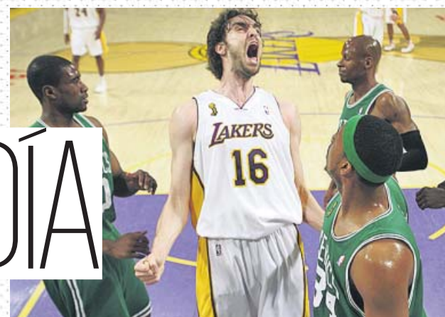
↓ El señor de dos anillos Ganó dos títulos de la NBA con los Lakers, brillando en las dos finales, sobre todo en 2010 ante Boston.