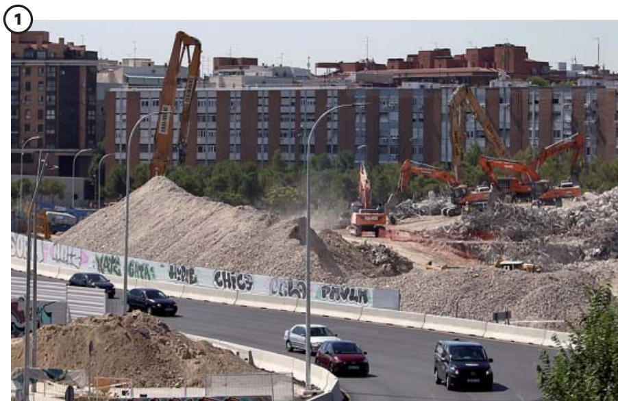
Los restos del Calderón

Varias máquinas trabajaban a primera hora de ayer en el derribo de la última grada del estadio, diecisiete meses después de que comenzaran las obras. Esta tribuna ha sido la parte más compleja debido a los residuos que generaba e iban a parar al río, según denunciaban los ecologistas.