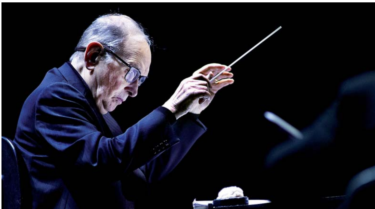
El compositor Ennio Morricone, durante un concierto en 2016 en Ámsterdam (Países Bajos).