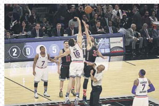
↑ Gasol vs. Gasol Nunca antes dos hermanos realizaron el salto inicial en un All-Star. Pau y Marc lo hicieron en 2015.