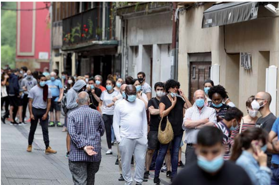
Vecinos de Ordizia, Guipúzcoa, hacen cola para realizarse un test de coronavirus.