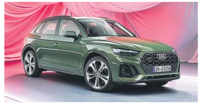
El frontal rediseñado es el cambio estético más apreciable.

La primera versión en llegar, tras el verano, será la 40 TDI, provista de un motor de 2 litros y 204 caballos de potencia, además de cambio automático S tronic de 7 velocidades y