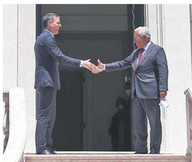
Sánchez y el primer ministro portugués, António Costa.

Quien sí se pronunció fue el líder del PP, Pablo Casado, que aseguró que Iglesias «no está para dar lecciones» porque tiene un caso de corrupción «muy grave a sus espaldas» y aseguró que prefiere «un país con periódicos y sin Gobierno a lo contrario», en referencia a las críticas a la prensa de Unidas Podemos. ●