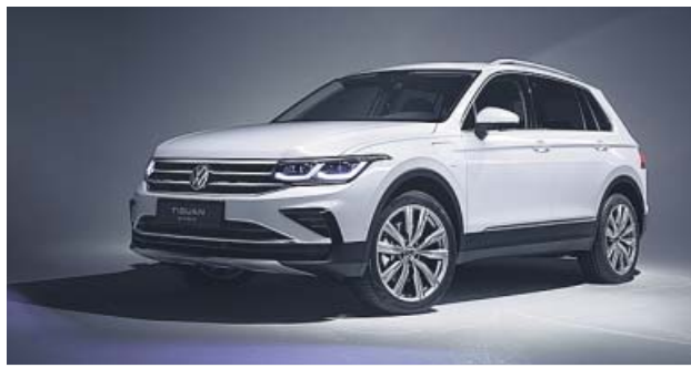
La variante eHybrid alcanza los 245 caballos de potencia.

También se introduce en la gama una variante híbrida enchufable de gasolina cuyo sistema rinde 245 caballos de potencia y tiene 50 kilómetros de