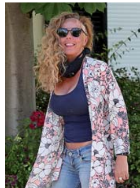
Rocío Carrasco, el pasado mes de junio en Madrid.

Está de vuelta y convencida de estar haciendo lo correcto, de haber escogido el camino acertado. Rocío Carrasco demuestra su camaleónica personalidad como