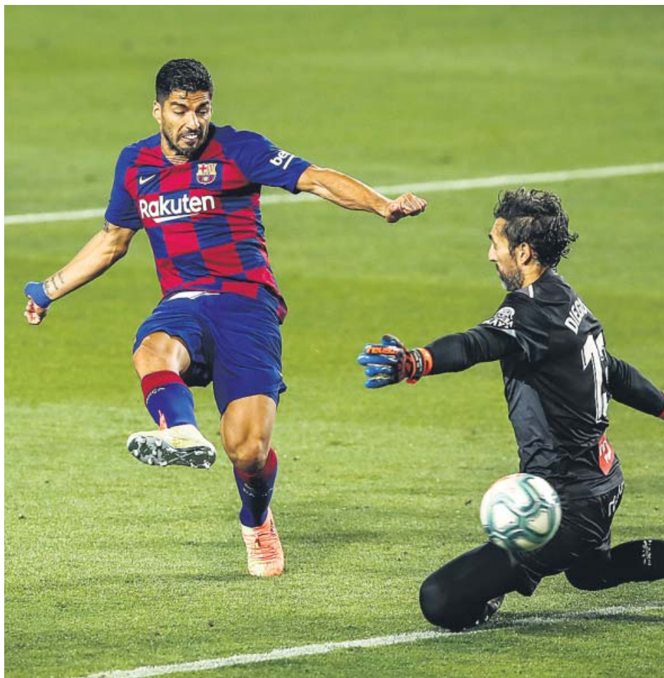
Luis Suárez bate a Diego López en el derbi catalán.

Consciente de su inferioridad técnica, Rufete planteó un partido inteligente. Tres centrales, mucha gente en el centro del campo, pocos espacios y salir a la contra solo cuando fuera necesario pero tratando de crear mucho peligro. Y su plan funcionó ante un Barcelona que venía de dar