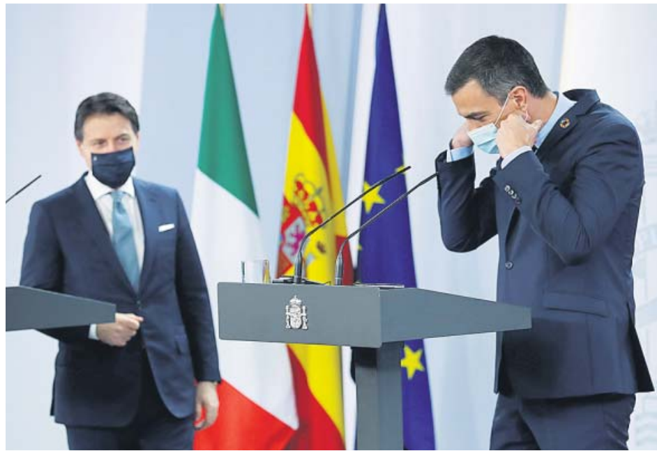
Pedro Sánchez y Giuseppe Conte, ayer en Moncloa.

Fondo de rescate. Sánchez no descarta pedir ayuda al MEDE si la situación por la Covid «empeora». Podría pedir créditos por hasta el 2% del PIB para sufragar gasto relacionado con la pandemia.