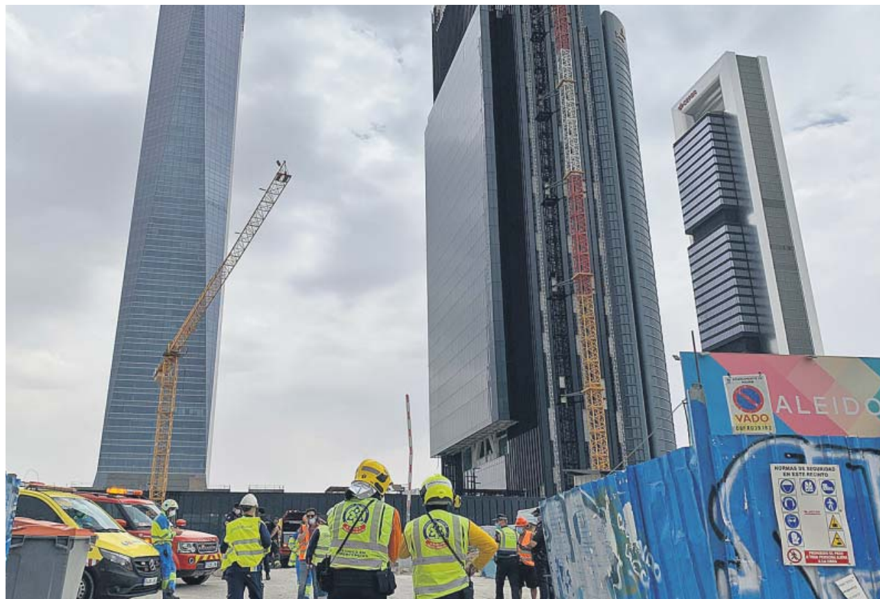
Varios efectivos trabajan en el desalojo de la torre Caleido. EMERGENCIAS DE MADRID

inri, desde agosto, cuando el Gobierno de coalición entre Ayuso e Ignacio Aguado desembarcó en Sol, y hasta entonces crecieron un 9%, lo que se traduce en 60.000 ciudadanos más repartidos entre consultas externas (crecimiento del 8%); quirúrgica (sube un 4,5%) y de pruebas diagnósticas (aumento del 14%). ● J. L. MACÍAS