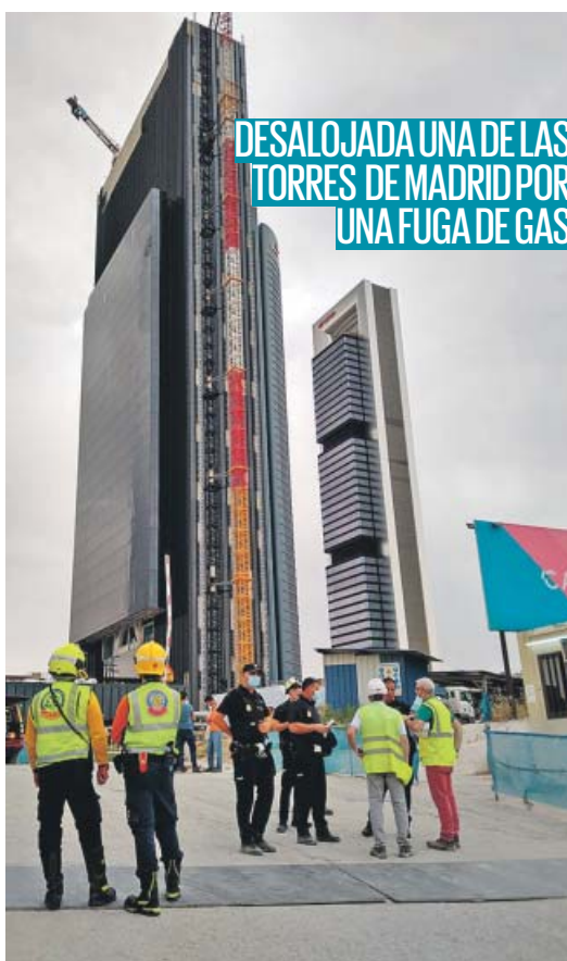
DESALOJADA UNA DE LAS TORRES DE MADRID POR UNA FUGA DE GAS