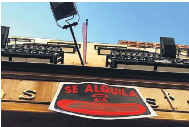
Cartel de un inmueble en alquiler. JORGE PARÍS

La Comunidad espera que se empiecen a pagar los subsidios este mes, pero alerta de que muchas solicitudes llegan con errores o carecen de la información necesaria