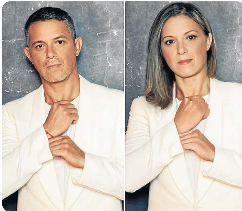
El cantante Alejandro Sanz se convierte en una mujer elegante al pasar por la aplicación.

«Es la clave de éxito de estos modelos de negocio: brindar algo supuestamente gratuito a cambio de datos. No lo inventó FaceApp: por ejemplo, desde hace tiempo Waze 'nos regala' un gran GPS a cambio de que 'solo' le digamos nuestra posición, que a la vez alimenta el sistema», comenta Minoli. En el caso de FaceApp, se mezclan miles de millones de imágenes