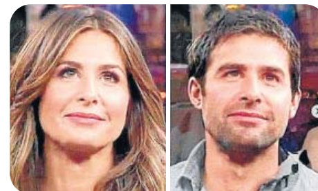
La presentadora Nuria Roca.