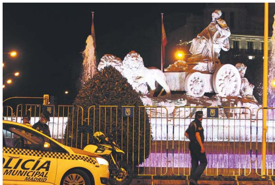
La Cibeles permaneció vallada durante toda la noche.