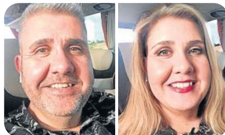
El humorista Florentino Fernández.