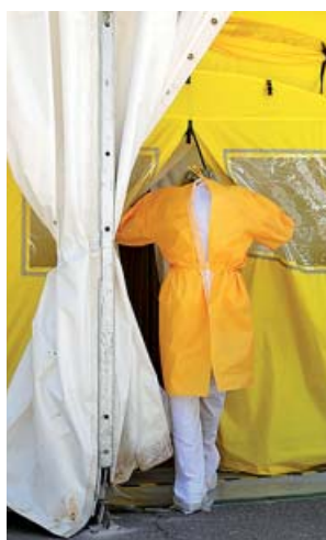
Hospital de campaña en Lleida, ayer.

Por su parte, las funerarias reportaron ayer cuatro muertes más que en el último balance. De los 12.631 fallecimientos en Cataluña por coronavirus, 800 han tenido lugar en domicilios y 4.114 en residencias. En la comarca del Segrià, que sigue con un encierro perimetral y un en-