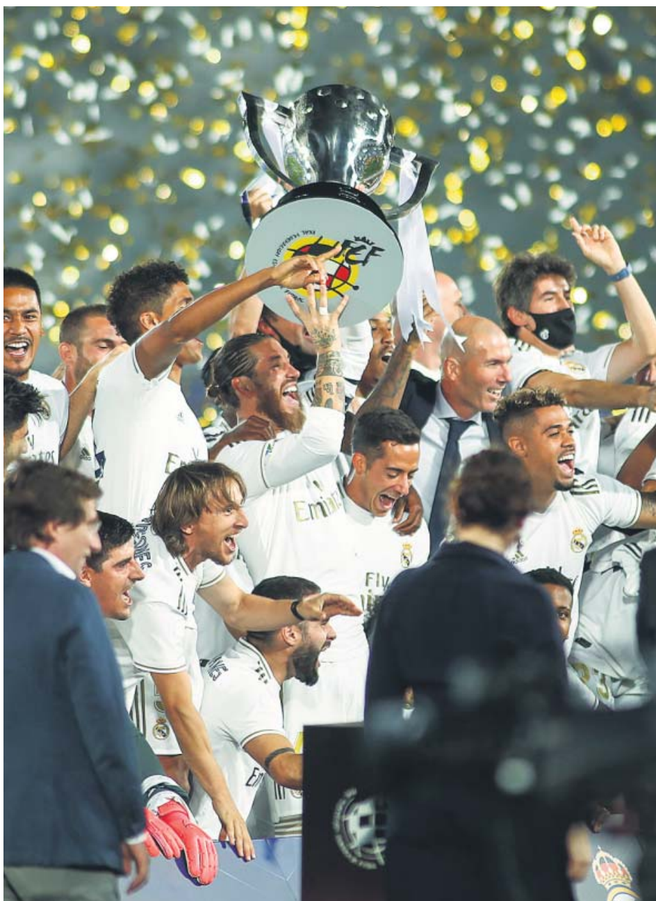
Los jugadores del Madrid levantaron el trofeo decampeón de Liga sobre el césped.