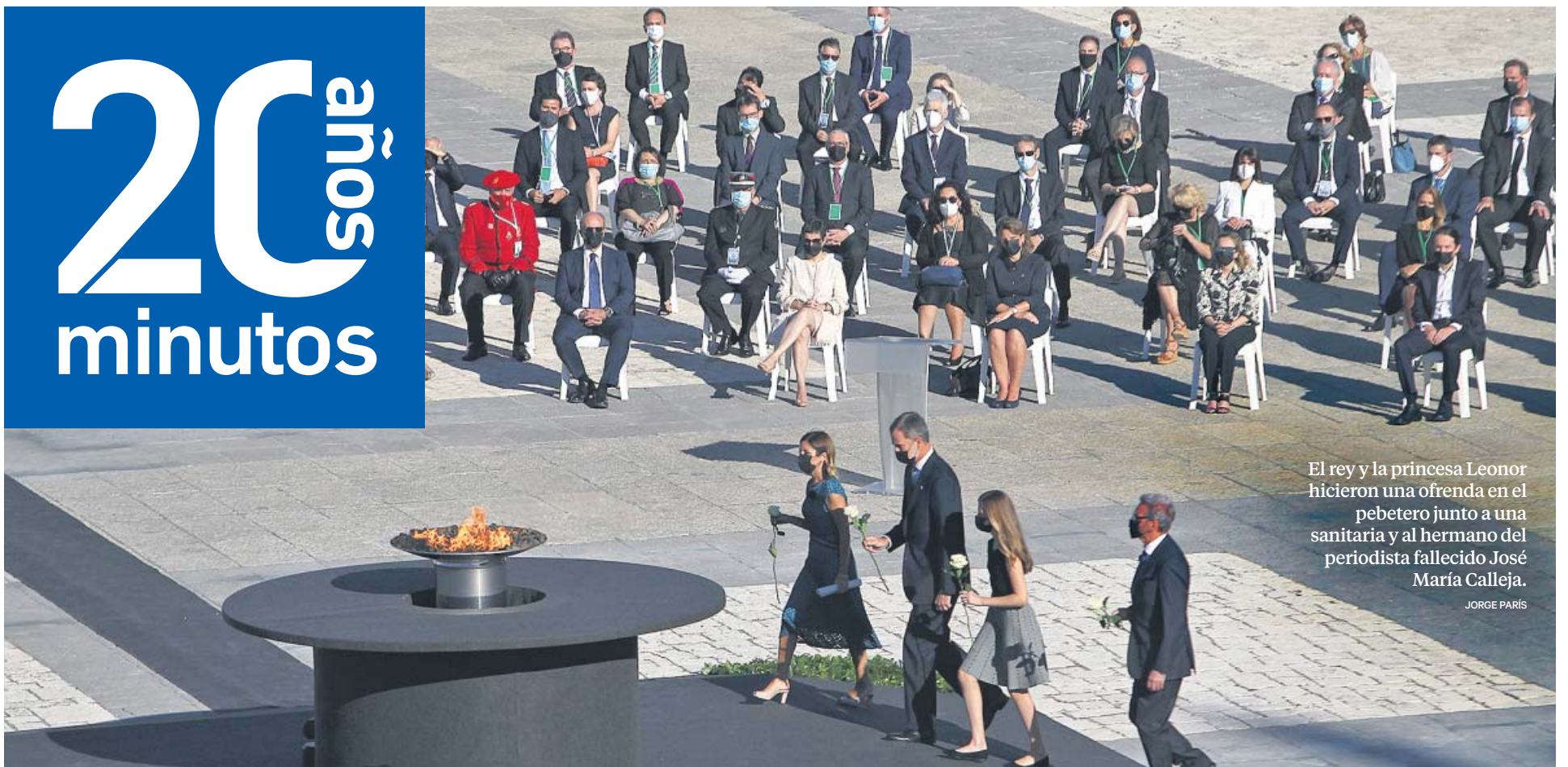
El rey y la princesa Leonor hicieron una ofrenda en el pebetero junto a una sanitaria y al hermano del periodista fallecido José María Calleja.