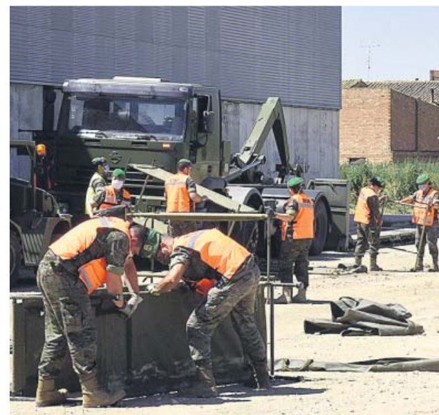
Efectivos militares, ayer, en Albalate de Cinca (Huesca).

En cuanto a la situación que vive la comunidad aragonesa, a las 870.000 personas que regresaron esta semana a restricciones propias de una fase 2 «fle-