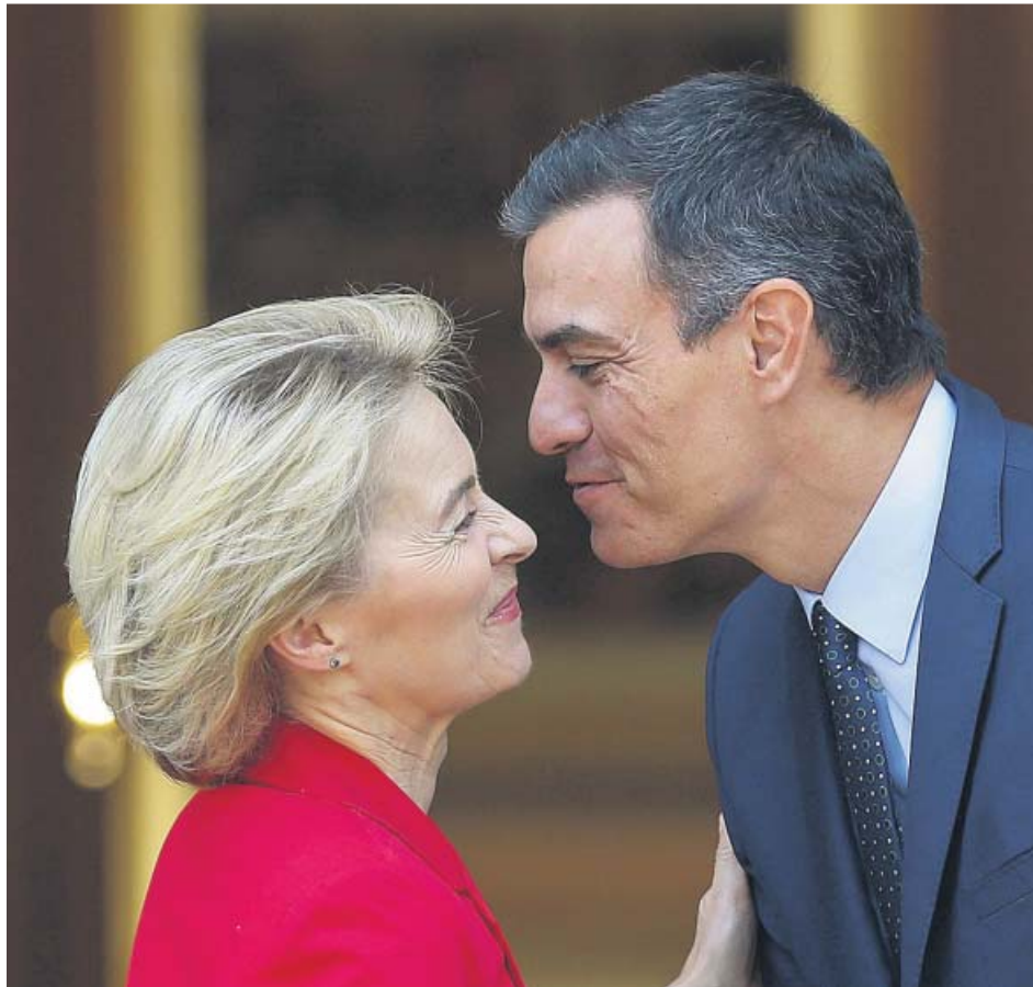
Ursula von der Leyen y Pedro Sánchez se saludan en un encuentro en Moncloa.

DIFERENCIAS España, Italia y Francia piden ayudas directas, pero los países del norte se inclinan por préstamos