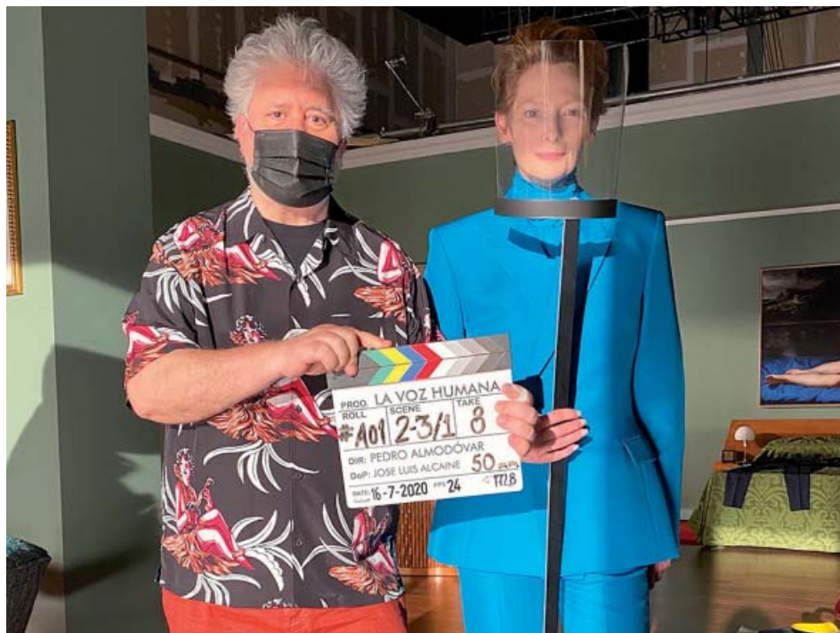
Pedro Almodóvar y Tilda Swinton, en el primer día de rodaje de La voz humana.