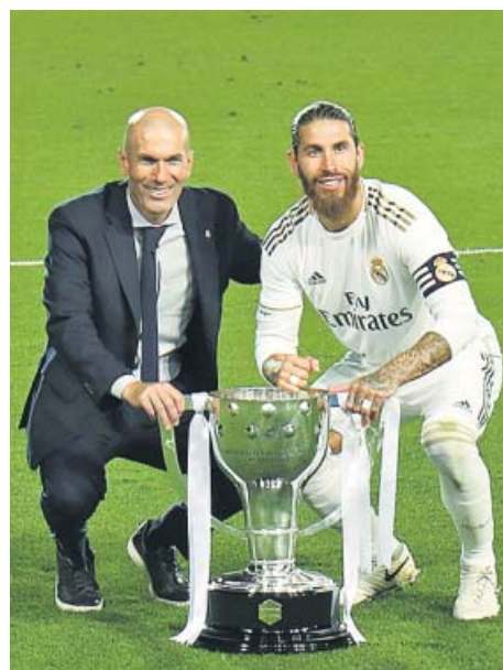
Zidane y Ramos, los pilares del Madrid.