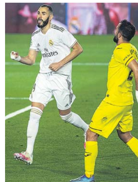
Benzema, bigoleador ayer.