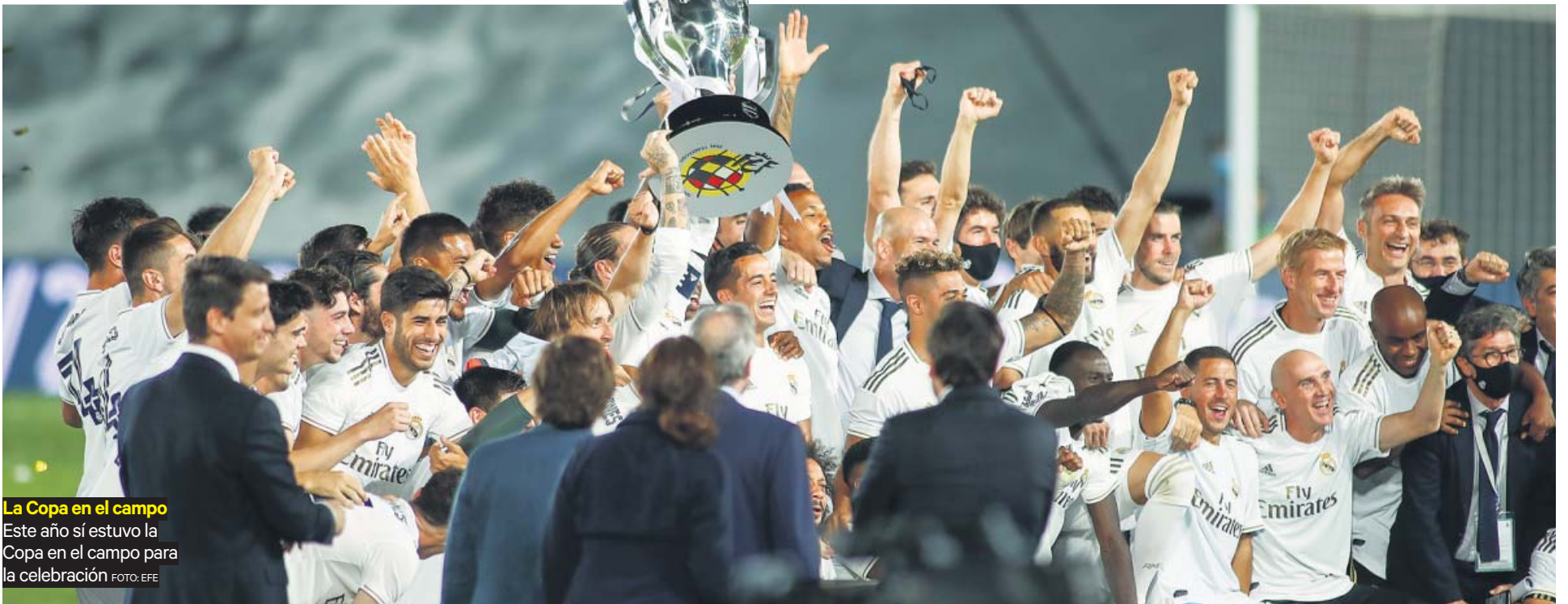
La Copa en el campo Este año sí estuvo la Copa en el campo para la celebración.