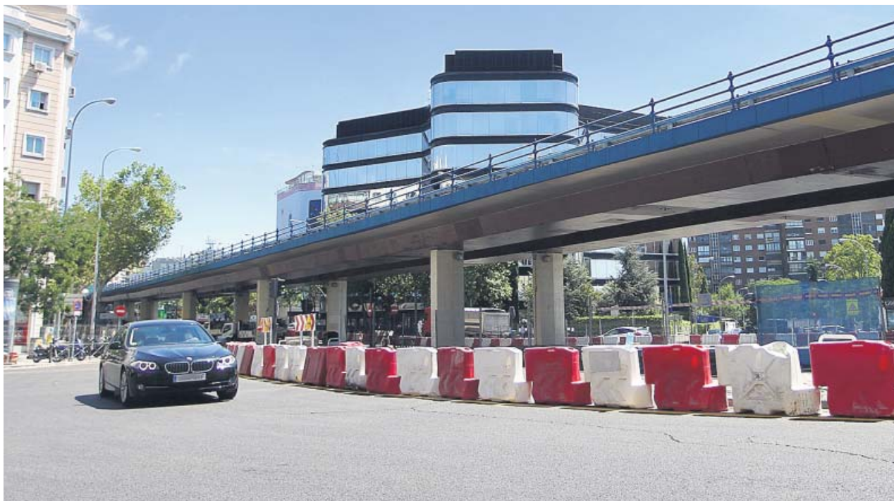
Tras asegurar la estructura, se habilitará un paso peatonal transversal bajo el viaducto. JORGE PARÍS