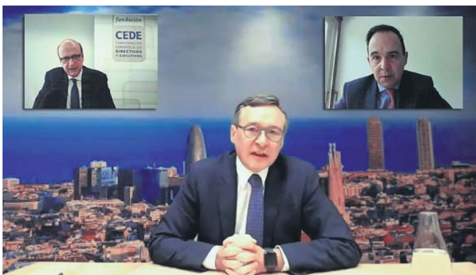
El presidente de la Sociedad General de Aguas de Barcelona, Ángel Simón.

Uno de cada cuatro españoles, el 25,3%, estaba en 2019 en riesgo de pobreza o exclusión social, frente al 26,1% del año anterior. Esto se agrava en el caso de los menores de 16 años y que afecta al 30,1% de ellos, según la Encuesta de Condiciones de Vida de 2019 elaborada por el INE.