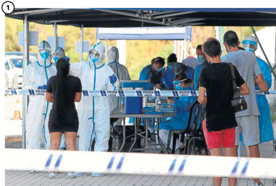
Centenares de test a los clientes de la discoteca Oasis de Santa Pola (Alicante)

El personal sanitario de la localidad alicantina de Santa Pola comenzó ayer a realizar pruebas PCR a todas las personas que estuvieron en la discoteca Oasis los días 10,11 y 12 de julio ante la aparición de un brote de Covid-19 con origen en la misma. Hasta ayer se habían detectado 11 positivos.