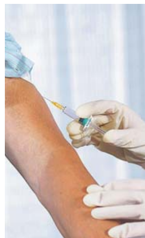
La vacuna sirve para prevenir la neumonía. CAM

Sanidad indica asimismo que en el actual contexto epidemiológico es de especial relevancia la prevención de enfermedades respiratorias y de las hospitalizaciones que causan el neumococo y la gripe, que se agravan principal-