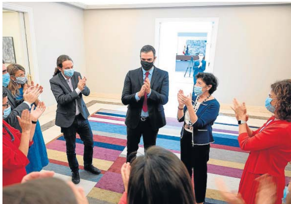
El presidente del Gobierno fue recibido con aplausos por sus ministros a su llegada a Moncloa.

CLARA PINAR clara.pinar@20minutos.es / @Clara_Pinar