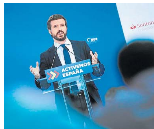
Pablo Casado, ayer, en un acto del Partido Popular.

La llegada de fondos de la UE para engrosar los Presupuestos tampoco hace que el Gobierno abandone su reforma fiscal para subir impuestos como el de Sociedades o el IRPF a las rentas más altas. Montero afirmó ayer que eso sería «hasta contradictorio» y no «hacer los deberes» ante la ayuda europea. La subida de impuestos «permitirá que nuestros ingresos se parezcan más a los de países de nuestro entorno». «Lo que no puede ser es un Estado que solicite lo que necesita no haga sus propios deberes». ●