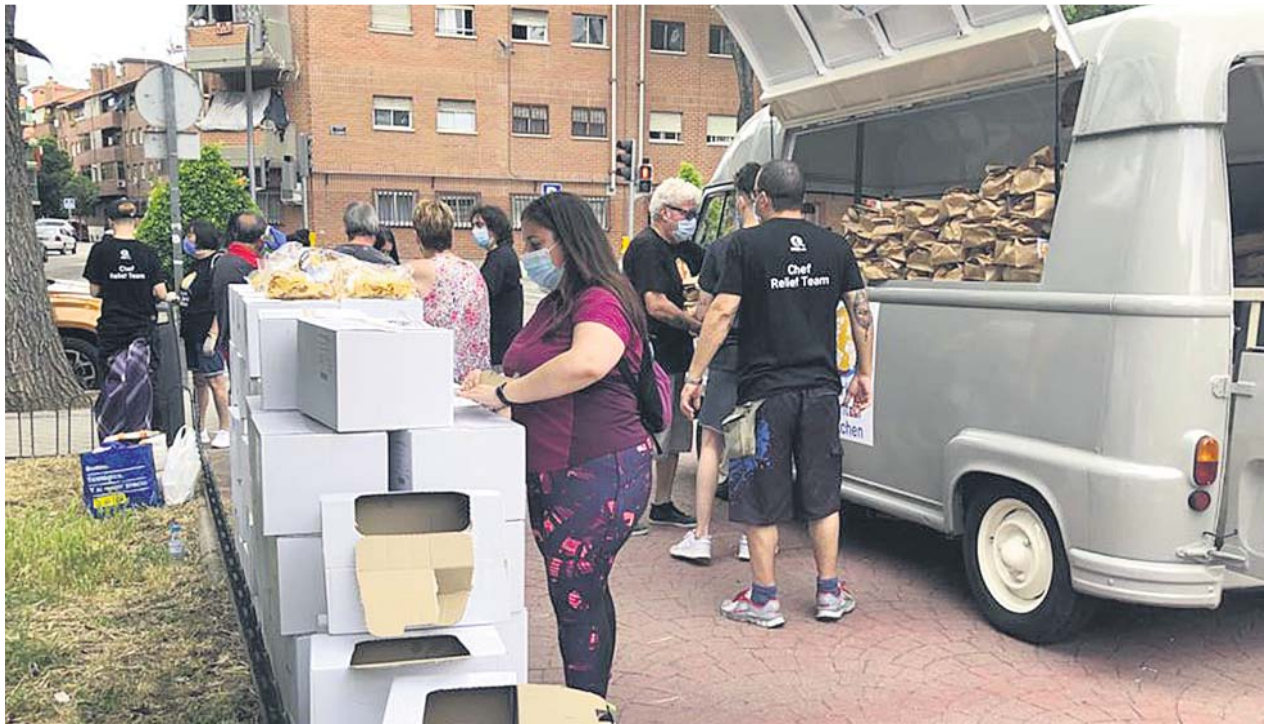
Voluntarios reparten alimentos desde un foodtruck que aparcan cada día frente a la Junta municipal. ASOCIACIÓN VILLAVERDE ALTO