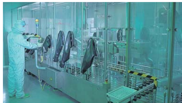
Un trabajador de Rovi en la planta de San Sebastián de los Reyes.

El Ministerio de Sanidad y la Agencia Española del Medicamento y Productos Sanitarios (Aemps) mantuvieron contactos con fabricantes, entre los que se incluye esta compañía,