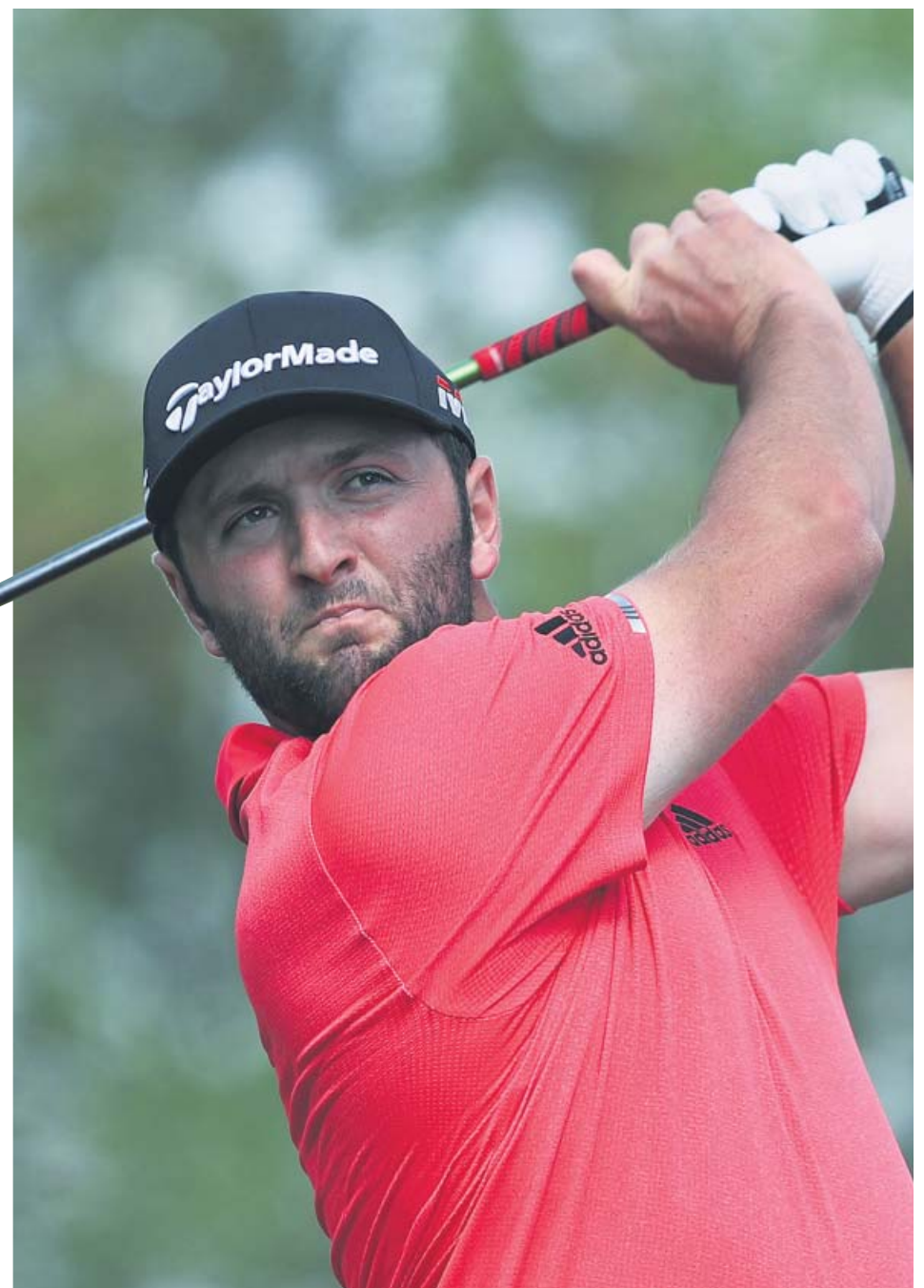
Jon Rahm golpea la bola durante el torneo de Dubái.

Lo segundo ya lo ha alcanzado y los grandes especialistas no descartan la primera de sus osadías porque tiene la calidad necesaria y el temple preciso para dominar la disciplina con la que Seve Ballesteros hizo que en España hubiera seguidores del deporte del palito aunque nunca hubieran visto jugar al golf a nadie nacido en España. ●