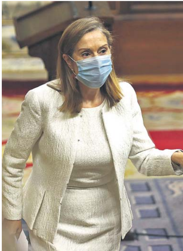
La portavoz del PP en la comisión, Ana Pastor.

De momento, están por ver los apoyos al borrador de conclusiones de PSOE y Unidas Podemos que han servido de base a una exigua negociación de enmiendas. Horas después de aquel acuerdo en la UE, la portavoz del Gobierno, María Jesús Montero, deseó que la «atmósfe-