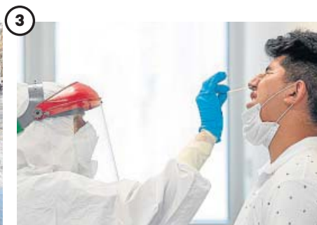
... Y más pruebas PCR en Totana (Murcia)

Una trabajadora desinfecta la mesa de la terraza de uno de los locales hosteleros de Ermua, Vizcaya, que han vuelto a la fase 2 tras las limitaciones impuestas por el Gobierno vasco.