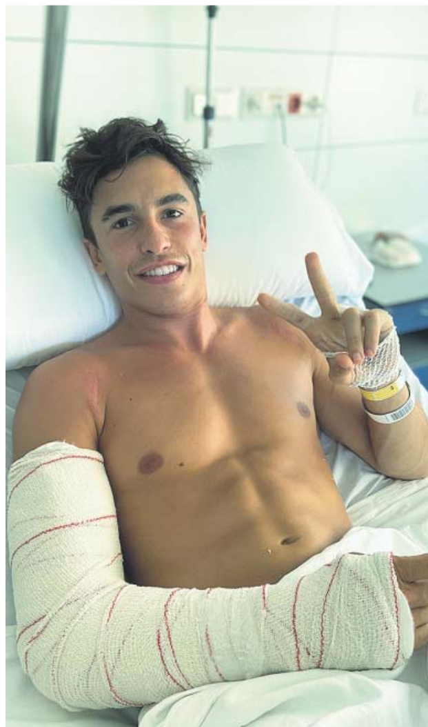
Márquez, optimista tras la operación.

De momento, el piloto del equipo Repsol Honda se está recuperando de la intervención y permanecerá ingresado entre las próximas 24 y 48 horas. «Su objetivo es regresar al Campeonato del