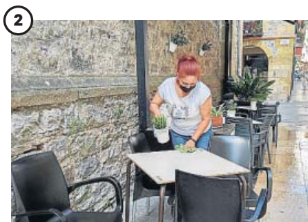
Vuelta a la fase 2 para los hosteleros vascos

El personal sanitario de la localidad alicantina de Santa Pola comenzó ayer a realizar pruebas PCR a todas las personas que estuvieron en la discoteca Oasis los días 10,11 y 12 de julio ante la aparición de un brote de Covid-19 con origen en la misma. Hasta ayer se habían detectado 11 positivos.