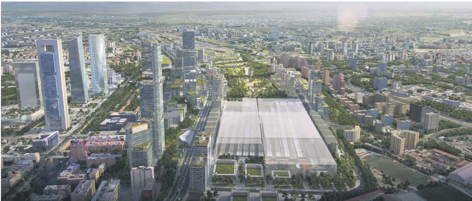
El proyecto incluirá la creación de nuevas estaciones de Metro y Cercanías y una torre de 300 metros de altura. DCN