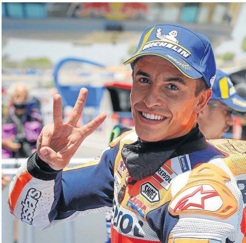
Marc Márquez se probará mañana y, si está listo, pilotará el domingo.

Todo apunta a que disputará la carrera, pero Alberto Puig advierte de que irán despacio. «Originalmente, claramente, la posición de Honda era no correr esta carrera e intentarlo en Brno. Pero, después de lo que vimos y lo que oímos de Marc y los doctores, que le han declarado apto, hemos llegado a un acuerdo. Lo intentará el sábado y dependiendo de cómo se sienta, tratará de correr, pero le hemos pedido que se pruebe el sábado primero para ver si realmente es capaz de hacer la distancia. Desde el pasado domingo a hoy las cosas han ido muy deprisa y francamente estamos sorprendidos», admitió el jefe del Repsol Honda.