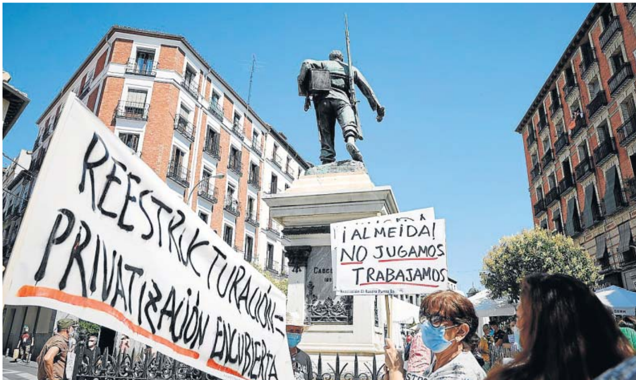
La concentración del pasado 5 de julio para denunciar que El Rastro está «amenazado».