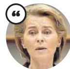
URSULA VON DER LEYEN Presidenta de la Comisión Europea

«El acuerdo proporcionó luz al final del túnel, pero la sombra tiene forma de un presupuesto de la UE muy ajustado»