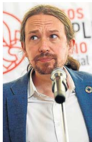
El vicepresidente Pablo Iglesias, hace unos días.

En dicho informe, la empresa se responsabiliza de parte de los daños que presenta la tarjeta, pese a que tampoco pudo acceder a su contenido con los métodos que probó. Cuando recibió el dispositivo, señala la compañía, éste «no tenía cor-