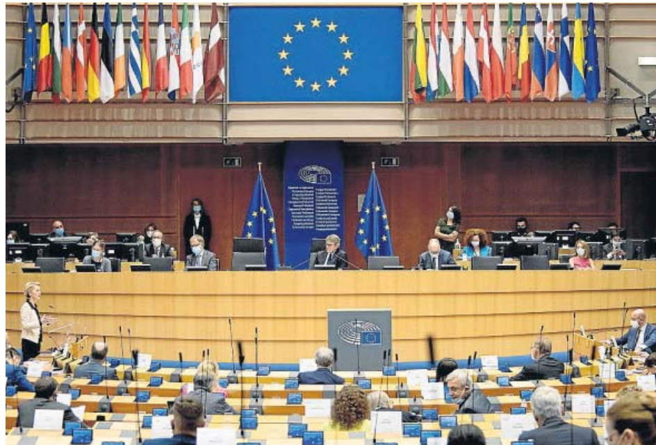
Vista del pleno de ayer en el Parlamento Europeo sobre los fondos ante la crisis del coronavirus.