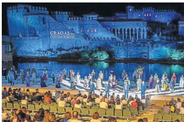
Puy du Fou homenajeó a los sanitarios en la reapertura.

El parque Warner procederá a la desinfección total de las instalaciones dos veces al día. Las personas que no tengan una relación interpersonal no podrán sentarse juntas en las atracciones.