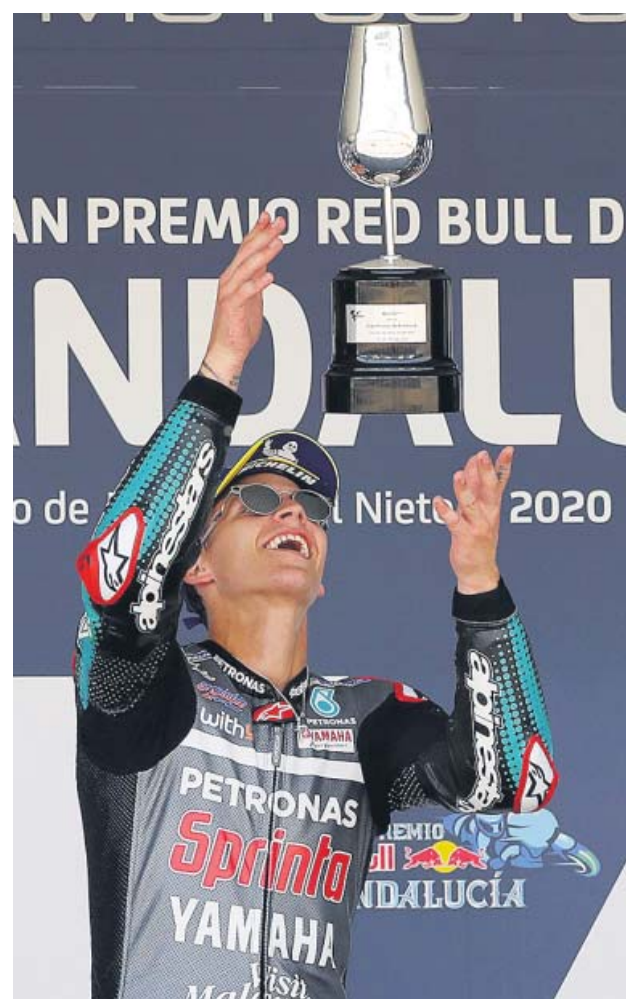
Fabio Quartararo celebrando su victoria en Jerez.

En Moto2, el italiano Enea Bastiniani logró su primera victoria por delante de dos compatriotas, Luca Marini y Marco Bezzecchi. El mejor español de la categoría fue el debutante Arón Canet, quinto. Y en Moto3, el japonés Tatsuki Suzuki se adjudicó el triunfo con el británico John McPhee y el italiano Celestino Vietti de escuderos en el podio. Albert Arenas sigue siendo líder del Mundial pese a no sumar ni un solo punto ayer al sufrir una caída. ● R. D.