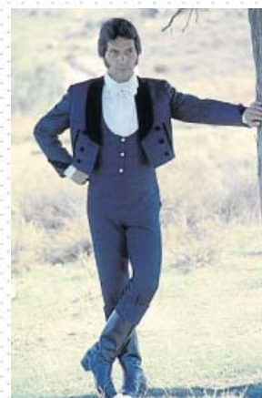
El actor Sancho Gracia, durante el rodaje.

Y de ahí, también, que sus referentes visuales incorporen imágenes como el Duelo a garrotazos de Goya. La buena selección de directores, algunos fogueados en el desierto de Tabernas (Joaquín Romero Marchent) y otros con prestigio bien ganado (Francisco Rovira Beleta, Mario Camus, Pilar Miró), ayudó a darle empaque visual al conjunto.