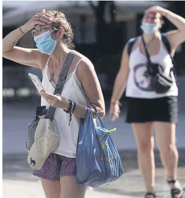
El calor ya fue ayer sofocante en Córdoba.

Pero aunque no se haya activado ningún aviso por ola de calor, eso no impide que en