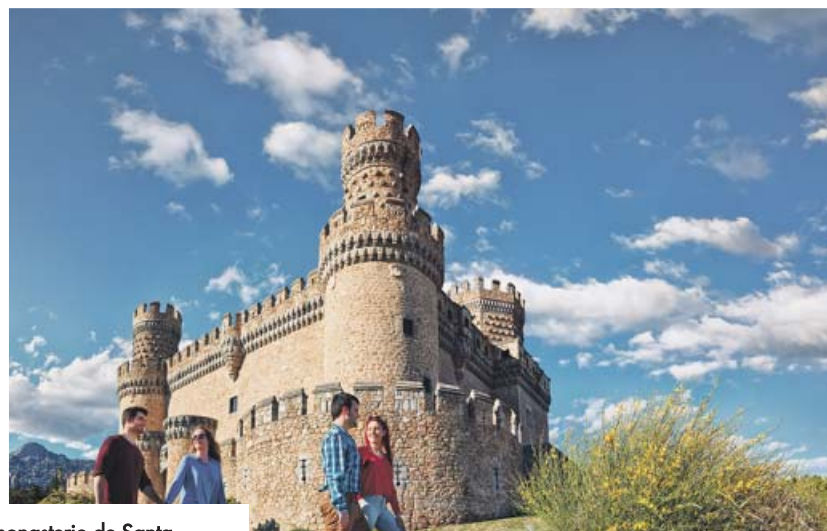
Claustro del monasterio de Santa María la Real, en San Martín de Valdeiglesias (izda.). Sobre estas líneas, el castillo de los Mendoza de Manzanares el Real. Debajo, el puente del Perdón de Rascafría y la Plaza Mayor de Colmenar de Oreja.