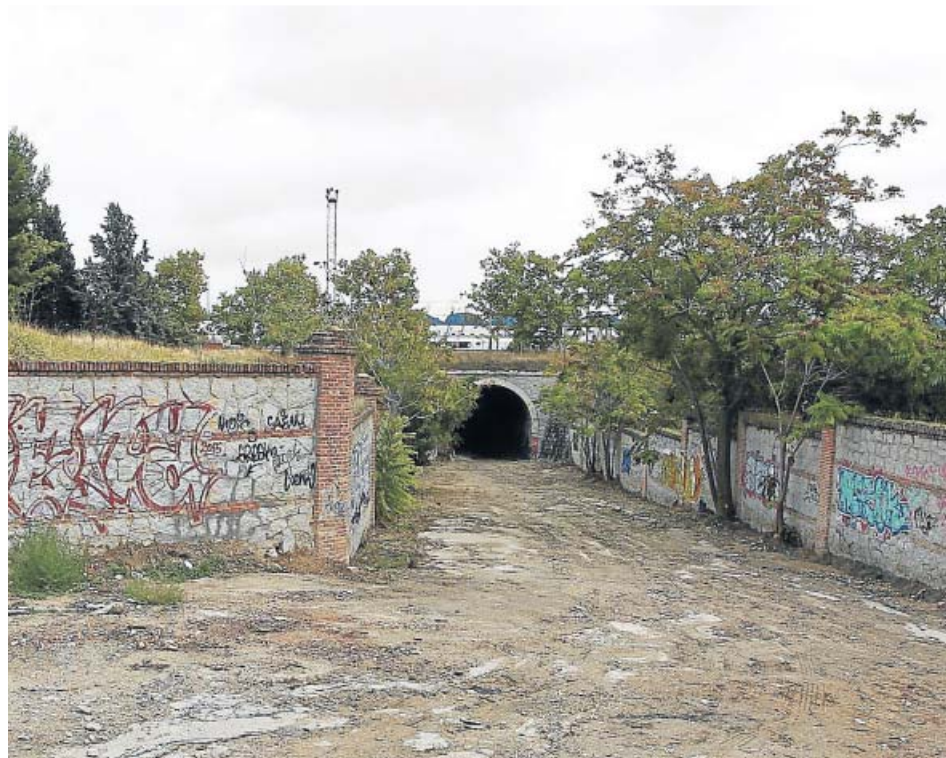
El túnel de Las Tablas, en su salida a la calle Antonio Cabezón. JORGE PARÍS

Al otro lado de la ciudad, en sentido sur, los vecinos de Villaverde reivindican otra demanda histórica. Se trata del acceso peatonal a la estación de Cercanías de la zona baja del distrito. «Lo que debería cruzarse en 10 segundos, se complica a 10 minutos por las vueltas que