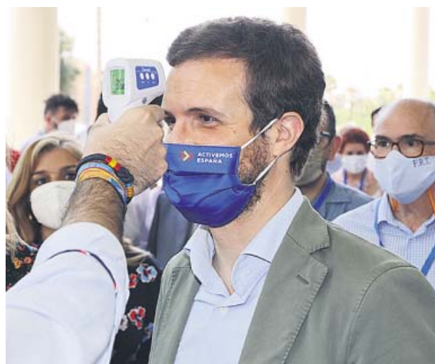
Pablo Casado se toma la temperatura el sábado pasado.

«Ni siquiera es capaz de aprobar un protocolo específico para el aeropuerto de Barajas, principal puerta de