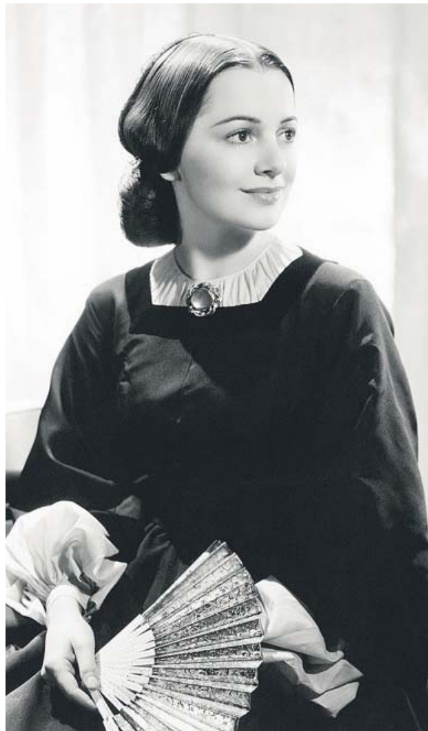
La actriz Olivia de Havilland en Lo que el viento se llevó . GTRÉS

Nacida en Tokio (Japón) en 1916, De Havilland se mudó