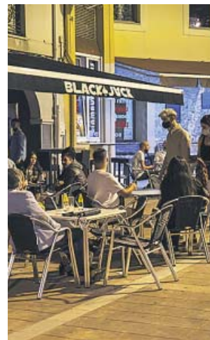
Una terraza de un local de ocio nocturno.

de mayo se iniciara la desescalada del confinamiento, se ha puesto de manifiesto que la actividad reglada de estos locales, y sometida a restricciones tan severas como el 33% del aforo, la limitación de los horarios, o la prohibición de la utilización de las pistas de baile, no tenían prácticamente incidencia en la evolución de la enfermedad ni de los contagios del coronavirus», consideró la patronal.