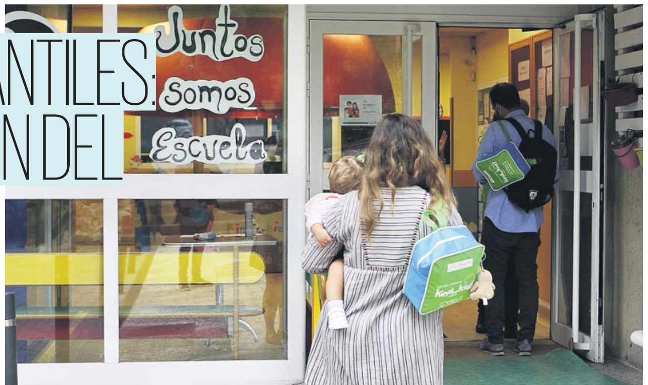
Varios padres llevan a sus hijos a la escuela infantil Kind For Kids, situada en Madrid.

A las puertas de la escuela, los padres consultados resaltan que su situación, laboral y personal, les aboca a tener que re-