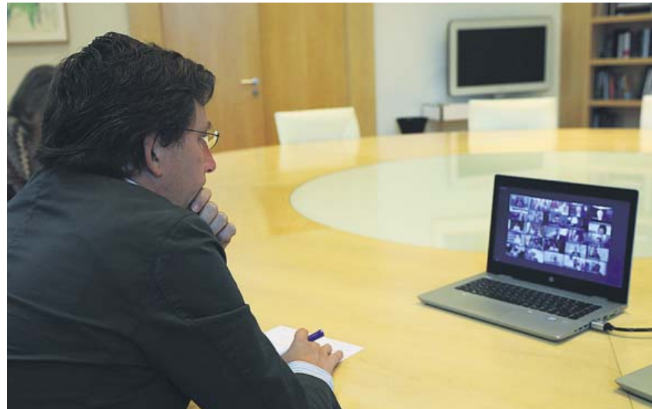
El alcalde de Madrid, José Luis Martínez-Almeida, durante la reunión telemática.

Ya lo adelantó la alcaldesa de Barcelona en su cuenta de Twitter: «El decreto de Hacienda no tiene apoyos para salir adelante (en el Congreso)». Y al hilo de las palabras del alcalde de Madrid –«los ayuntamientos no pode-