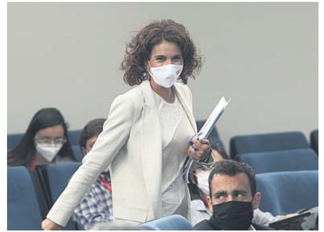
La portavoz del Gobierno, ayer, tras el Consejo de Ministros.

Esta idea se acerca al permiso retribuido al que se refirió la ministra de Educación, Isabel Celaá, hace unos días. La ministra de Trabajo, Yolanda Díaz, rechazó tal posibilidad y Sánchez no la mencionó ayer. ●