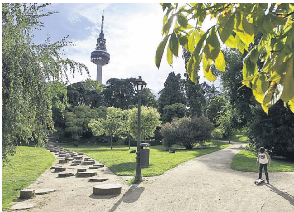
Parque de Fuente del Berro, en Madrid, durante la tarde de ayer antes de su cierre.

La capital cerró ayer sus piscinas públicas y ha ordenado el cierre de sus parques y jardines de 22.00 a 8.00 horas, con el objetivo de anticiparse con medidas preventivas ante la segunda ola de coronavirus. El objetivo es evitar concentraciones, aglomeraciones de personas y botellones. «Todos sabemos que las hay y se producen contagios», explicó la vicealcaldesa, Begoña Villacís. Medidas similares ha tomado Fuenlabrada o San Fernando. ●