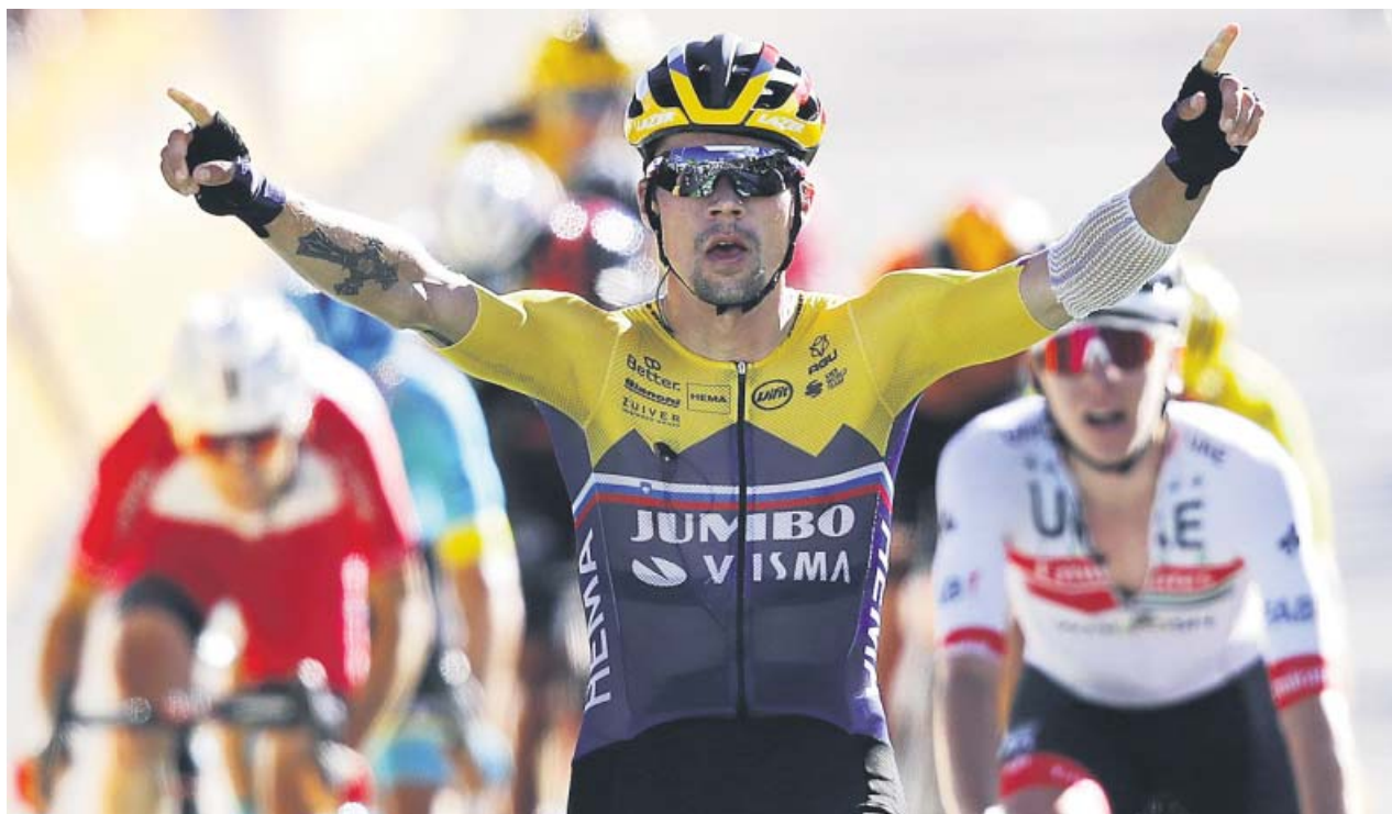
Roglic cruzando la meta, ayer, en primera posición.