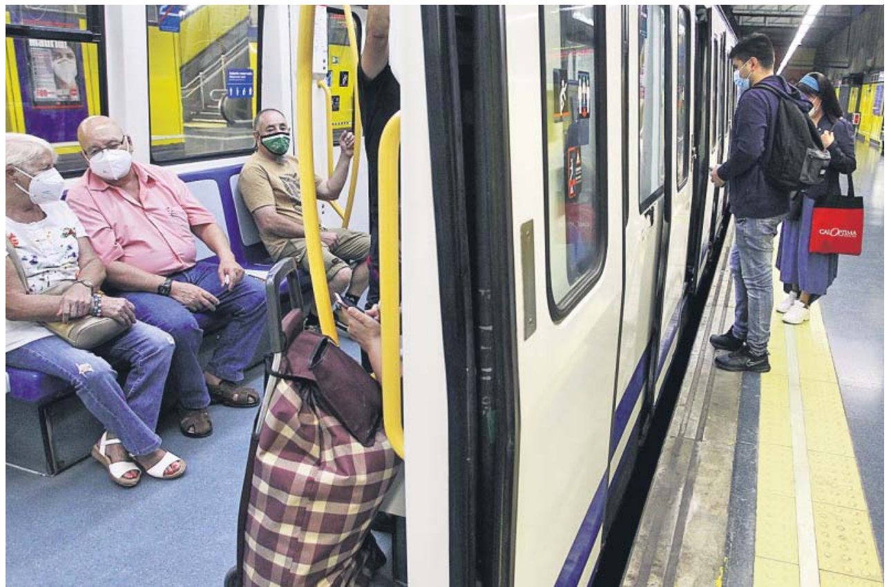
Usuarios de metro en una estación de la línea 1. JORGE PARIS

En todas ellas habrá personal de Metro controlando que no se produzcan dichas aglomeraciones ni en los vagones ni en los andenes cuando, por ejemplo, haya una incidencia grave. «Podremos limitar el aforo en caso de incidencia grave para evitar que se concentre mucha gente y ordenar la salida de pasajeros», explicó Garrido desde el puesto de mando del suburbano, en la parada de Alto del Arenal.