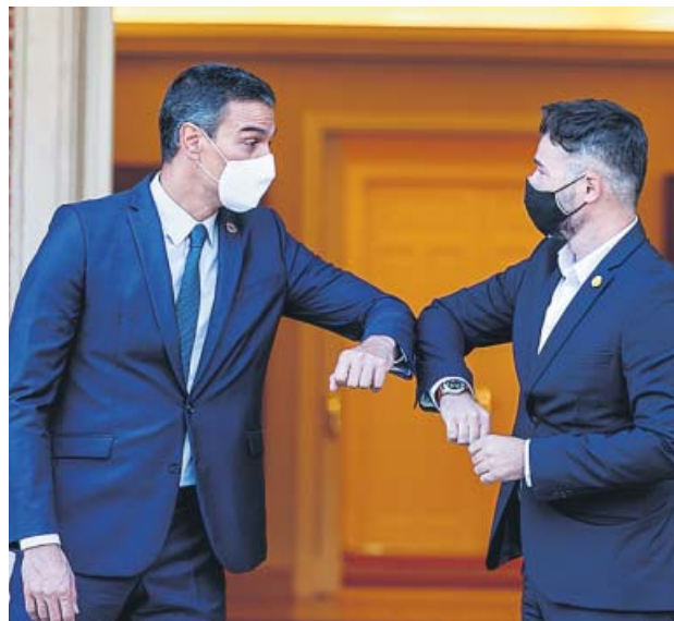
Saludo de Sánchez y Rufián a su llegada a Moncloa.

A pesar de estas advertencias, Sánchez no recogió el guante y no entró a elegir entre un partido y otro. «Este Gobierno no va a elegir entre unos y otros. Este Gobierno va a trabajar con todos y hace un llamamiento por igual pidiendo generosidad al resto», dijo Montero. Un día después de celebrar que Arrimadas se aviniera a pactar unas cuentas «moderadas» y tras insistir en que la subida de impuestos no llegará aún en 2021, Montero aseguró ayer a Rufián que los Presupuestos que prepara el Gobierno contemplarán «políticas progresistas».