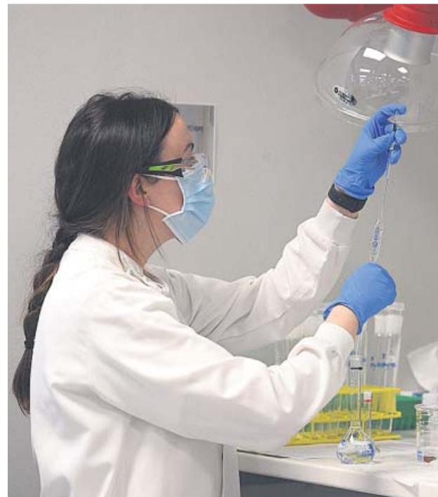
Una investigadora de AstraZeneca trabajando en una vacuna.

Sobre las indemnizaciones de la UE a los fabricantes para costear posibles demandas civiles por efectos secundarios, en Bruselas argumentan que los estándares de fabricación se mantienen en este caso y que el único escenario, «poco pro-