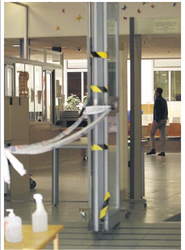
Entrada del albergue de San Isidro, ayer.

A las más de 600 casas okupadas y a los 12 solares se suman otras dos naves de propiedad municipal y un total de 41 viviendas de la empresa municipal de viviendas (EMVS), en este último caso, sumidas en problemas contractuales con segundas generaciones de anteriores inquilinos. Para ello, el Ayuntamiento tiene en marcha un plan antiokupación a través del cual «desalojar y derripar naves e inmuebles okupados en muy mal estado y donde se realizan actividades delictivas». También tiene ideada una Oficina Municipal Antiokupación para asesorar a las comunidades que no sepan cómo enfrentarse a este problema. ●