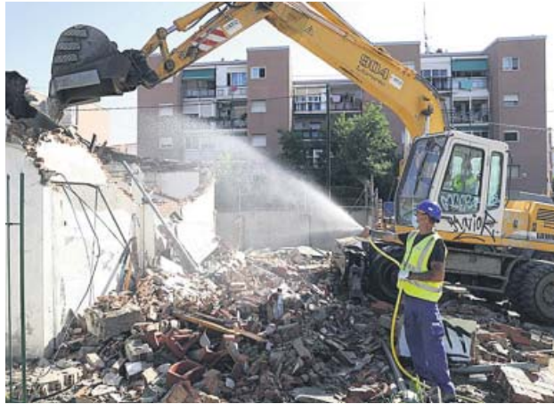
La última vivienda derribada por riesgo de okupación.

El contrato es plurianual y está dotado con 1,4 millones de euros en tres años con los