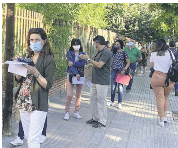
Filas junto al Instituto María Zambrano de Leganés.

Así, en ninguno de los sitios en la capital se repitieron las aglomeraciones, aunque sí