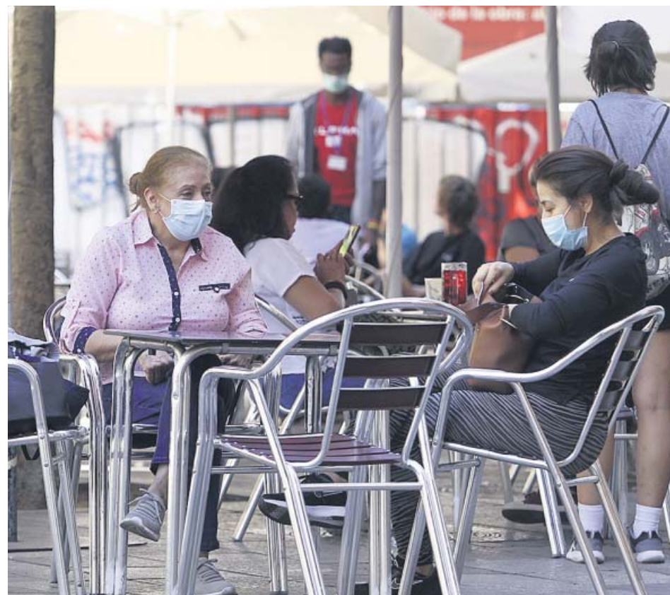
Dos mujeres sentadas en una terraza con la mascarilla obligatoria. JORGE PARÍS

TUI solo seguirá operando vuelos a sus dos principales destinos españoles, que son Málaga y Alicante, a partir del 10 de septiembre, con tres vuelos por semana. ●