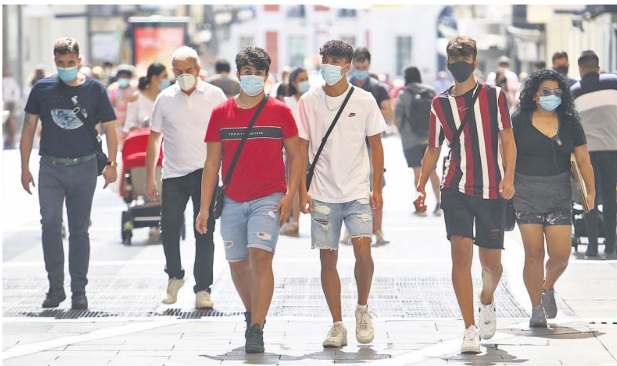
Un grupo de personas caminan por la calle Preciados, en Madrid, ayer por la mañana.

JAVIER LÓPEZ MACÍAS javier.macias@20minutos.es / @23javilo