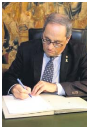
El presidente de la Generalitat, Quim Torra.