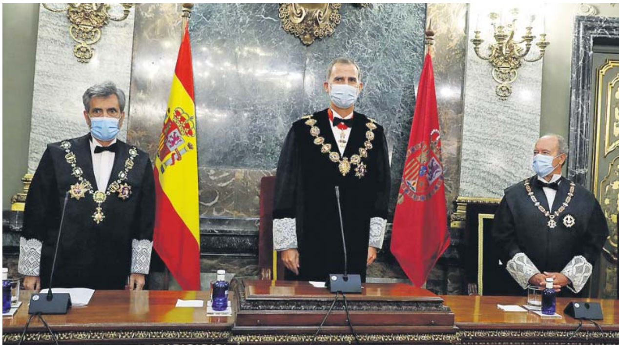
Felipe VI, en el Supremo, entre el presidente del CGPJ, Carlos Lesmes (izquierda), y el ministro de Justicia, Juan Carlos Campo.