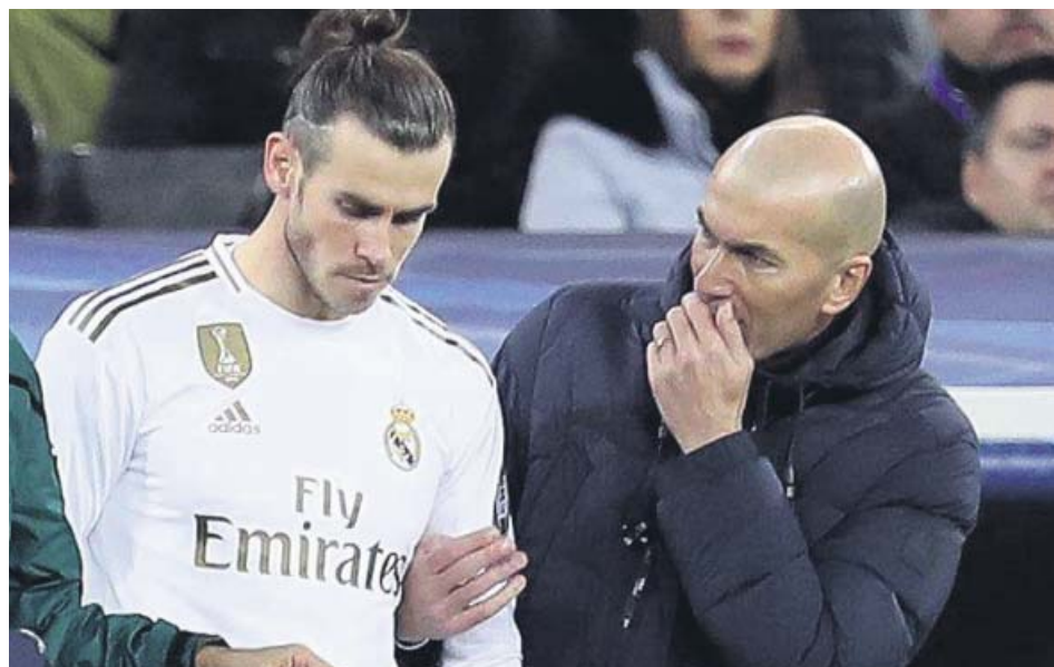
Bale recibiendo instrucciones de Zidane antes de entrar al campo en un partido.

El 'caso Bale' continúa enquistado en una situación que resulta de lo más paradójica, pues ambos desean lo mismo pero el acuerdo no llega. Fue el propio jugador galés el que dejó claro la semana pasada que no quiere continuar en el Real Madrid y que la única razón de que no haya salido aún es que el club, según sus propias palabras, no le ha dejado. «¿Irme? Quiero jugar al fútbol, me siento en forma. Está en manos del club, pero ponen las cosas muy difi-