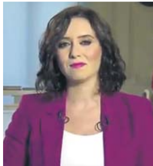
Isabel Díaz Ayuso, ayer.

Ante el curso escolar que definió como el «más difícil» de la historia de la Comunidad, pidió a las familias «comprensión y colaboración» e invitó a los partidos políticos, a los medios de comunicación y a las fuerzas sociales a retomar el espíritu de las primeras fases de la pandemia, cuando primó la «solidaridad». «Hoy hay mucho alarmismo y confusión, que no