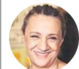
BLANCA PORTILLO Actriz

«Puedes ir en un AVE o un metro abarrotado, pero hay que reducir el aforo de los teatros, lo cual es un error»