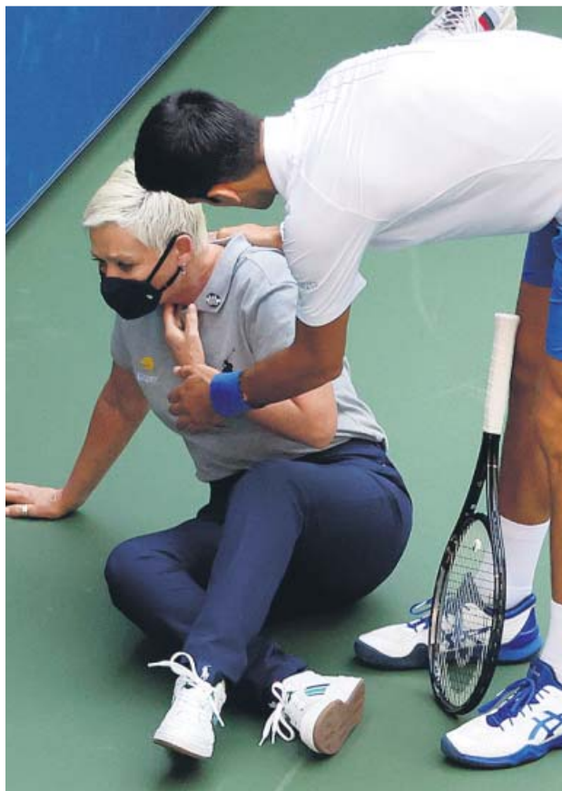
Djokovic auxilia a la jueza de línea víctima de su pelotazo.

El primer gran borrón llegó en el Adria Tour, un torneo benéfico auspiciado por él para colaborar en la lucha contra el coronavirus. La bonita iniciativa se truncó por la imprudencia de una fiesta loca en Zadar la noche anterior, bien documentada en redes sociales, sin mascarillas ni distancias de seguridad que acabó con los positivos del propio Djokovic, además de Dimitrov, Troicki y Coric, además de las novias de tres de ellos, una de ellas embarazada. El