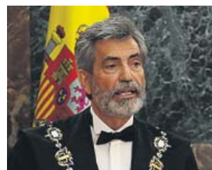
El presidente del CGPJ, Carlos Lesmes.

Lesmes no concretó pero en los últimos meses se ha asistido a distintos criterios sobre una misma cuestión y en distintos tribunales. Uno de los casos a los que se han enfrentado los jueces es la autorización