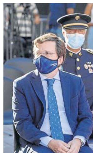
José Luis Martínez-Almeida, hace unos días, en un acto.

Consulta la última hora de todas las noticias relacionadas con el virus en nuestro país en la web 20minutos.es