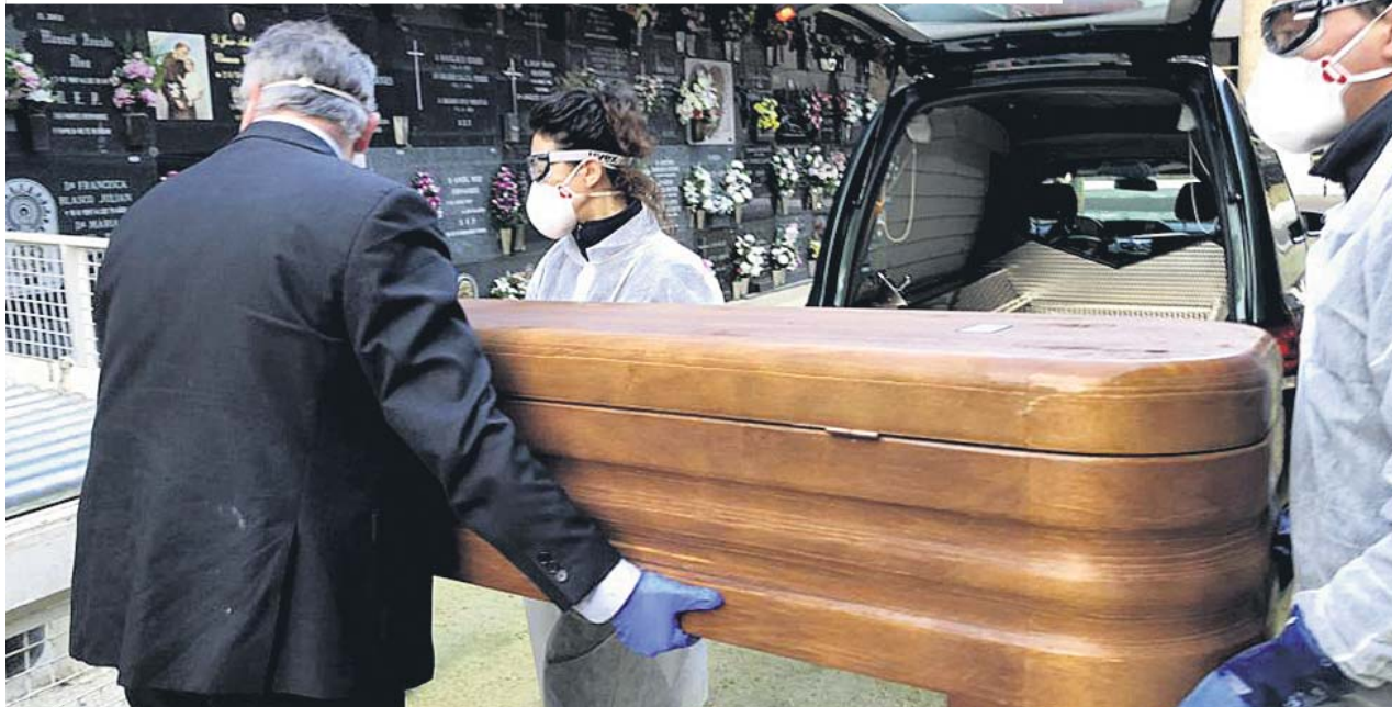
Trabajadores de una funeraria de Zaragoza trasladan el ataúd de un fallecido por coronavirus hasta el nicho. GERVASIO SÁNCHEZ

El gasto medio de un entierro sencillo en España ronda los 3.500 euros, pero si es por Covid-19 supone unos 500 euros más