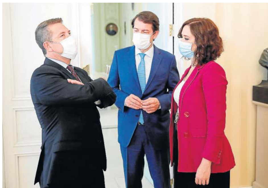
Page (PSOE), Mañueco (PP) y Ayuso (PP), ayer en la Real Casa de Correos.

Madrid, Castilla-La Mancha y Castilla y León compartirán también estudios de seroprevalencia y de rastreo, «en especial para analizar la movilidad entre las tres regiones», y realizarán «sistemas de evaluación diaria e intercambio de