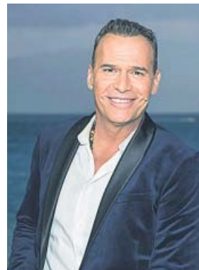
El presentador Carlos Lozano.

El más soliviantado sigue siendo Carlos Lozano, quien, durante la época estival, ha