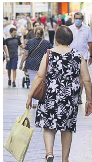
Una mujer de compras por las calles de Mérida.

Con la bajada de la confianza registrada en el mes de