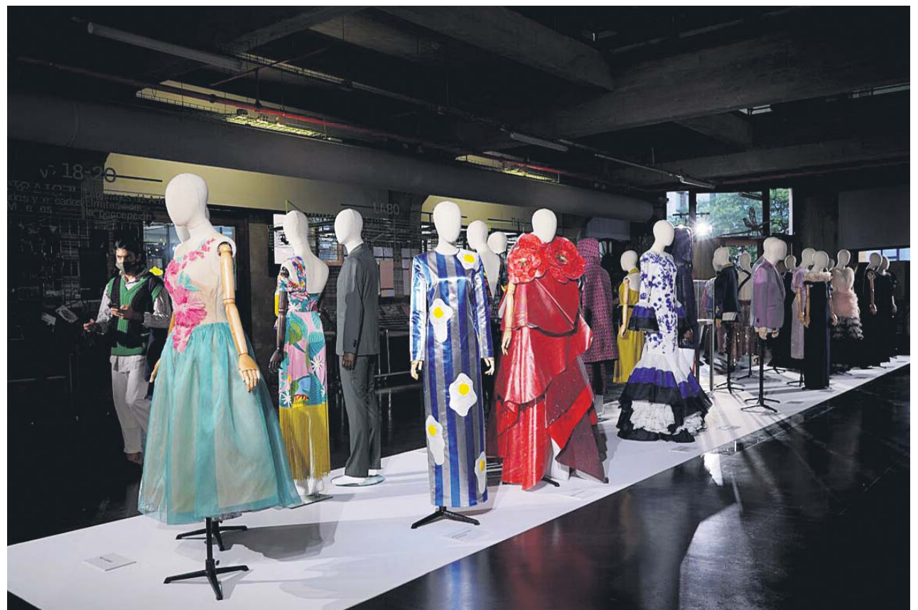
Las prendas que se exhibían ayer en la presentación de la nueva edición de Madrid es Moda.

Fomentar el consumo de marcas de lujo españolas, acercar el trabajo de los creativos y artesanos del sector al público final y promocionar Madrid como referencia en el mundo de la costura bajo estándares de