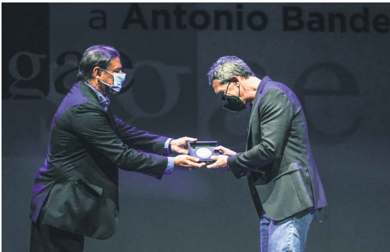
Antonio Banderas recibe la Medalla de Honor de la SGAE en los Premios Max.

El cantante, que ha alcanzado un acuerdo necesario con la madre de sus hijos, está con la lupa repasando las informaciones de unos y otros. No quiere dejar títere con cabeza. ●