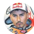
JORGE LORENZO Piloto español de MotoGP, ahora probador

«No corro porque ya no me apetece, no porque no pueda. Como probador me siento feliz, realizado, me cuidan bien»