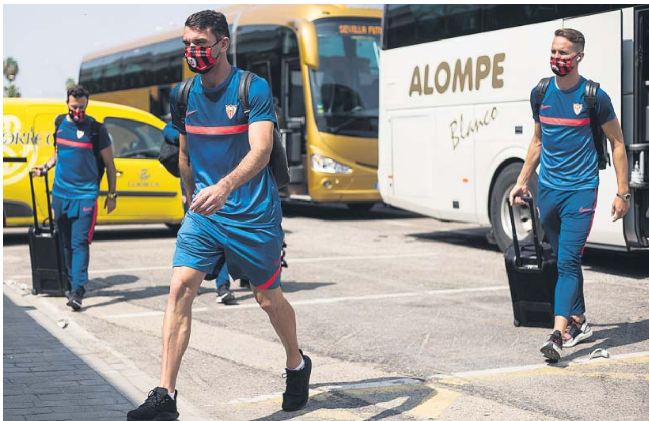
La plantilla sevillista, ayer, en su traslado a Budapest.

de sus vecinos austriacos o la picardía italiana. Estos países también han servido a los deportistas como lugares de formación para llegar al éxito con la bandera eslovena. ●