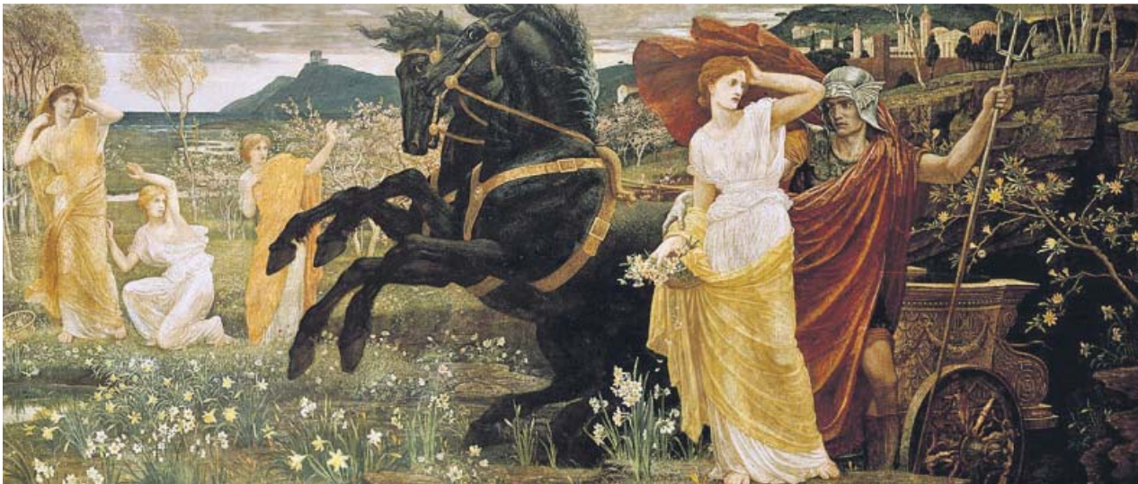
El destino de Perséfone, cuadro pintado por Walter Crane en 1877.