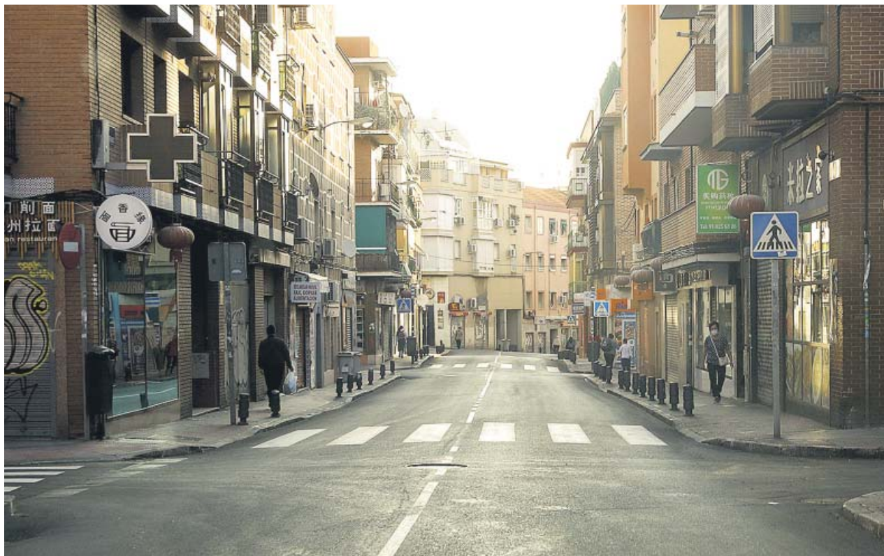
Comercios cerrados, ayer, en una calle de Usera que tiene impuestas restricciones desde el pasado lunes.

EL MINISTRO de Sanidad pide a los madrileños que restrinjan sus desplazamientos y sus contactos sociales