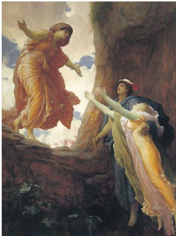
El regreso de Perséfone, de Frederic Leighton. LEEDS ART GALLERY

Hades acepta con la astuta imposición de un ayuno: Kore volverá a la luz, pero debe abstenerse de comer durante