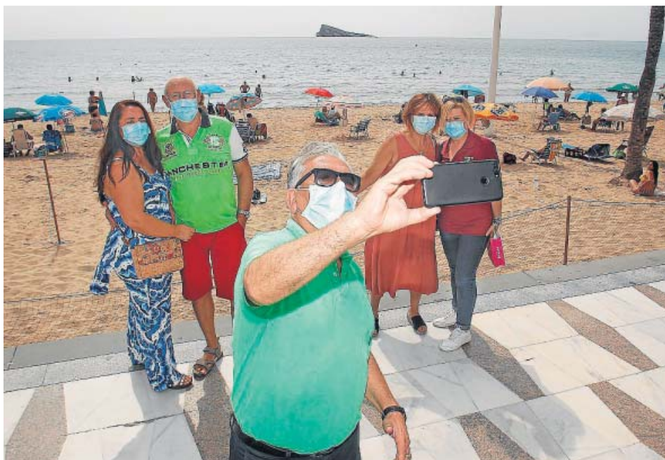
Un grupo de mayores haciendo turismo en la playa de Levante de Benidorm (Alicante).

PATRONALES Las agencias lamentan una decisión que supone un nuevo varapalo para el tocado sector turístico