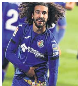
Cucurella y sus calzoncillos, protagonistas del gol.

El Getafe salió a por todas desde el primer minuto, con mucho ritmo, y al cuarto de hora de juego ya se había adelantado en el marcador mer-