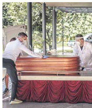
Operarios de una funeraria, con un féretro en Valencia.

to de Madrid fueron convocados ayer a una huelga para exigir un plan de contingencia, necesario en un contexto de emergencia sanitaria. ¿Su demanda principal? Un refuerzo de las plantillas con contratos hasta fin de año y más recursos que les permitan gestionar la emergencia sanitaria, y no volver a las «morgues improvisadas, las incineraciones de madrileños