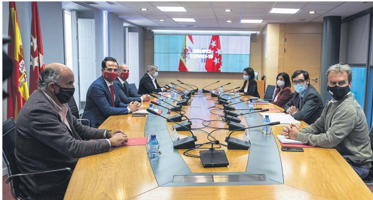
El Grupo Covid, entre ellos el vicepresidente madrileño, Ignacio Aguado, y el ministro de Sanidad, Salvador Illa, reunidos ayer.