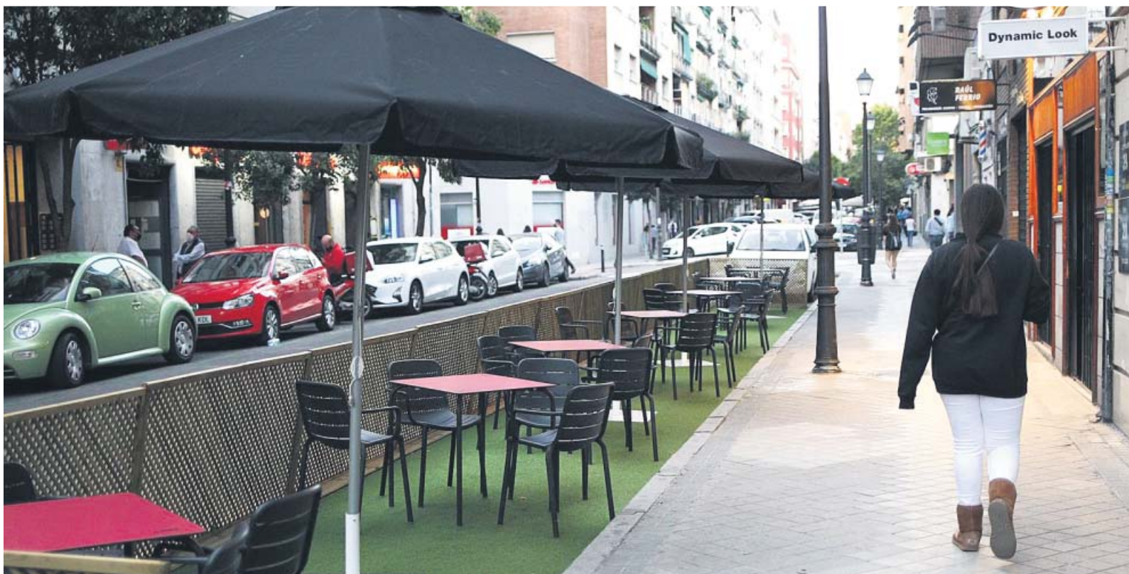
Una terraza en la calle Gaztambide (Moncloa) ocupa unas seis plazas.

VECINOS Dudan de que se hayan repintado los aparcamientos para residentes y piden saber su ubicación TERRAZAS El Ayuntamiento asegura que con cada permiso autorizado ocupa una media de 2,4 plazas