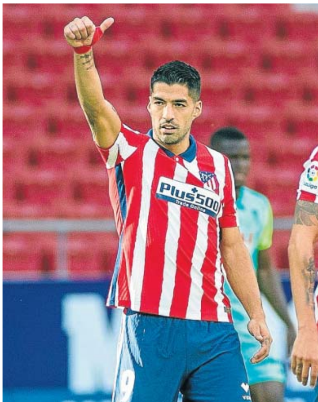
Luis Suárez (izqda.) y Sergio Ramos (dcha.) celebran sus goles en los partidos del fin de semana.