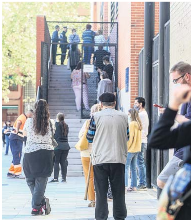
La Policía Municipal controlará los confinamientos.

El Boletín Oficial autonómico (BOCM) publicó ayer una orden de la Consejería de Justicia que dispone que las autoridades sanitarias facilitarán al servicio de emergencias los datos de personas con un diagnóstico positivo o que hayan tenido un contacto estrecho con un enfermo. A su vez, el 112 los transferirá a