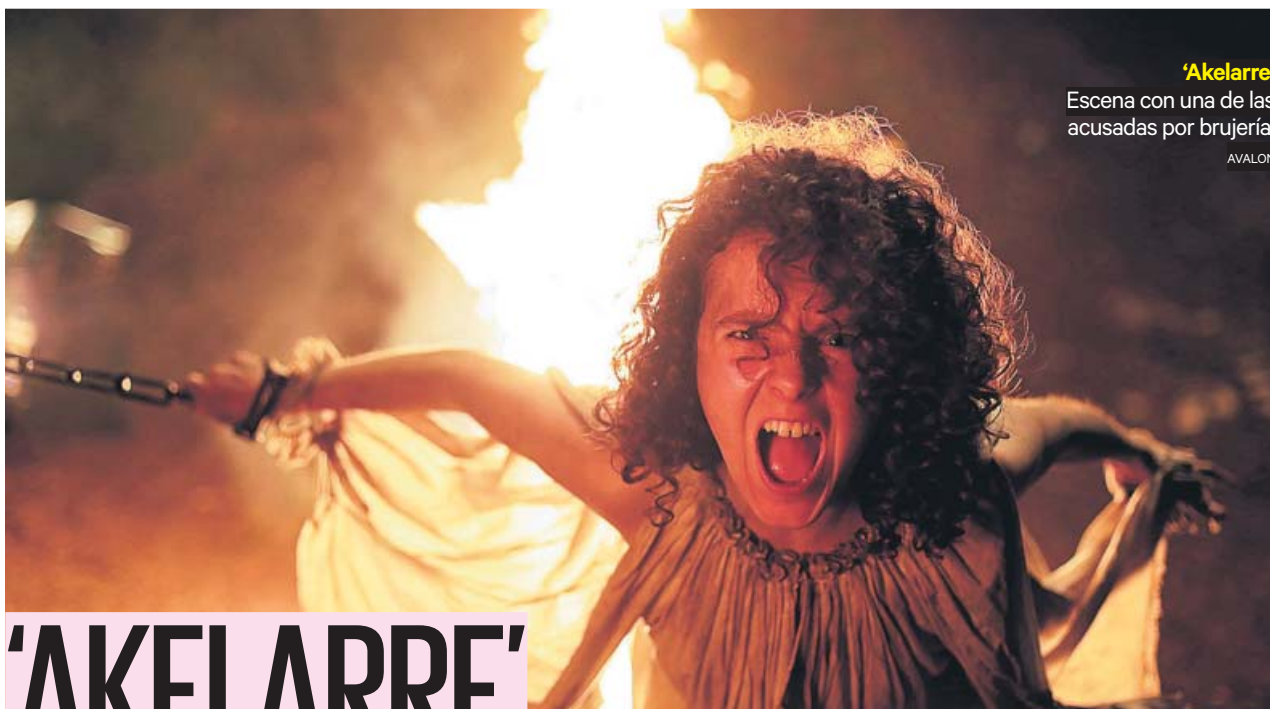
'Akelarre' Escena con una de las acusadas por brujería.