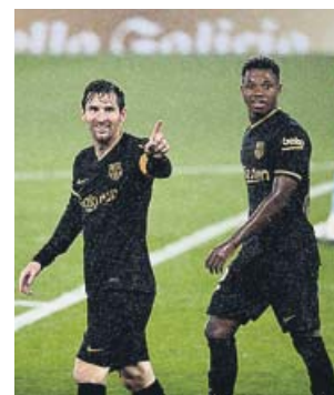
Messi y Ansu Fati, dos de los mejores del partido.

El sacrificado fue Antoine Griezmann, pero el Barça no lo acusó. Nada más salir de los vestuarios, una gran jugada in-