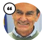
FERNANDO SIMÓN Director de CCAES

«Existe un nivel de transmisión no deseable que tenemos que asumir. Son cifras no catastróficas pero no alentadoras»