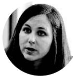
Ione Belarra Secretaria de Estado para la Agenda 2030

Si hablo de la Agenda 2030 probablemente muchos de nuestros lectores y lectoras no sabrán exactamente a qué me estoy refiriendo. El CIS publicaba hace unos días que apenas el 30% de la población española sabe qué es la Agenda y los Objetivos de