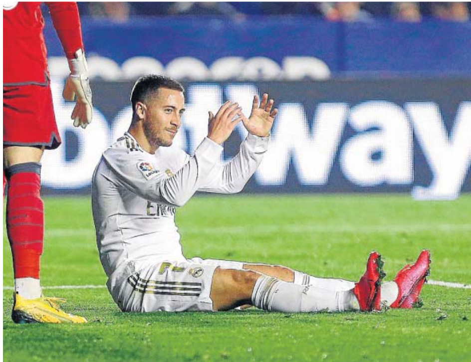
Eden Hazard se lamenta en un partido de la Liga.

No fue, sin embargo, su exceso de peso lo que empezó a condicionar su rendimiento, sino los problemas físicos. Una lesión muscular cuando la temporada estaba a punto de comenzar, a mediados de agosto, le dejó fuera de los terrenos de juego casi un mes. Le costó entrar en el equipo y coger la forma y, cuando se empezaba a ver una mejor versión del diablo rojo, una fi-