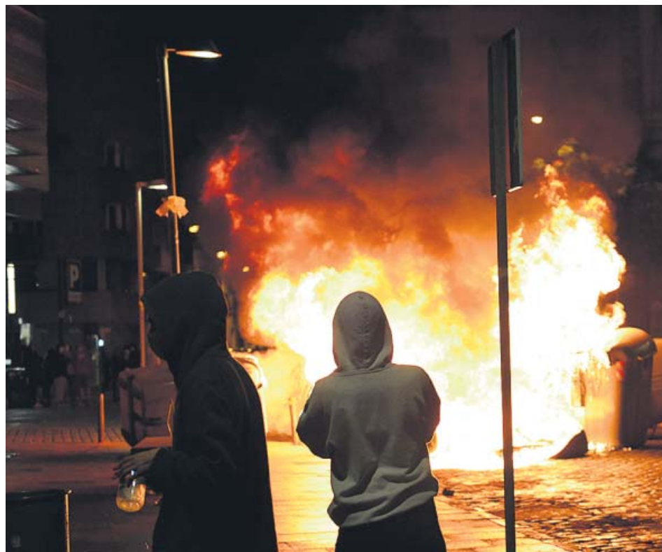
Miembros de los CDR montan una barricada con fuego en el centro de Girona.

Miembros de los autoproclamados Comités de Defensa de la República (CDR) quemaron anoche contenedores y montaron barricadas en las calles de Barcelona y Girona para conmemorar el tercer aniversario del referéndum independentista del 1-O. También lanzaron objetos contundentes contra los Mossos d'Esquadra, que llegaron a cargar contra los radicales en la plaza de Catalunya, en pleno centro de la capital catalana, donde al cierre de esta edición (23.00 h) los antidisturbios ya habían detenido al menos a 15 personas por desórdenes. ●