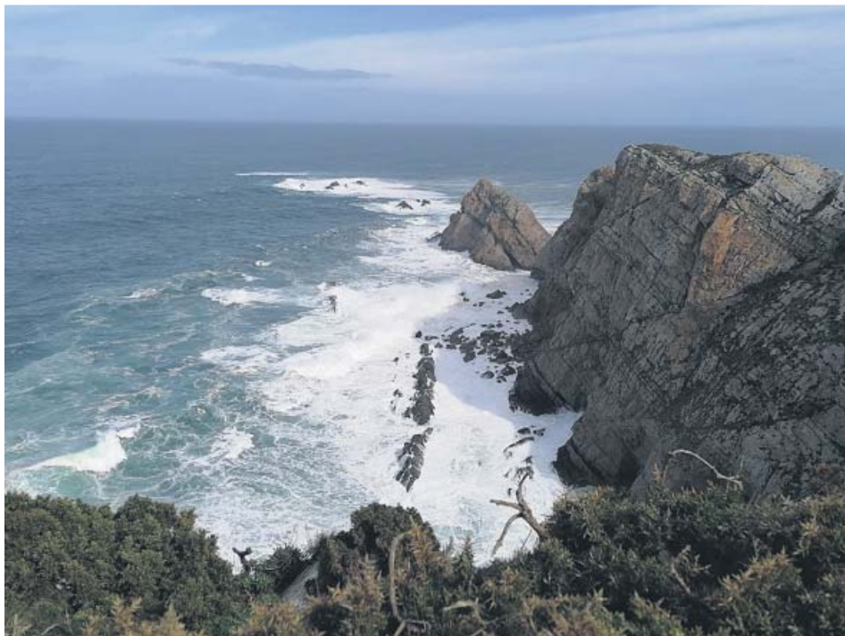
Cabo de Peñas (Asturias), una de las zonas donde se prevén vientos fuertes y oleaje. EP