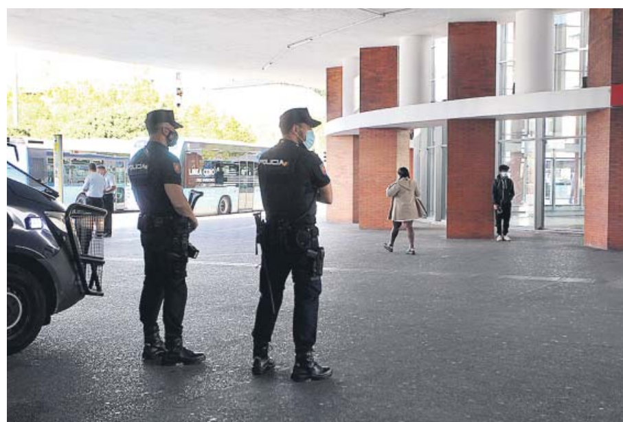
Agentes de la Policía Nacional vigilaban, ayer, la estación de Atocha. JORGE PARÍS