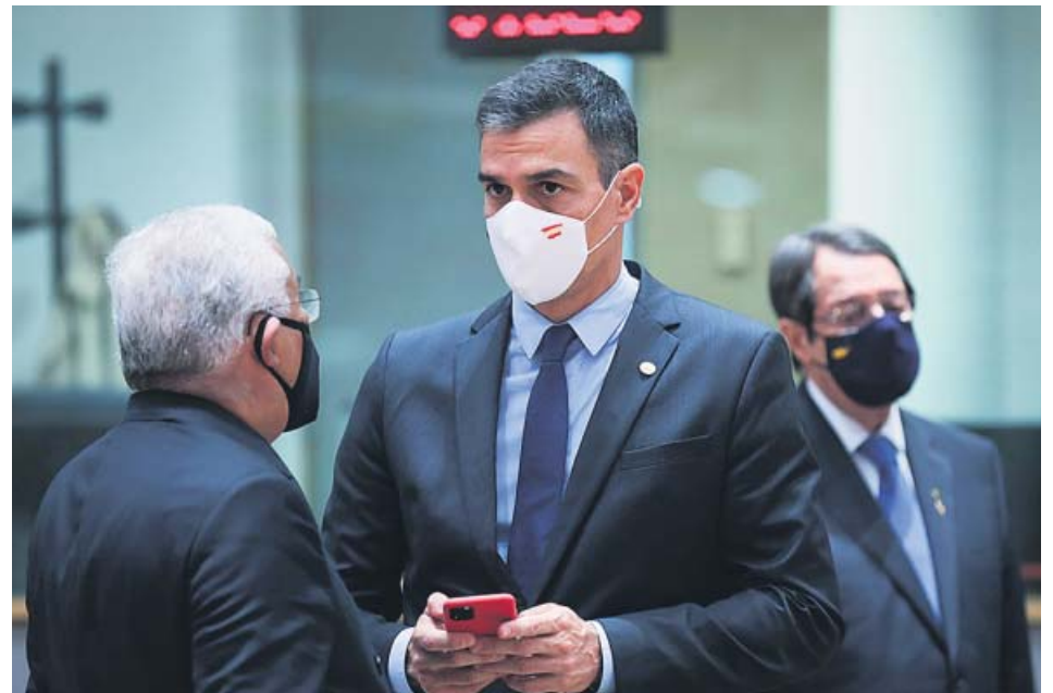
Pedro Sánchez habla con el primer ministro portugués, Antonio Costa, en Bruselas.