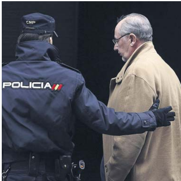
Rodrigo Rato, en una visita ante el juez para declarar.

Rato, por otro lado, asumió en su momento su responsa-