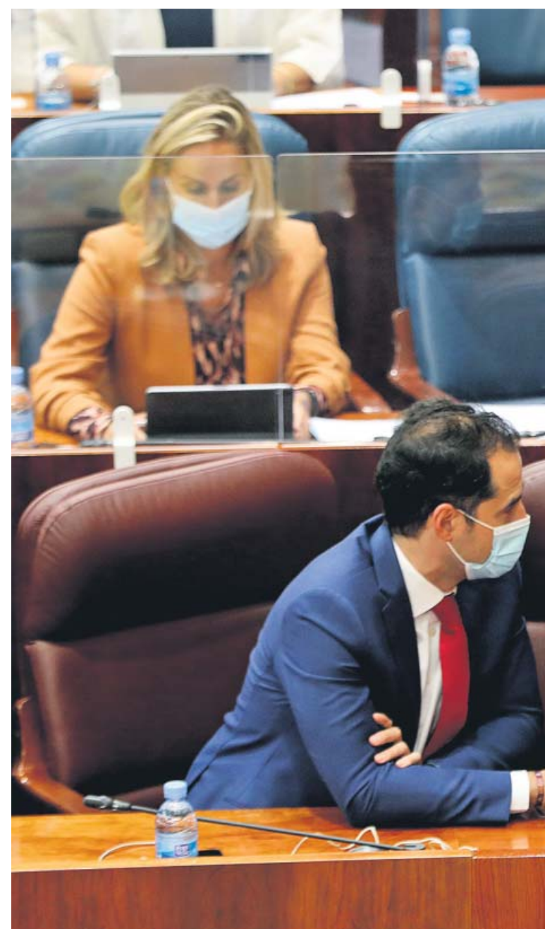
El vicepresidente Ignacio Aguado y la presidenta Isabel Díaz Ayuso

Así las cosas, el escenario que parece más probable es que el confinamiento de las citadas ciudades madrileñas no se producirá este próximo fin de semana, pero sí a lo largo de la semana que viene y estará vigente durante el próximo