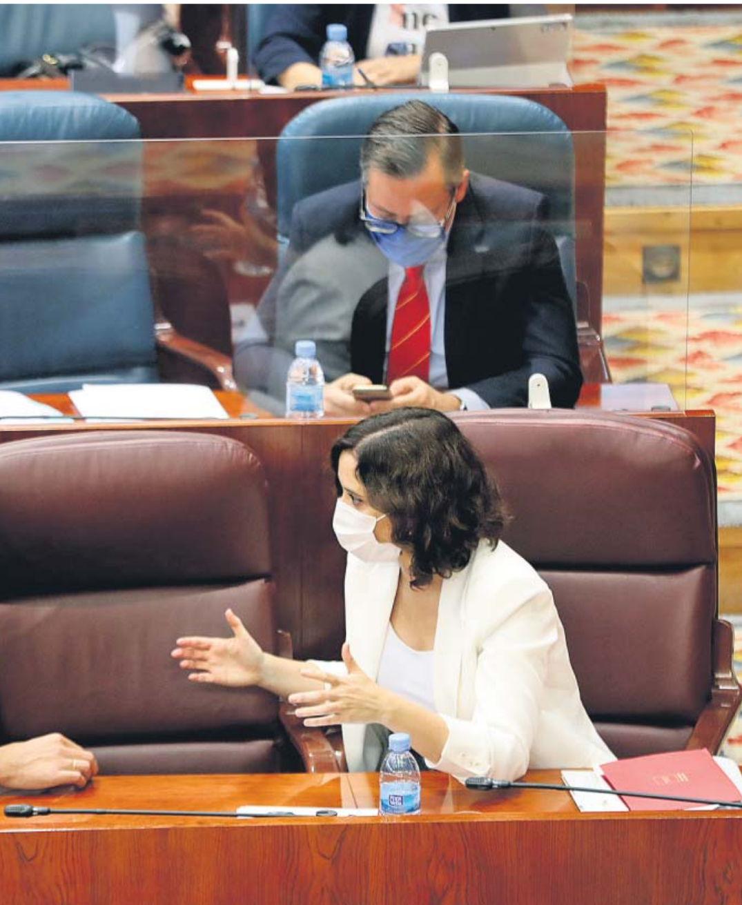
conversan, ayer, durante la sesión de control al Gobierno en la Asamblea.

las comunidades afectadas por la alta incidencia del virus podían declarar medidas extra para frenar contagios.