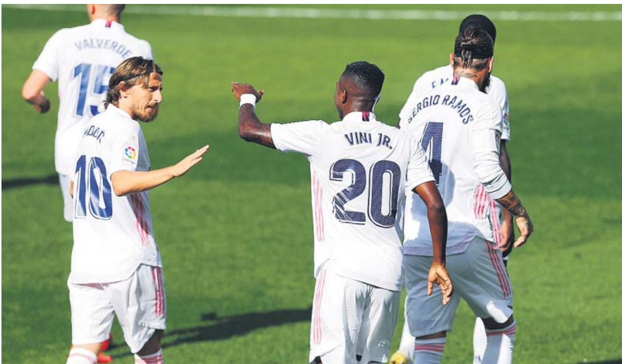
El delantero brasileño del Real Madrid Vinicius Júnior celebra con Luka Modric el primer gol ante el Levante.