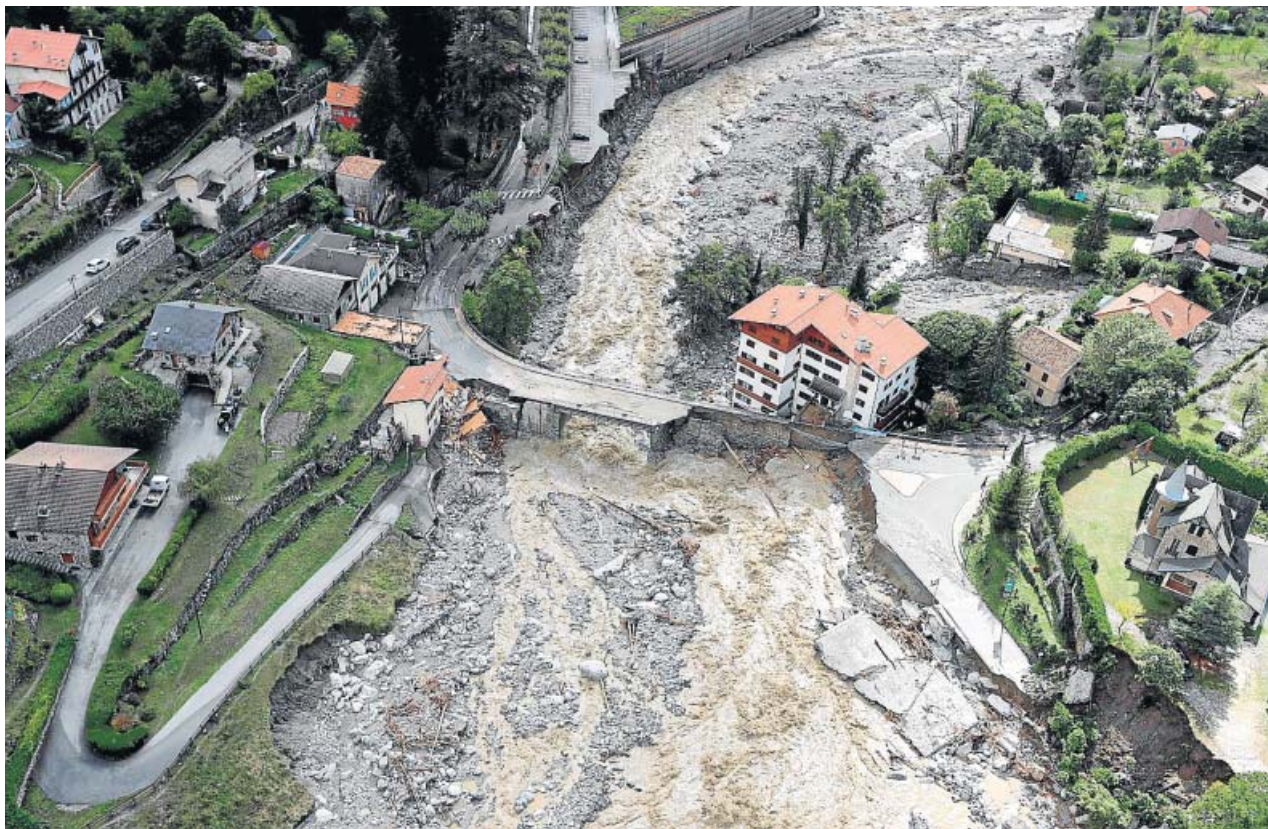
Saint-Martin-Vésubie (Niza, Francia) ha registrado inundaciones en las que han desaparecido varias personas.