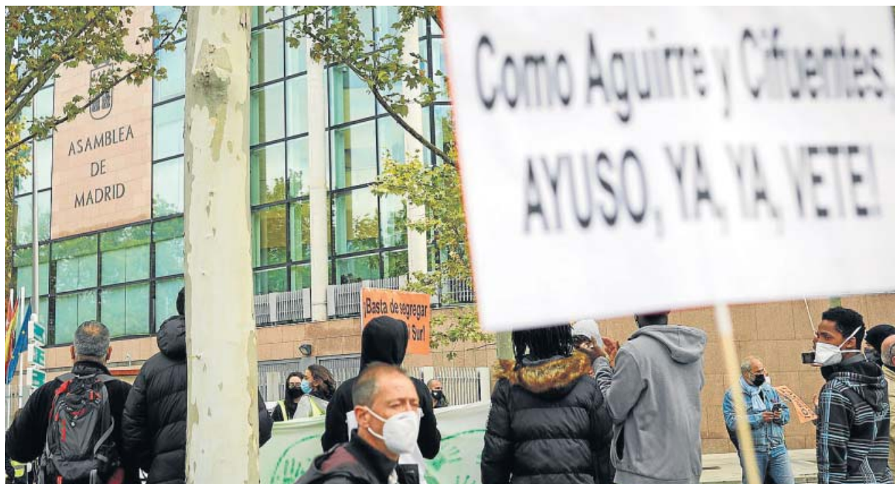
Manifestantes durante la concentración en defensa de la Sanidad pública frente a la Asamblea de Madrid.