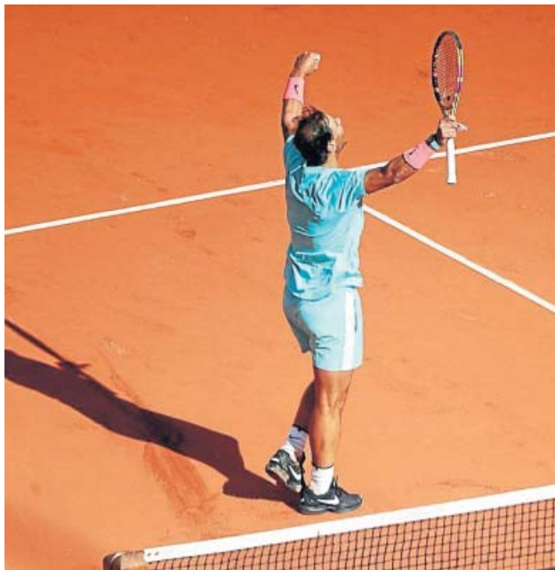
Nadal celebra la victoria en octavos del Garros ante Korda.

El balear arrasó al estadounidense Korda en dos horas, en un partido con mucho viento y frío en Roland Garros