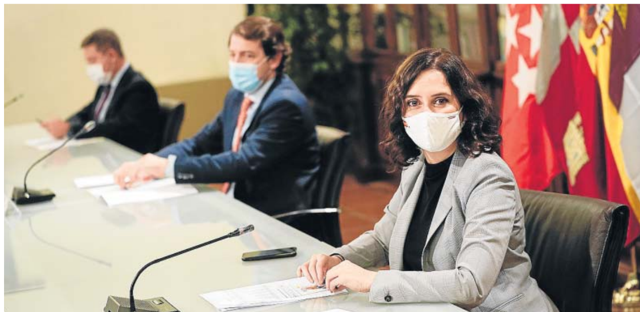
García-Page, Fernández Mañueco y Díaz Ayuso, ayer, al inicio de la reunión que mantuvieron en Ávila.

Para poder materializar su estrategia, Díaz Ayuso remitió