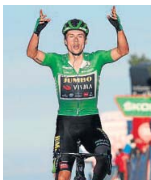
Roglic entra victorioso en la línea de meta.

Volvió Roglic, aunque no se había ido a pesar del despiste de Formigal con su chubas-