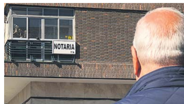
Un hombre observa una notaría de Madrid. JORGE PARÍS

Al respecto, agregan, que aunque no es necesaria la presencia del abogado en esta par-