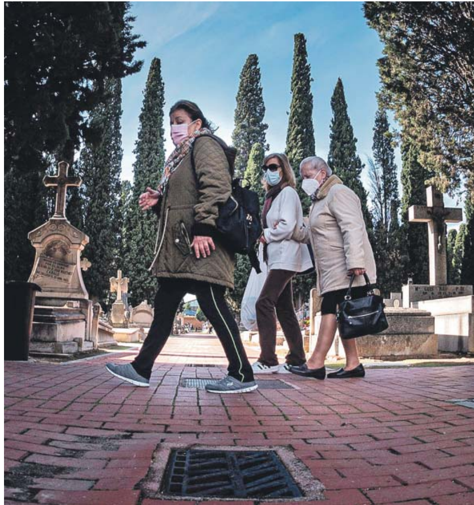
Los habitantes de una zona sanitaria restringida solo podrán ir al cementerio para un entierro.

Durante los días 31 de octubre y 1 y 2 de noviembre, además, la Unidad de Apoyo a la Seguridad (UAS) de la Policía Municipal desplegará efectivos tanto en el cementerio de La Almudena como en Carabanchel en previsión de posibles alteraciones de la normal convivencia. Además, la Sección de Apoyo Aéreo operará con drones para controlar ambos cementerios y la supervisión aérea del número de personas. La empresa funeraria municipal, asimismo, reforzará la seguridad privada en La Almudena y Carabanchel con una decena de efectivos y también en el resto de