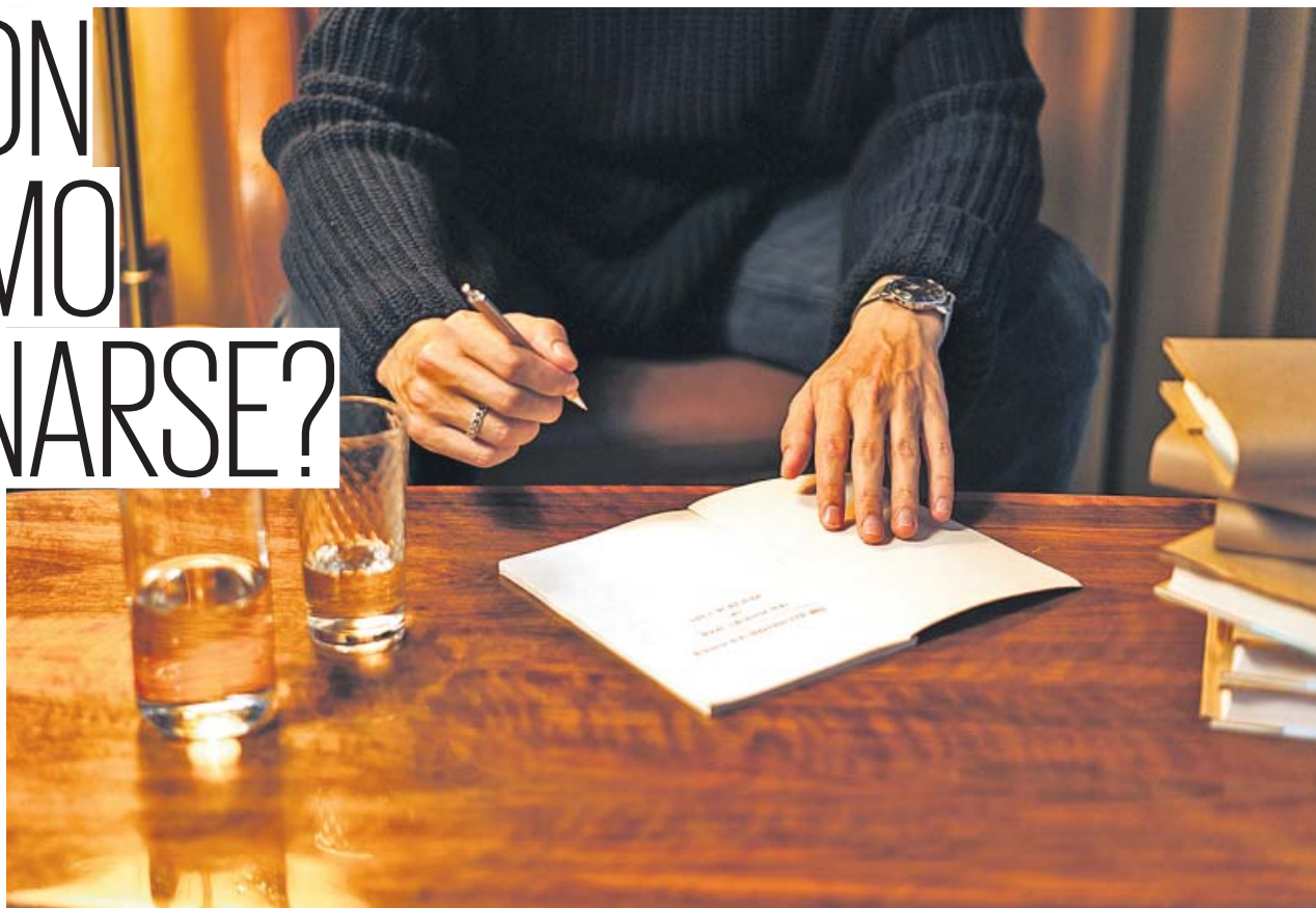
Una herencia 'envenenada' puede suponer pasar a asumir enormes deudas.

Aceptar una herencia supone adquirir los bienes de un ser querido. Pero, ojo, sus deudas también, lo que tiene riesgos