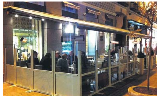
Una terraza protege del frío a sus clientes.

Según informan las fuentes municipales, estos elementos «deberán garantizar la permeabilidad de vistas, sin que supongan un obstáculo a la percepción de la ciudad». Podrán ser de jardinería, admitiéndose maceteros o jardineras, que podrán combinarse con elementos ensamblados de estructura metálica o de madera, lateral o con toldo, con pies autoportantes y paramentos de vidrio, u otros