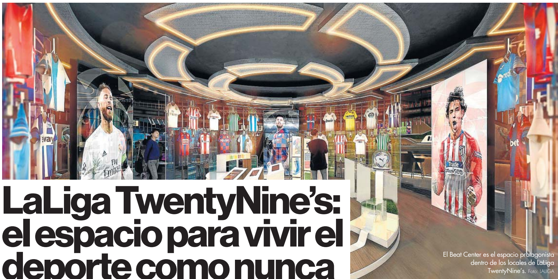
El Beat Center es el espacio protagonista dentro de los locales de LaLiga TwentyNine's.