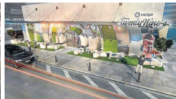
De izquierda a derecha: la grada multifunción, el área gastronómica y la fachada de los espacios LaLiga TwentyNine's.