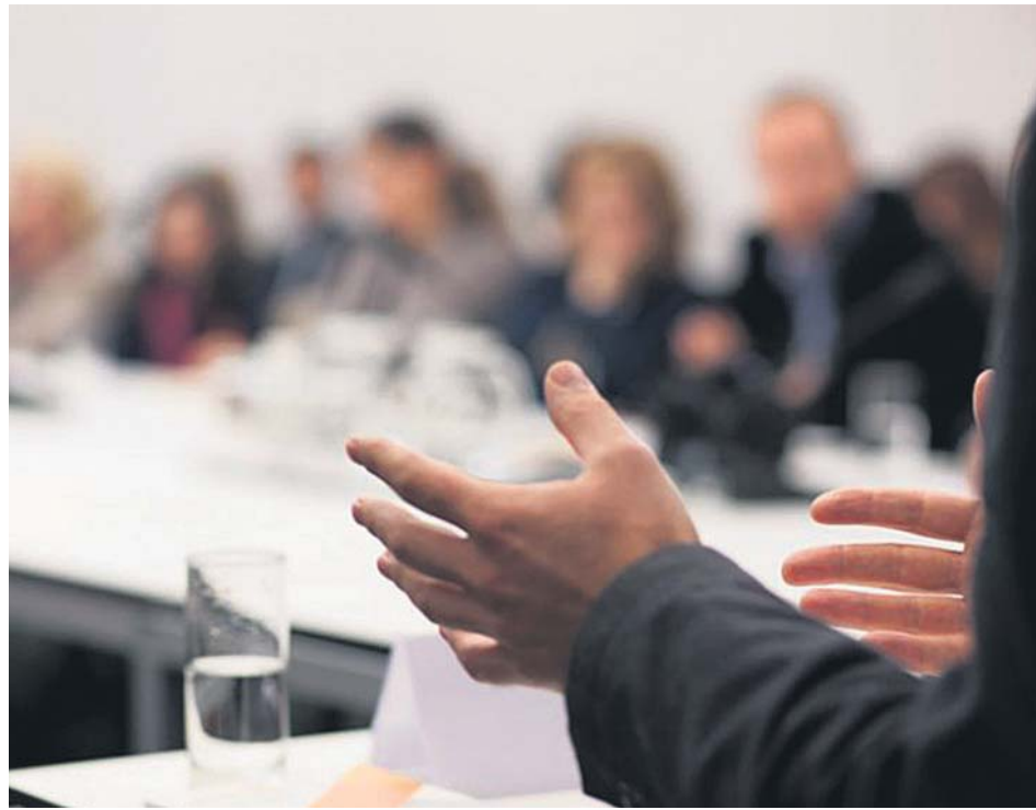
Una junta de propietarios antes de la pandemia de coronavirus.

En la Comunidad de Madrid existen más de 200.000 comunidades de propietarios de las cuales un 80% son gestionadas por los Administradores de Fincas colegiados. Durante el primer estado de alarma no se han celebrado