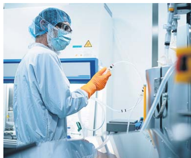
Un técnico en un laboratorio de BioNTech.

El plan de la Comisión es que las vacunas se repartan simultáneamente a los estados