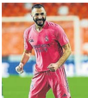
Benzema, durante el partido del domingo.

solitario en la ciudad deportiva del Real Madrid. También lo hizo en un martes de descanso tras conocer el resultado de las pruebas médicas a las que se sometió, que confirmaron que la dolencia que le impidió acabar el partido ante el Valencia era una simple sobrecarga. La distan-