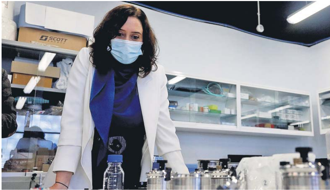
Díaz Ayuso, ayer, durante la visita de los miembros del Gobierno al Instituto Madrileño de Nanociencia.

La presidenta madrileña recuperó ayer su agenda tras pasar dos días en cuarentena por haber sido contacto estrecho de un positivo de Covid-19. Isabel Díaz Ayuso presidió el Consejo de Gobierno, que ayer se trasladó desde la Real Casa de Correos a la sede del Instituto Madrileño de Nanociencia para sumarse a la celebración de la Semana de la Ciencia. «Tengo anticuerpos. Estoy vacunada porque, como todo el mundo sabe, ya lo pasé en su momento», defendió la presidenta. ●