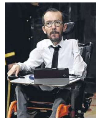
Pablo Echenique en el Congreso.