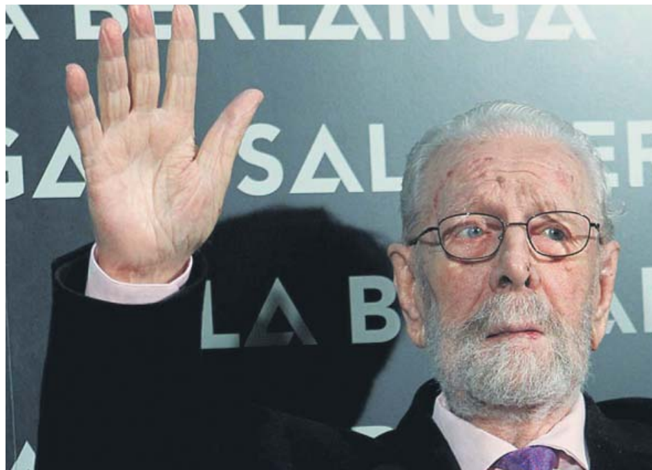
El director de cine valenciano Luis García Berlanga (1921-2010).