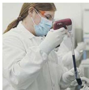
Una científica en un laboratorio de Moderna.

Moderna trabajará con el Comité para los Productos Médicos y para Uso Humano