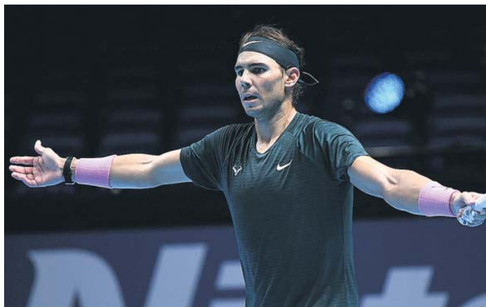
Nadal protesta una jugada durante el partido de ayer ante Thiem.

De esta forma, Thiem, que ya había eliminado este año a Nadal en cuartos de final del Abierto de Australia, se confirmó como verdugo del balear, que pagó caro las buenas oportu-