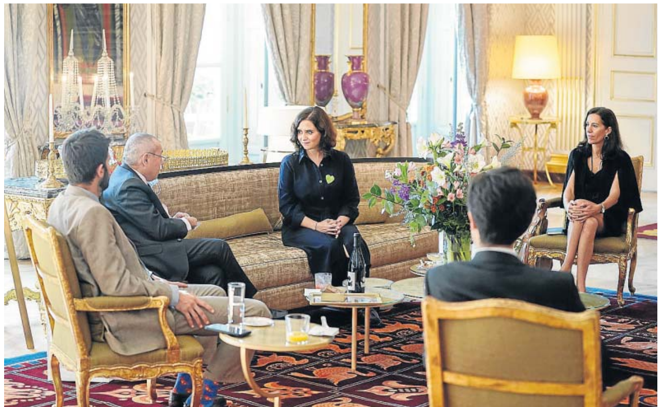
La presidenta Isabel Díaz Ayuso, ayer, con el diplomático francés Jean-Michel Casa en la embajada gala.