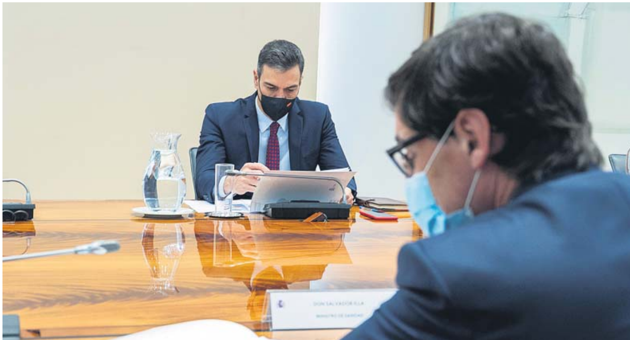
El presidente, Pedro Sánchez, y el ministro de Sanidad, Salvador Illa, el lunes en una reunión de seguimiento de la Covid.