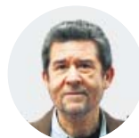
Por Carlos Santos Periodista

N o, a mí tampoco me caen simpáticos los de Bildu. Ni los de Bildu ni ningún otro de los que cogían las nueces del árbol que sacudía ETA y que, dicho sea de paso, no eran solo los abertzales y sus primos nacionalistas. También en Madrid tuvo el terrorismo beneficiarios, antepasados de quienes, diez años después, quieren seguir sacándole beneficios y se rasgan las vestiduras porque otros hacen lo mismo que ellos harían para lograr el poder o mantenerlo: pactar con el diablo antisistema.