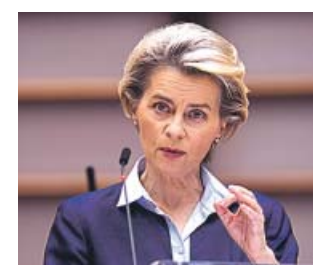
Ursula von der Leyen.

Al mismo tiempo, dio por hecho que la Agencia Europea del Medicamento autorizará el lunes la vacuna de Pfizer y que los países podrán empezar a vacu-