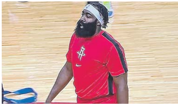
James Harden Quiere un traspaso. Ayer apareció pasado de peso