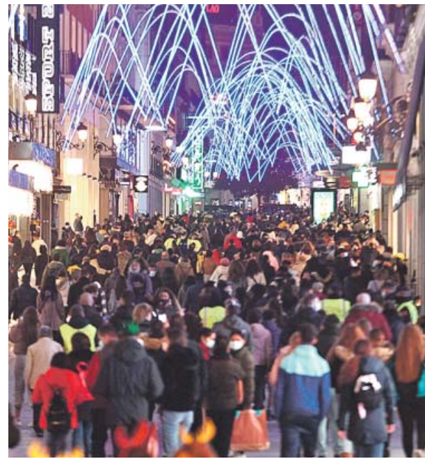
Las autonomías podrían restringir movilidad y reuniones. J.P.

MÁS RESTRICCIONES «SÍ O SÍ». La Generalitat se plantea echar el freno en la desescalada de actividad ante la evo-