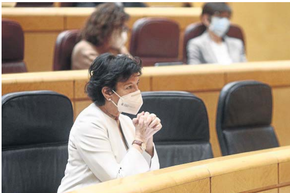
La ministra de Educación, Isabel Celaá, durante la sesión plenaria del Senado.

ADVERTENCIA Celaá, abierta al diálogo con la concertada, avisa de que las normas «están para cumplirlas»