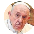
FRANCISCO Papa de la Iglesia católica

«La Navidad puede quitar de nuestros corazones y nuestras mentes el pesimismo que ha difundido la pandemia»