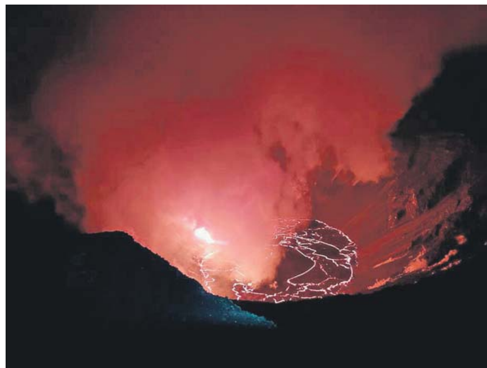
El cráter del Kilauea presenta varias grietas tras entrar en erupción el pasado domingo.

En ese momento, según las mismas fuentes, uno de los agentes le metió la mano por la camiseta tocándole los pechos por dentro del sujetador. Luego, le bajó los pantalones para manosearle las nalgas y la vagina; mientras el otro agente mi-