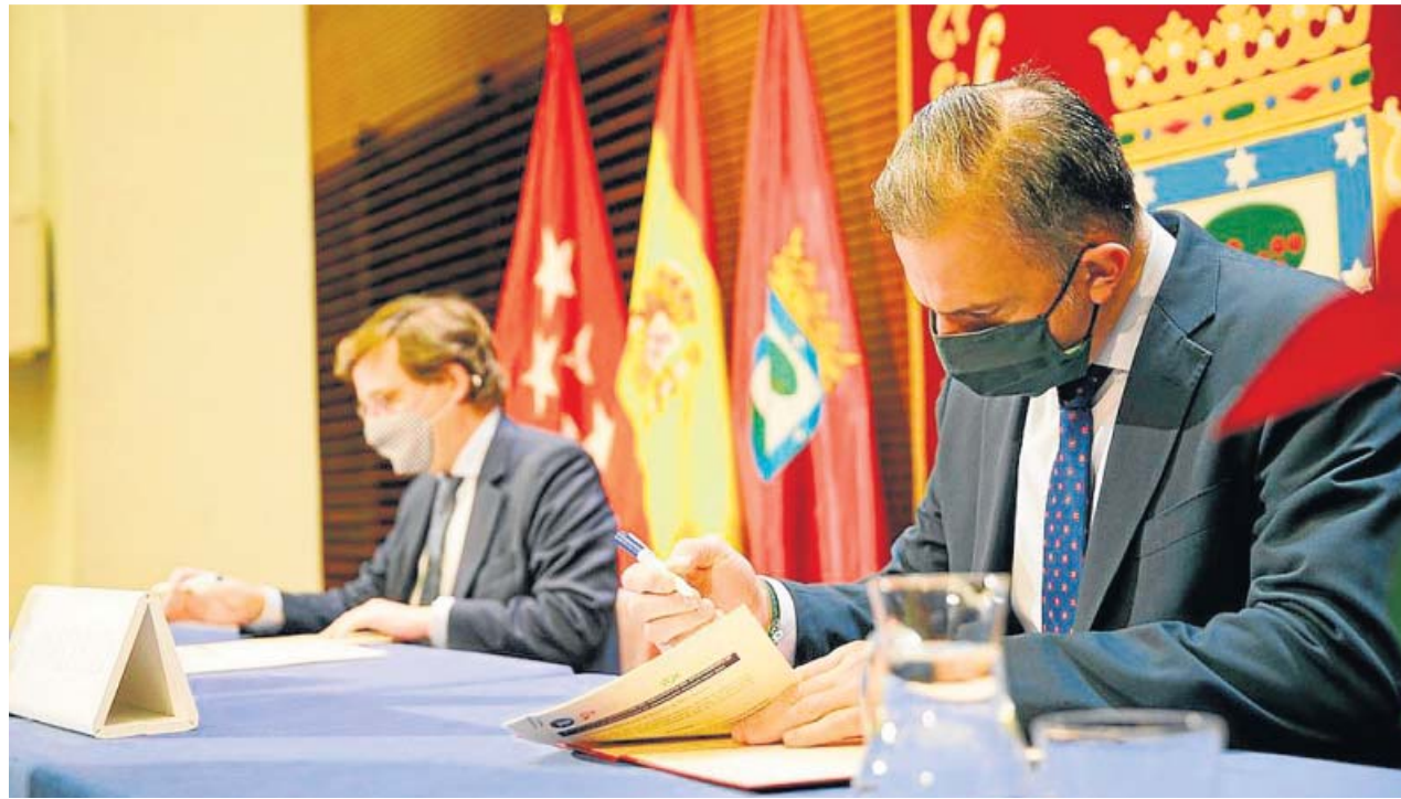
El alcalde y el portavoz municipal de Vox firmaron ayer el acuerdo de presupuestos.

«Garantizo la aprobación de estos presupuestos dado el acuerdo al que ha llegado el equipo de gobierno (Cs y PP) con Vox», señaló a los medios el primer edil a las puertas del Pleno, orgulloso por el acuerdo alcanzado. Y es que, según Almeida, estos son los presupuestos con los que se podrá afrontar un año tan difícil como va a ser 2021 y que tienen como objetivo la creación de empleo: «Hay más de 250.000 personas en paro y hacia ellos se dirige la aspiración de este equipo de gobierno». Además, recordó que con estas cuentas «se aumenta la in-