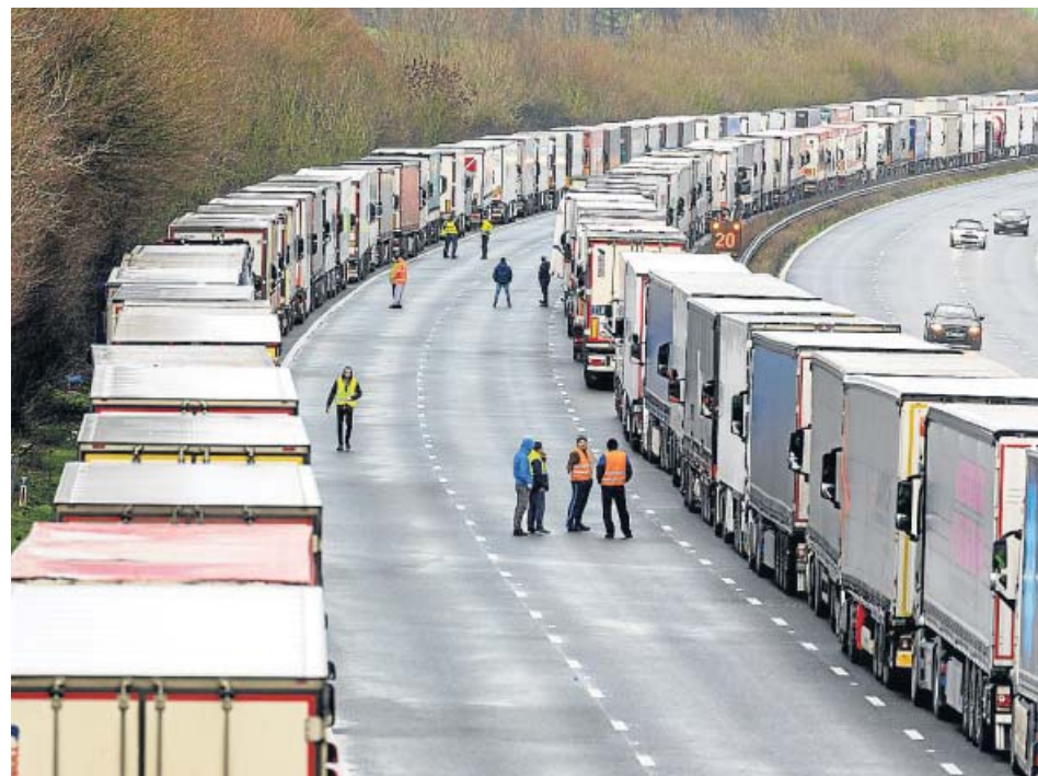
Filas de camiones aparcados en una autopista del condado de Kent.

La tensión estalló después de media semana aguantando el tipo en muy malas condiciones. Algunos de los camioneros están pasando los días en un aeropuerto convertido en una espe-