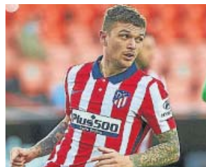
Kieran Trippier en un partido con el Atlético.

El futbolista del Atlético de Madrid Kieran Trippier fue suspendido ayer con diez semanas sin poder participar en actividades relacionadas con el fútbol, como jugar e incluso entrenar con su equipo, por incumplir las reglas de apuestas establecidas por la federación inglesa de fútbol (FA). El lateral derecho inglés ha si-