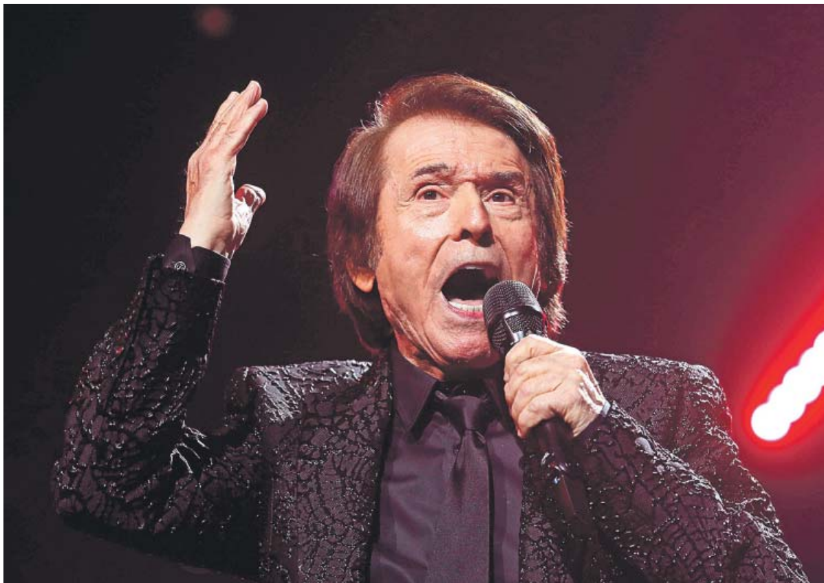
Raphael, el pasado sábado en el WiZink de Madrid durante el concierto para celebrar sus 60 años de carrera.