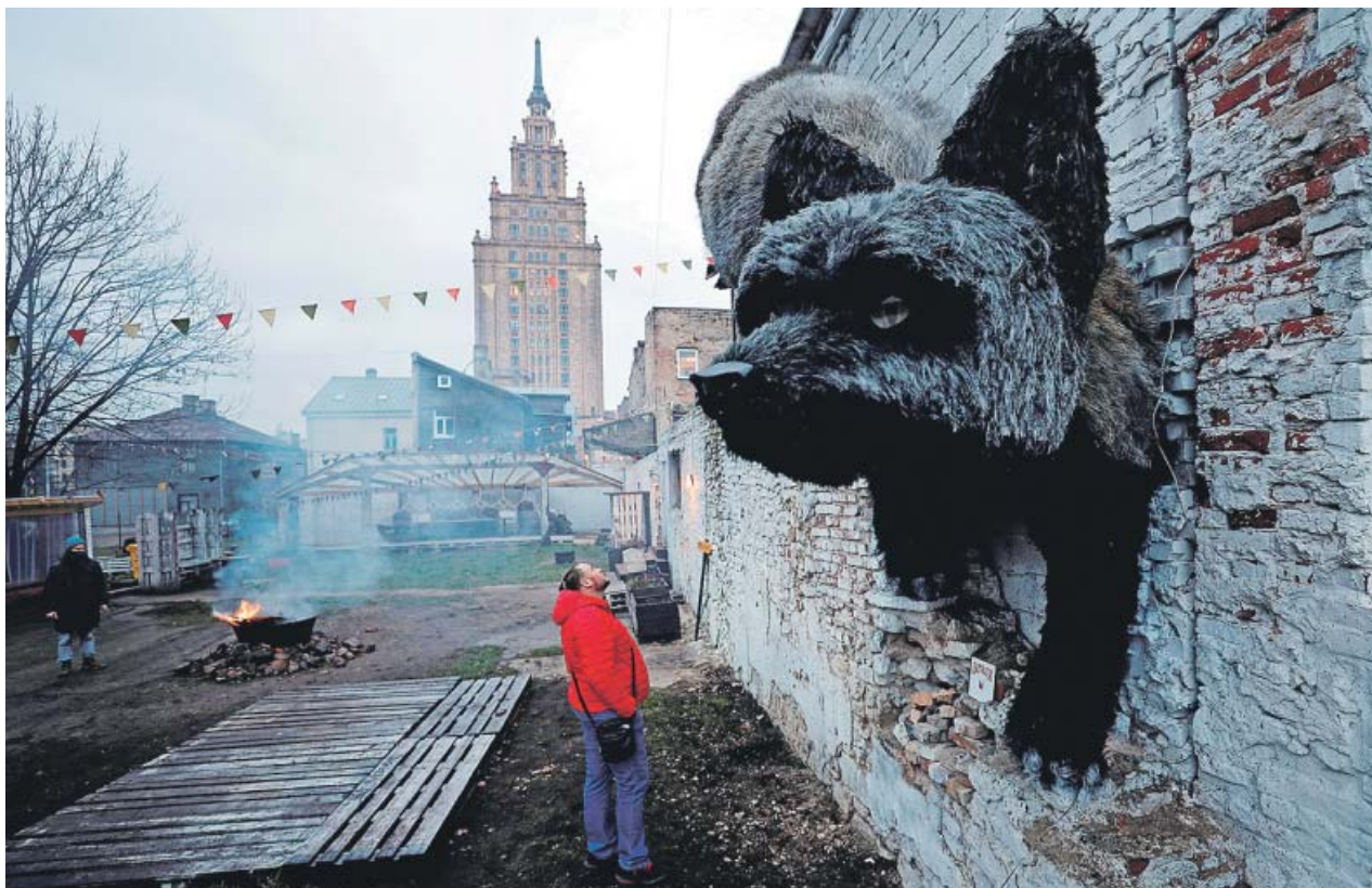
Escultura Nacido para la libertad , del artista Alexander Marinoha, sobre un muro de un barrio de Riga.

●●● Los sindicatos CC OO y UGT han pedido al Gobierno que se reponga la cláusula de salvaguarda, herramienta incluida en la reforma de pensiones de 2011 que garantizaba el mantenimiento de las condiciones de jubilación previas a la reforma para quienes volvían a encontrar trabajo, antes de que acabe el año. Señalan que de esta forma se garantizaba «que ninguna persona viera disminuida su expectativa de pensión» tras su despido.