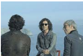
MÚSICA Un país para escucharlo LA 2. 22.55 H

Destinado a ampliar conocimientos entre los ciudadanos sobre materias dispares como cultura, ciencia, tecnología o medio ambiente, combina la emisión de reportajes con entrevistas y tertulias en plató.