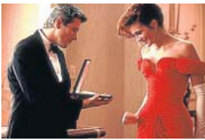
'Pretty Woman' TELECINCO. 23.00 H

Edward, un apuesto y rico hombre de negocios, contrata a una prostituta, Vivian, durante un viaje a Los Ángeles. Tras pasar con ella la primera noche, le ofrece pasar juntos toda la semana y que le acompañe a diversos actos sociales.