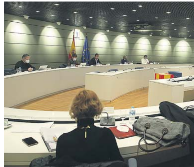
Reunión del ministerio, sindicatos y patronal, el viernes.