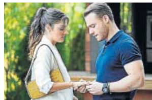
Love is in the air TELECINCO. 22.00 H

Un grupo de científicos forenses que trabaja en un laboratorio de criminalística de Las Vegas (Nevada, Estados Unidos) tiene que resolver los crímenes que van sucediendo en la ciudad, a cada cual más extraño.