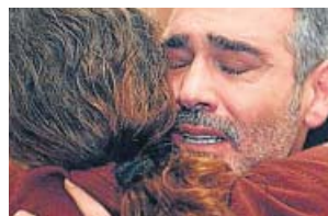
Mujer ANTENA 3. 22.45 H