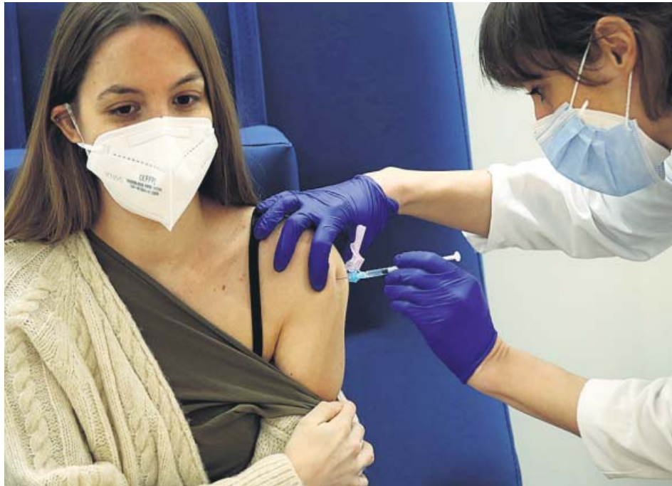
El Hospital Clínic de Barcelona continuó ayer vacunando a sus sanitarios.

De este modo, el Gobierno asegurará, pese al temporal, la llegada a España y la posterior distribución a las comunidades de la nueva remesa de más de 300.000 vacunas de la farmacéutica Pfizer. El objetivo es que el temporal de nieve no afecte a las