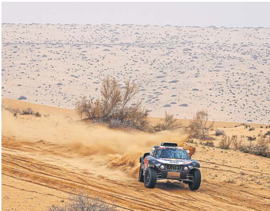
Carlos Sainz y su copiloto, Lucas Cruz, durante la maratón de la séptima etapa.

EL MADRILEÑO es tercero en coches mientras Barreda minimiza daños en motos LOS CORREDORES completan hoy la etapa sin ningún tipo de asistencia, salvo entre ellos