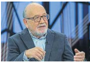
DIVULGATIVO La aventura del saber LA 2. 09.55 H

Destinado a ampliar conocimientos entre los ciudadanos sobre materias dispares como cultura, ciencia, tecnología o medio ambiente, combina la emisión de reportajes con entrevistas y tertulias en plató.