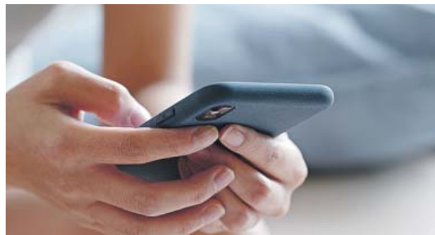
En los próximos cinco años aumentará la inversión en 5G.

officer de Nokia España. «Para aprovechar las grandes oportunidades del 5G, las organizaciones deben comenzar o intensificar su planificación ahora», añade el experto.