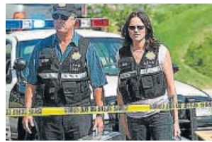
CSI Las Vegas ENERGY. 09.00 H

Un grupo de científicos forenses que trabaja en un laboratorio de criminalística de Las Vegas (Nevada, Estados Unidos) tiene que resolver los crímenes que van sucediendo en la ciudad, a cada cual más extraño.