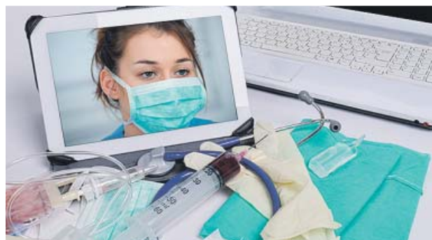
El internet de las cosas crecerá en áreas como la sanitaria.