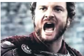
'La última legión' LA 1. 22.10 H

Un antiguo agente de la CIA es secuestrado por un grupo terrorista. Cuando su hijo se da cuenta de que no hay ningún plan para sacar a su padre de ahí con vida, decide llevar a cabo una operación de rescate por su cuenta.