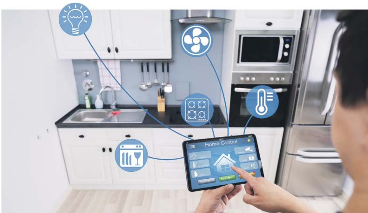
Este año los dispositivos inteligentes estarán más presentes en nuestros hogares y el control por voz será tendencia.