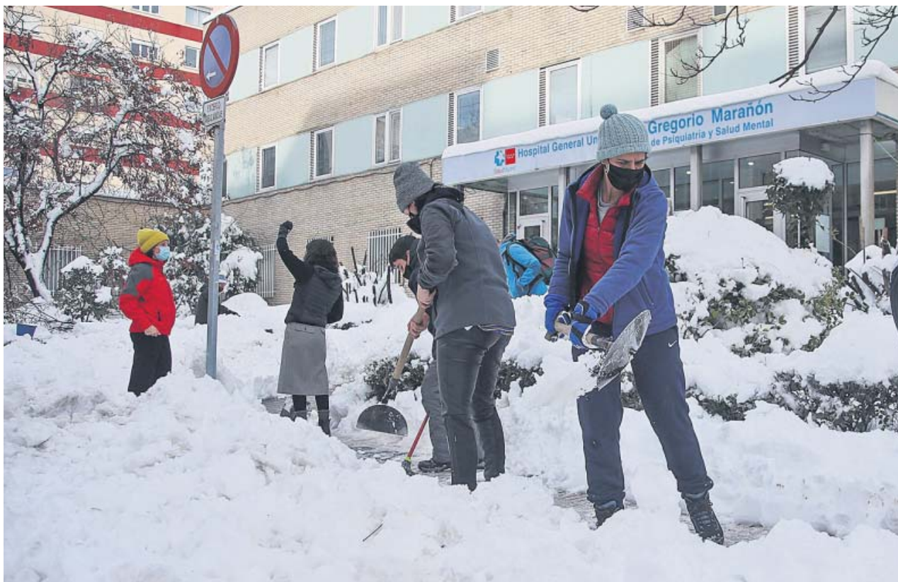
Ciudadanos voluntarios retirando nieve de la entrada del hospital Gregorio Marañón de Madrid.