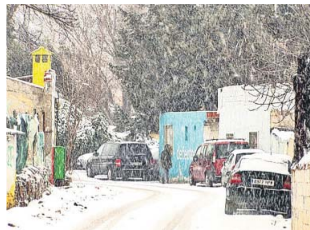
La Cañada Real, bajo la nieve este fin de semana.

También se pronunciaron sobre la situación la vicepresidencia segunda del Gobierno, que