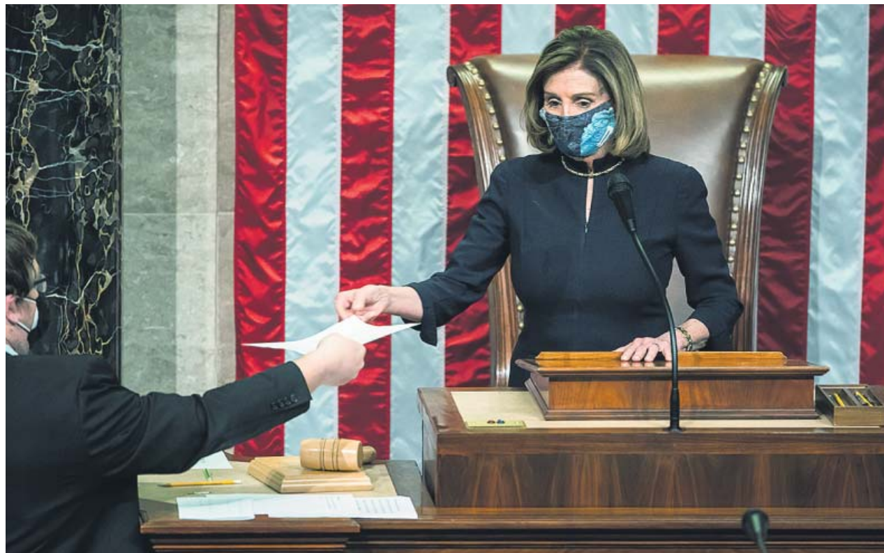
La demócrata Nancy Pelosi preside el debate de ayer en la Cámara de Representantes.

«Sabemos que el presidente de Estados Unidos incitó esta insurrección, esta rebelión armada contra nuestro país común. Debe irse. Es un peligro claro y presente para la nación que todos amamos», sostuvo Nancy Pelosi, la pre-