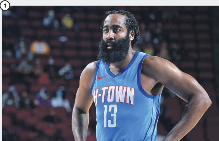
1 James Harden, traspasado a los Nets de Durant

Cuatro partidos sin alcanzar los 20 puntos dejaban claro que ni está en forma ni motivado. Arrasados dos veces por los Lakers, un Harden visiblemente pasado de peso volvió a pedir el traspaso con unas incendiarias declaraciones. Los Rockets, viendo la situación, cedieron y le traspasaron a los Brooklyn Nets, donde formará un Big Three que da miedo con Kevin Durant y Kyrie Irving.