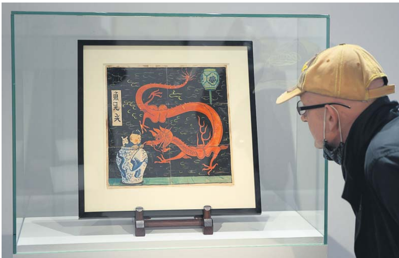
Un visitante contempla la portada del cómic de Tintín en la casa de subastas Artcurial de París.