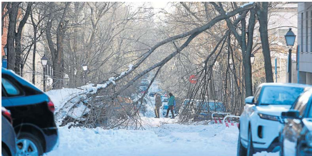
Las ramas de los árboles colapsan la circulación. Un hombre cruza un caótico Arturo Soria (izq.), mientras un coche queda atrapado entre la nieve y los árboles en avenida 25 de septiembre (dcha.). Otra pareja pasea por Castelló (abajo).