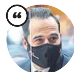
IGNACIO AGUADO Vicepresidente de la Comunidad de Madrid

«Si el ministro Marlaska tiene dudas que se suba en su 4x4 y lo vea: parece que ha caído una bomba de nieve»