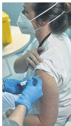
Madrid sigue vacunando y espera dosis de Moderna.

«Estamos aproximadamente por encima de los 600 casos y la tendencia es que siga aumentando», señaló el consejero en una entrevista. Ruiz Escudero no dio pistas sobre