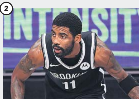
2 El extraño caso de Kyrie Irving

Cuatro partidos sin alcanzar los 20 puntos dejaban claro que ni está en forma ni motivado. Arrasados dos veces por los Lakers, un Harden visiblemente pasado de peso volvió a pedir el traspaso con unas incendiarias declaraciones. Los Rockets, viendo la situación, cedieron y le traspasaron a los Brooklyn Nets, donde formará un Big Three que da miedo con Kevin Durant y Kyrie Irving.