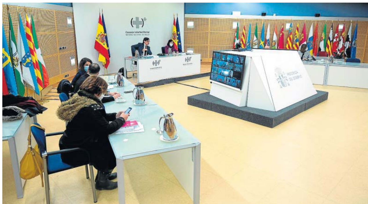
Los ministros de Sanidad y de Política Territorial, Salvador Illa y Carolina Darias, presidiendo ayer el Consejo Interterritorial.

GALICIA , Andalucía, Extremadura, Murcia y Navarra endurecen las restricciones de movimiento y reunión. SANIDAD rechaza el confinamiento duro que reclaman los expertos y apuesta por actuar como en la segunda ola