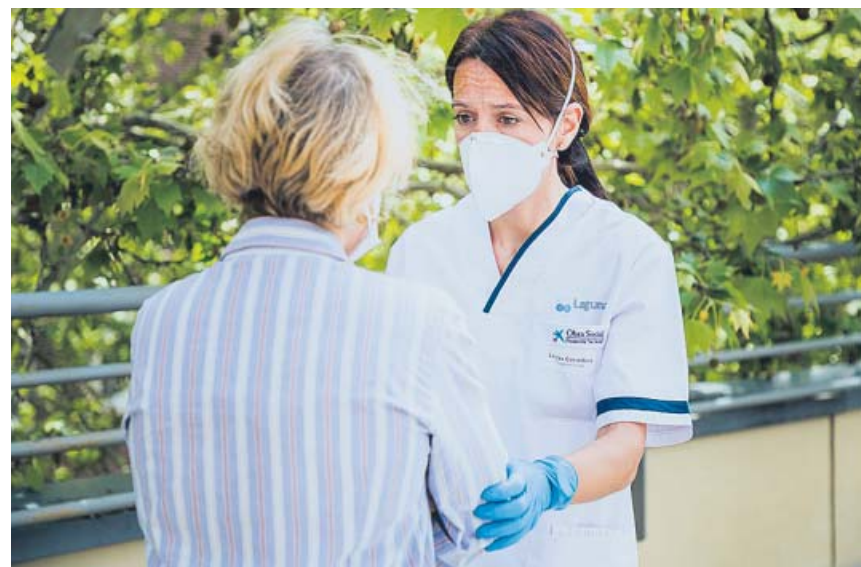
Una psicóloga atiende a un familiar en su proceso de duelo.

Las tres asociaciones explican que algunos autónomos no lo hicieron porque decidieron aguantar con sus ahorros o porque se encontraban de baja. Ellos ahora no pueden acceder a la prestación y es uno de los puntos que las asociaciones de autónomos pedirán que se elimine en la reunión con Seguridad Social. ● CLARA PINAR