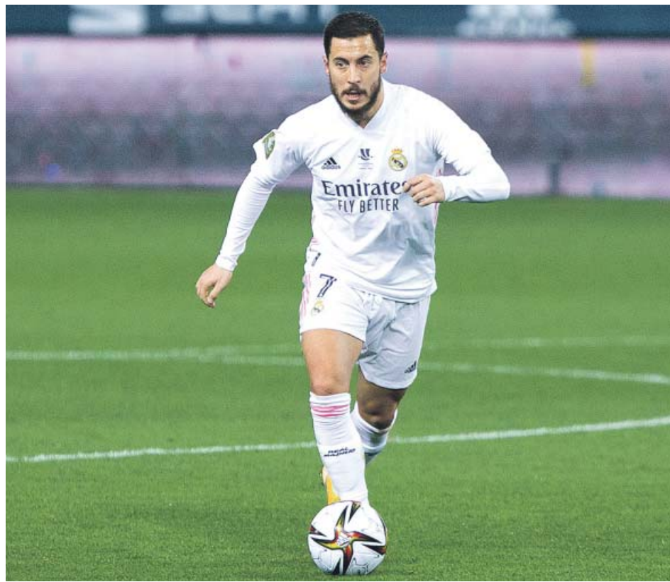
Eden Hazard en el partido ante el Athletic de la Supercopa.

Quince partidos se ha perdido Hazard por lesión esta campaña (uno de ellos por haber cogido la Covid), más de la mitad de los 26 que ha disputado el equipo blanco. Y en el resto, diez (ante el Granada no jugó por salir de una lesión pesada a que estaba convocado), apenas ha metido dos tantos y no ha dado ni una sola asis-