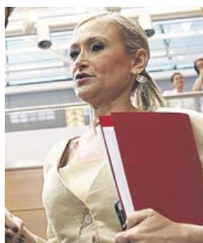
Cristina Cifuentes, en una imagen de archivo.