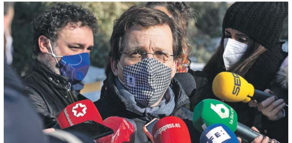
Almeida se ha convertido en uno de los políticos más relevantes del país. ENRIQUE CIDONCHA

Les pido a los jóvenes de Madrid que sigan manteniendo, como han hecho la inmensa mayoría, un ejemplar comportamiento, y que esa minoría no puede ni manchar su nombre ni seguir actuando como lo está haciendo, porque cuando a uno le toca asumir responsabilidades aunque sea prematuro, las asume. ●