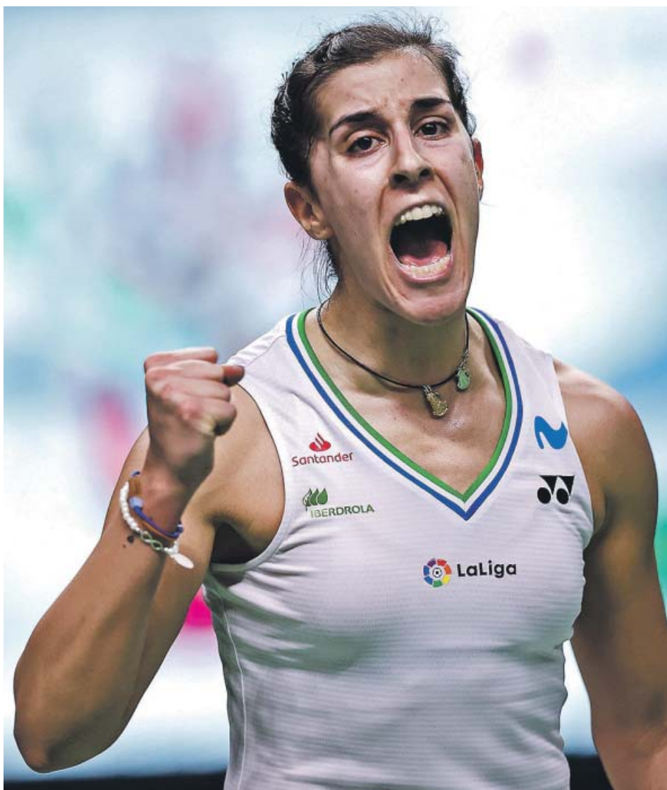
Carolina Marín celebra un punto ante la taiwanesa Tai Tzu-ying.