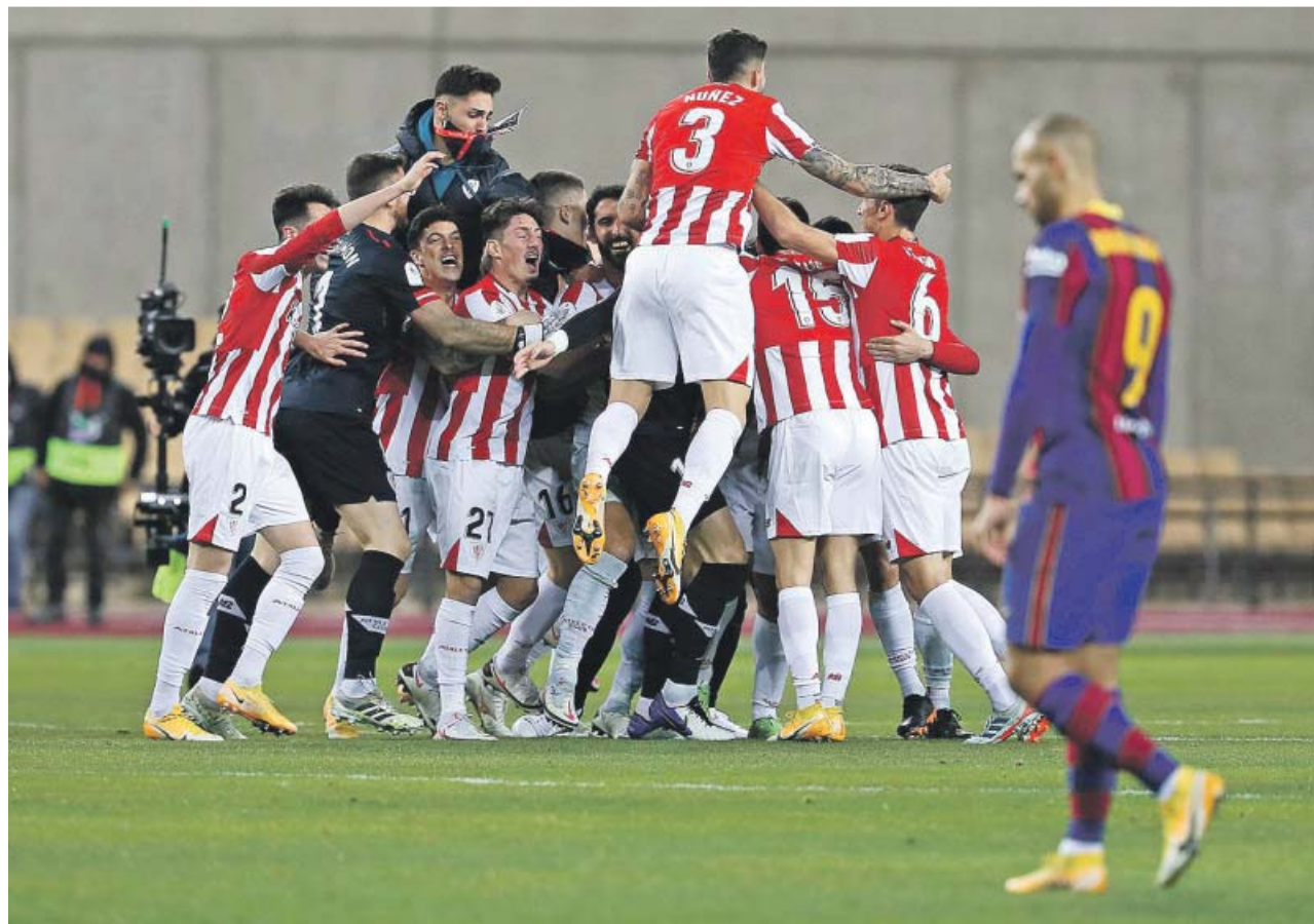
Los jugadores de Athletic celebran su victoria ante la decepción azulgrana.

La respuesta fue contundente, y de nuevo con Jordi Alba de protagonista, una pesadilla ayer con sus internadas por la derecha. Sin Dest, Koeman