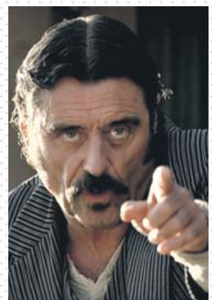
Ian McShane interpreta al villano Al Swearngen.

disfrutar de una serie que revivía un género moribundo en TV con miras más cercanas a Sam Peckinpah que a Bonanza y sus siete caballos, no digamos ya a La casa de la pradera : en el villorrio de Dakota del Norte donde tiene lugar la acción, las hermanas Ingalls se hubieran muerto del susto al escuchar los 47 «fucks!» (los primeros de muchos) que suenan durante la primera hora del piloto. Efectivamente, Deadwood ha quedado como