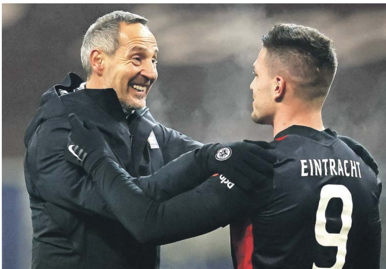
Luka Jovic celebra uno de sus goles con Adi Hütter, entrenador del Eintracht de Frankfurt.

Impresionante el estreno de Luka Jovic en su primer partido con el Eintracht de Frankfurt, el equipo en el que triunfó hasta el punto de que el Real Madrid pagó por él 60 millones de euros. El delantero serbio salió en el minuto 62 del partido ante el Schalke y solo tardó diez minutos en marcar un tanto que entonces ponía el 2-1 en el marcador. Ya en el descuento, en el minuto 91, Jovic hizo el definitivo 3-1 que le daba la victoria a su nuevo equipo. Sin apenas minutos en el Real Madrid, el balcánico quiere demostrar en Alemania que no se le ha olvidado marcar goles. ● R. D.