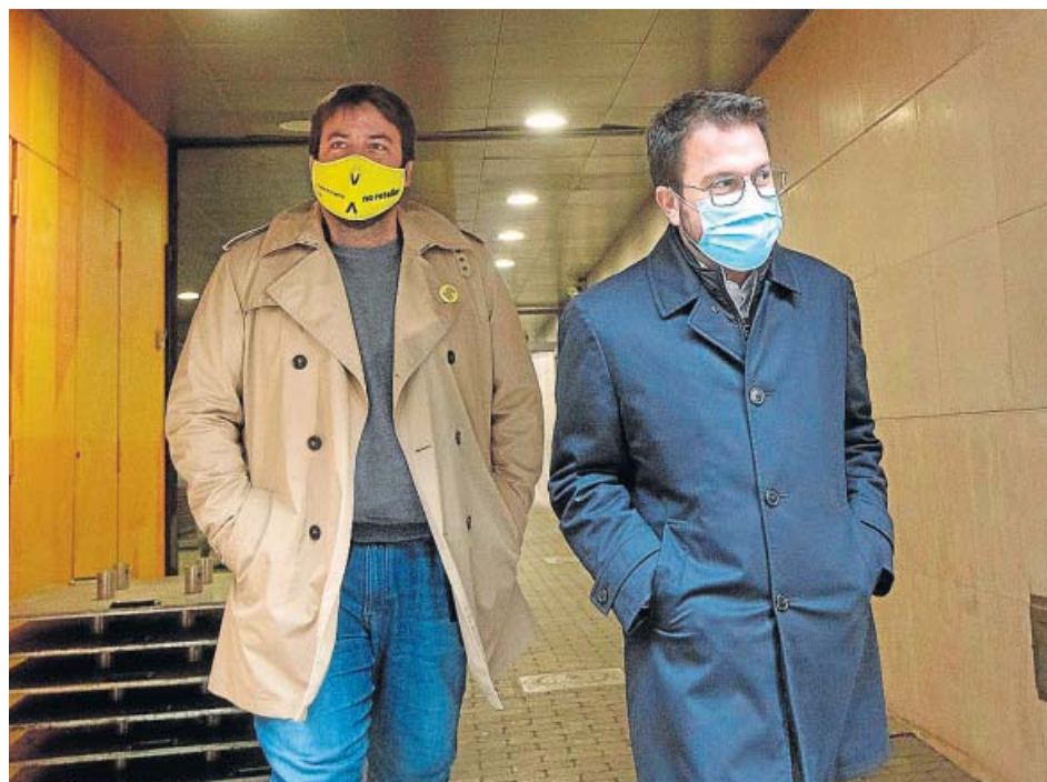
El candidato de ERC, Pere Aragonès (derecha), salía ayer de la sede del partido.

■ Tiene dos vías para gobernar: o un pacto con Junts —la prioritaria—, o un acuerdo para la investidura con En Comú y PSC.