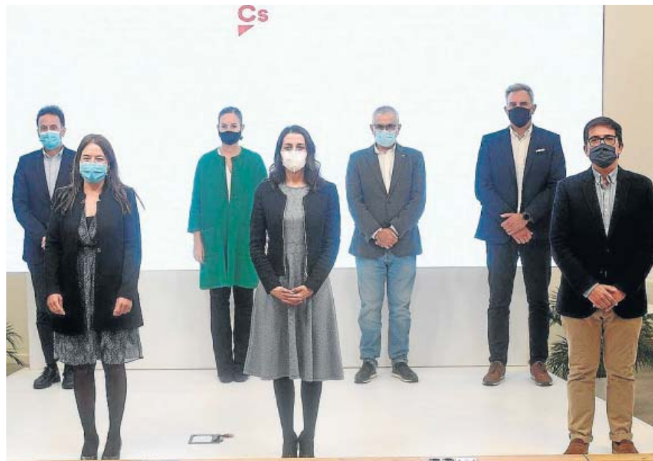
La dirección de Ciudadanos, antes de la reunión urgente del comité permanente.