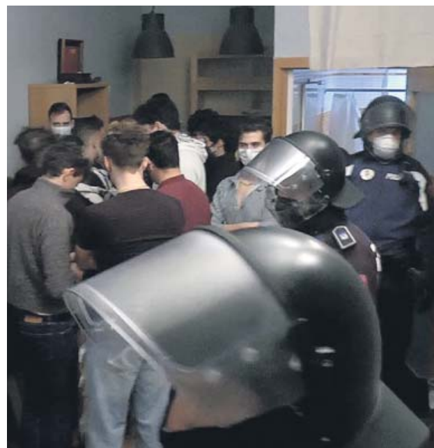
Centro, el distrito con más denuncias

Los agentes intervinieron hace unos días en una fiesta ilegal que se celebraba en un restaurante de Chamberí. La Policía Municipal «no ha hecho más que incrementar el número de agentes para controlar las normas sanitarias», indica un portavoz del cuerpo a este medio.