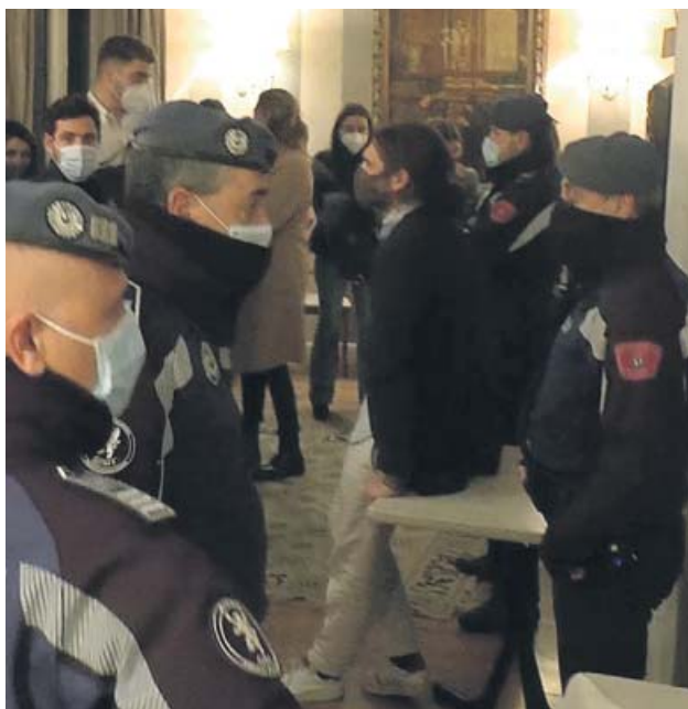
Una fiesta ilegal en un restaurante de Chamberí

Hasta el pasado mes de marzo los agentes locales se valían de su plantilla para estas actuaciones. Sin embargo –a ojos del área municipal–, en un escenario en el que las restricciones se dictan desde el Gobierno central con motivo de la Covid, el trabajo le corresponde, también, a los agentes nacionales.