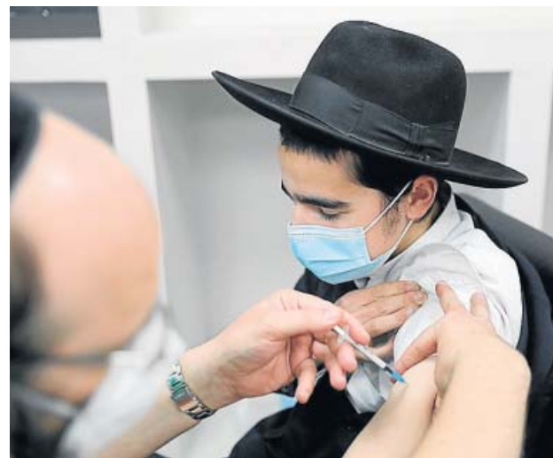
Un judío ortodoxo recibe la vacuna en Bnei Brak.

«Junto a nuestros colegas de la Universidad de Harvard, hemos conducido una serie de test para validar los resultados y, ahora, está inequívocamente claro que la vacuna frente al coronavirus de Pfizer es extremadamente efectiva en la vida real una semana después de la segunda dosis», declaró ayer a medios israelíes el profesor Ran Ba-