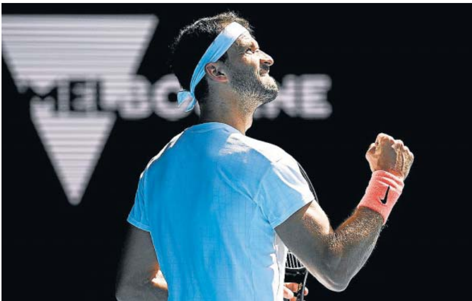
En la foto superior, Djokovic destroza su raqueta; debajo, Karatsev celebra un punto.