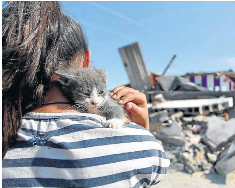
A la izquierda, los vecinos de la Cañada Real reciben comida de una organización benéfica. A la derecha, una niña residente en el poblado chabolista.