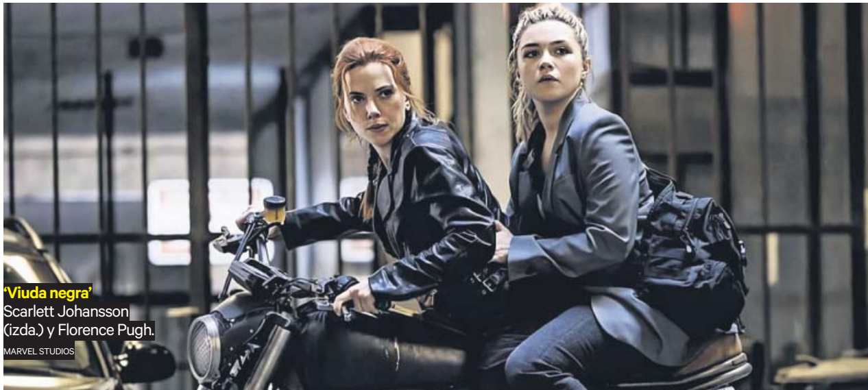
'Viuda negra' Scarlett Johansson (izda.) y Florence Pugh.