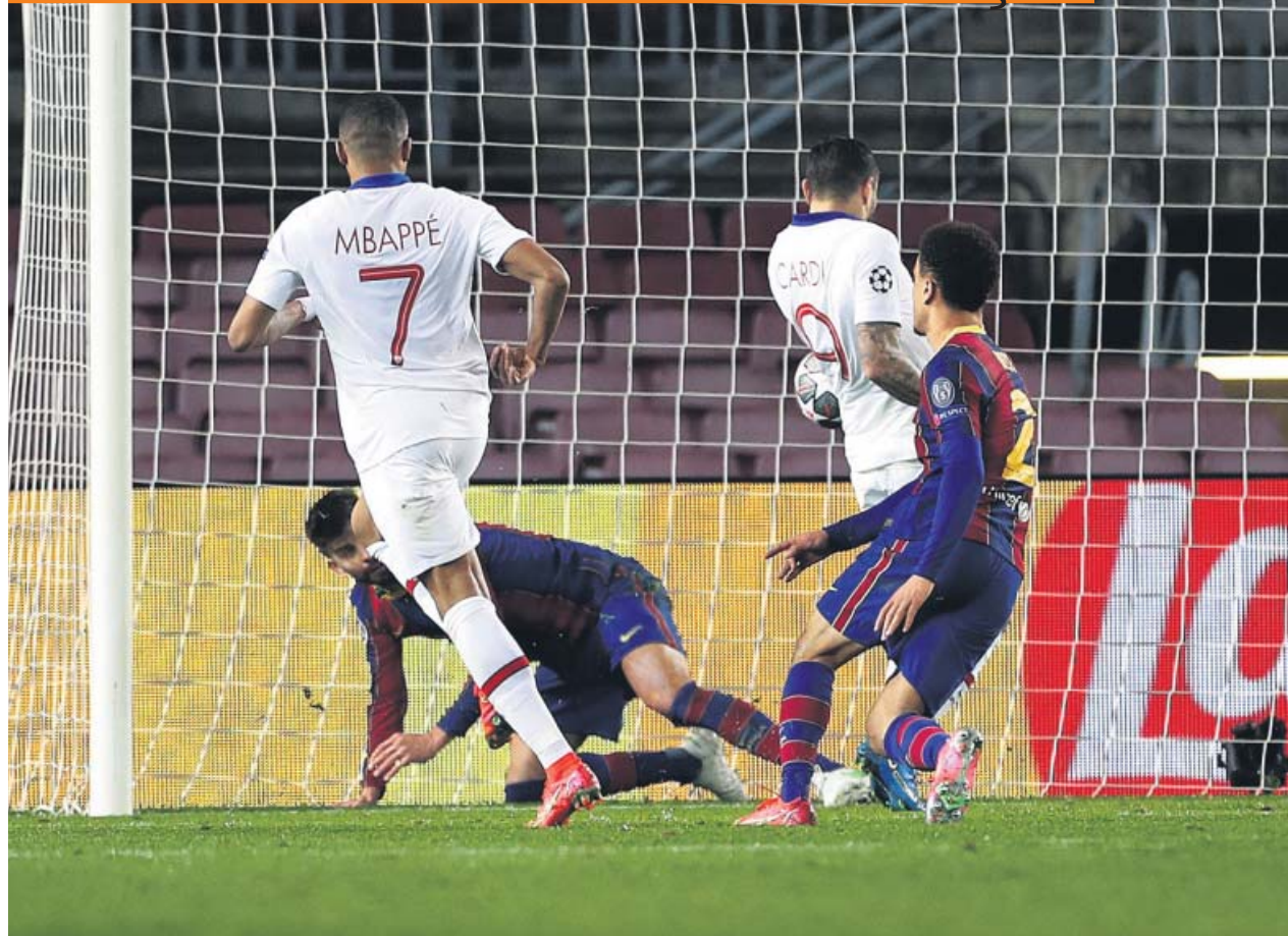
Kylian Mbappé marca su segundo gol al Barça ante la mirada de Gerard Piqué y Dest.

Exhibición del delantero galo, que marcó tres goles que dejan la eliminatoria casi sentenciada. El PSG fue mejor que el Barça y Mbappé aplastó a Messi en su duelo