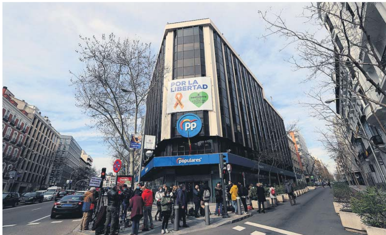
Un grupo de periodistas esperaba, ayer, en la puerta de la sede del Partido Popular en la calle Génova de Madrid.

A la hora de analizar el mal resultado del 14-F, Casado fue muy claro. «No hay nada que celebrar para los que queremos una España y una Cataluña unidas», sostuvo el líder de la oposición, pero culpó a Ferraz y al PSOE de «hundir la participación». No habrá nuevos nombres, dado que Casado respaldó sin dudas a Alejandro Fernández. El enfoque