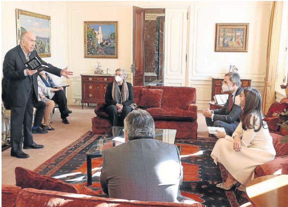
Los Reyes, el pasado diciembre, en la visita privada a Barcelona para la entrega del galardón.