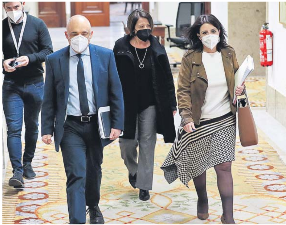
La portavoz del grupo socialista en el Congreso, Adriana Lastra (dcha.), junto a Rafael Simancas.

QUEJAS Podemos denuncia que el texto no cambia la ley de extranjería, algo que consideran clave LOS SOCIALISTAS responden a Podemos poniendo en duda su apoyo a una iniciativa sobre la ley de aborto