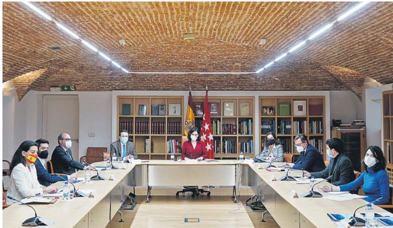
La reunión sobre los fondos europeos se celebró ayer en Sol con la presencia de todos los portavoces de la Asamblea.

Aunque Díaz Ayuso desgranará hoy las inversiones concretas en un acto público en la Puerta del Sol al que asistirán