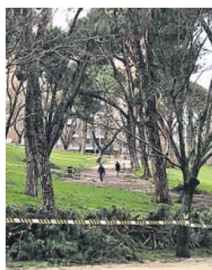
Árboles caídos en el parque del Oeste.

Por una parte, están los daños en las aceras, pavimentos o arbolados cuya reparación o restitución costará a las arcas mu-