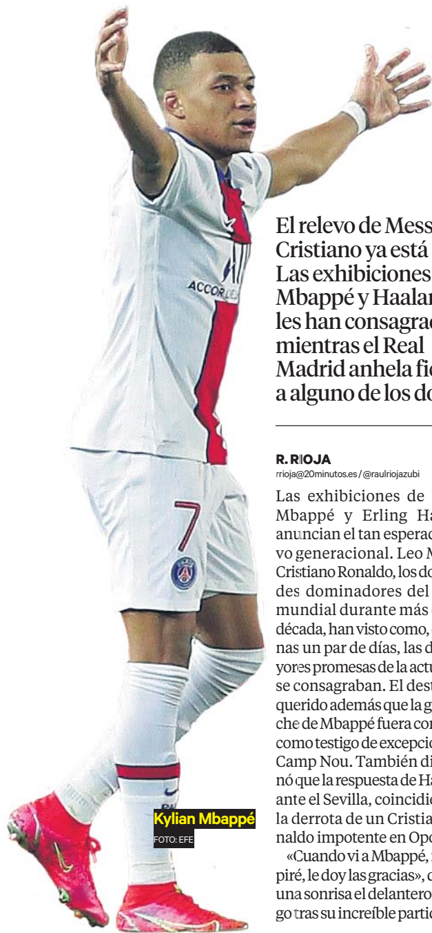
Kylian Mbappé

El relevo de Messi y Cristiano ya está aquí. Las exhibiciones de Mbappé y Haaland les han consagrado, mientras el Real Madrid anhela fichar a alguno de los dos