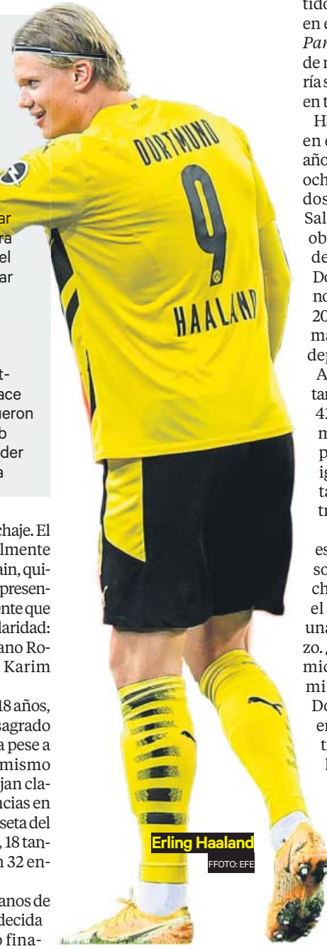
Erling Haaland

La decisión está en manos de Mbappé, será él el que decida su futuro. Su contrato fina-