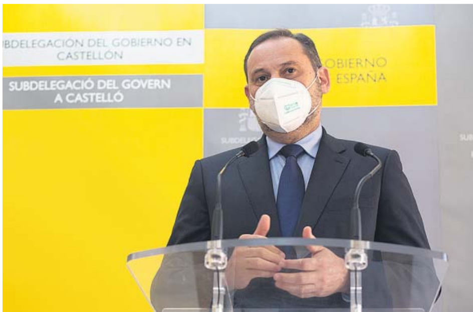
El ministro de Transportes, Movilidad y Agenda Urbana, José Luis Ábalos.

ÁBALOS Su posición sobre los fondos de inversión mantendría el bloqueo al acuerdo. UP acusa al PSOE de no dar alternativas