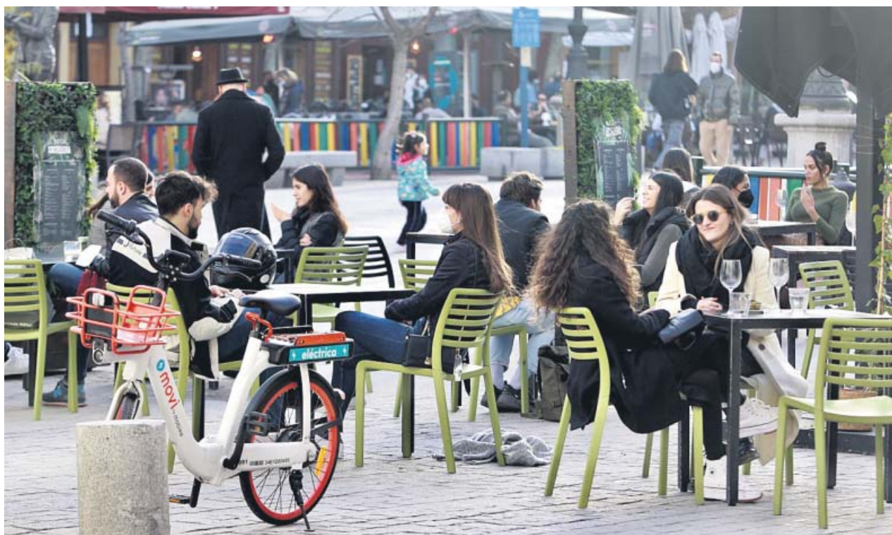
Una terraza del centro de la capital, ayer por la tarde, llena de clientes dispuestos a aprovechar la prórroga del toque de queda.

LA COMUNIDAD retrasó el toque de queda hasta las 23 horas y relajó las restricciones en la hostelería