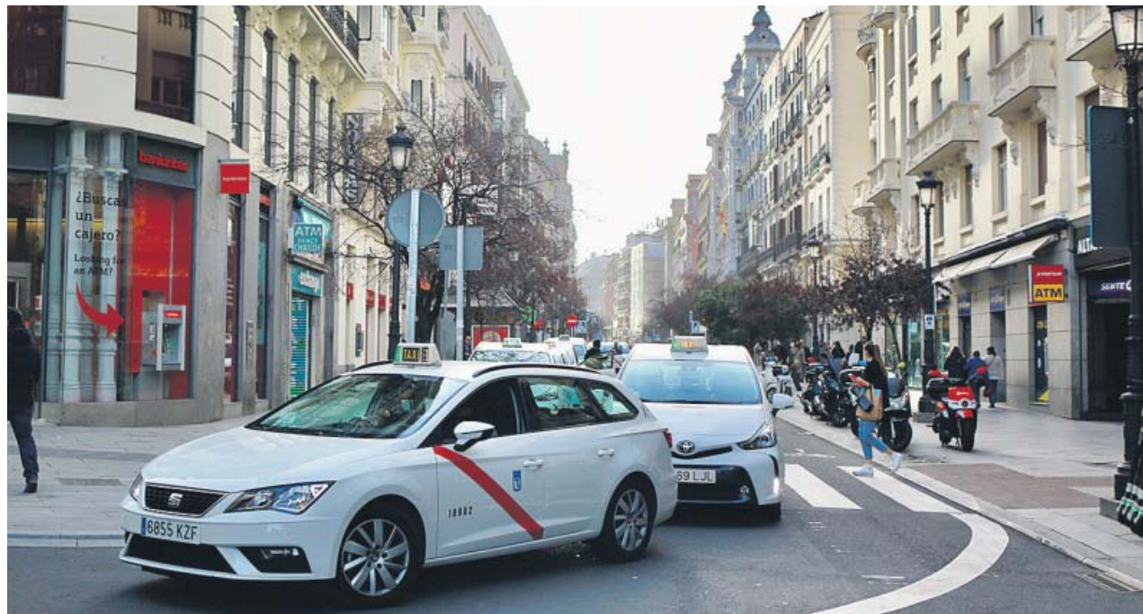
Varios taxis circulando por la zona de bajas emisiones del centro de Madrid.

Al hilo de la primera medida desgranada, el servicio de taxi también ofertará precios cerrados para trayectos a otros puntos de la ciudad. El usuario