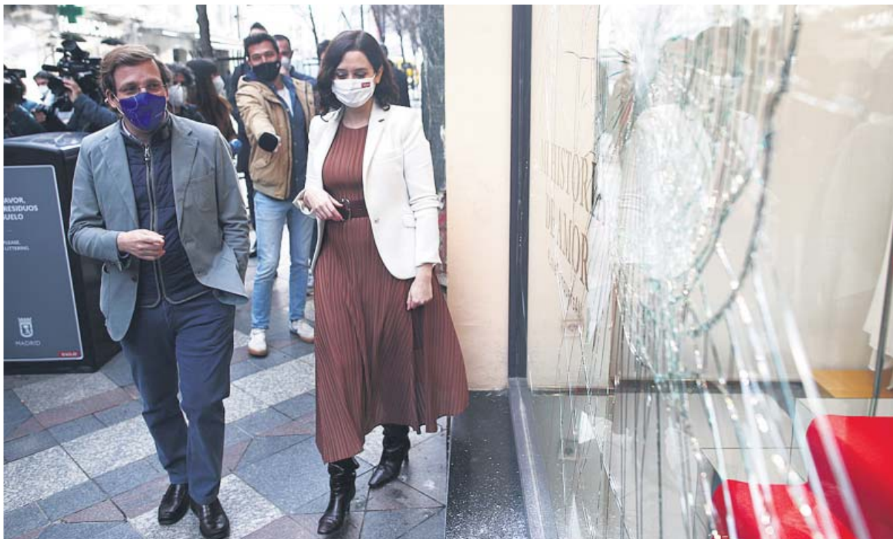
El alcalde Martínez-Almeida y la presidenta Díaz Ayuso, ayer, evaluando los daños que dejaron los disturbios.