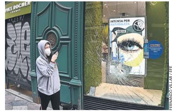
Un hombre pasea, ayer, ante un escaparate roto.

INDULTO Iglesias pide a Justicia la medida de gracia. Vox exige a Sánchez que cese al vicepresidente