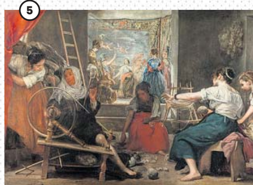
← 'La fábula de Aracne o Las hilanderas' Conocidísimo cuadro del pintor español Diego Velázquez. Es un óleo sobre lienzo, de medidas 170 x 250 cm (dimensiones originales, sin las adiciones del siglo xviii); actualmente 223 x 293,4 cm. De 1655-60. Madrid, Museo Nacional del Prado.