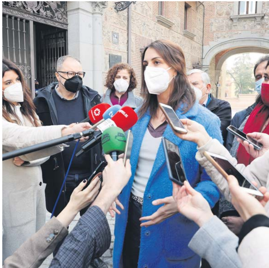
La portavoz de Más Madrid, Rita Maestre, ayer ante la prensa.

4 de marzo de 2021. Otros cuatro ediles se separan de la formación por no compartir intereses.