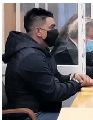
El acusado de atropellar a su mujer en la A5 en 2018.

Un Jurado Popular de la Audiencia de Madrid declaró ayer culpable de asesinato al acusado de acabar con la vida de su pareja sentimental tras atropellarla la noche del 23 de marzo de 2018 al regreso de una ceremonia familiar en la localidad toledana de Las Ventas de Retamosa. En el juicio, el acusado alegó que se trató de un accidente al ir «drogado y bebido» al suceder los hechos cuando regresaban de una fiesta familiar y en medio de un permiso penitenciario. Manifestó