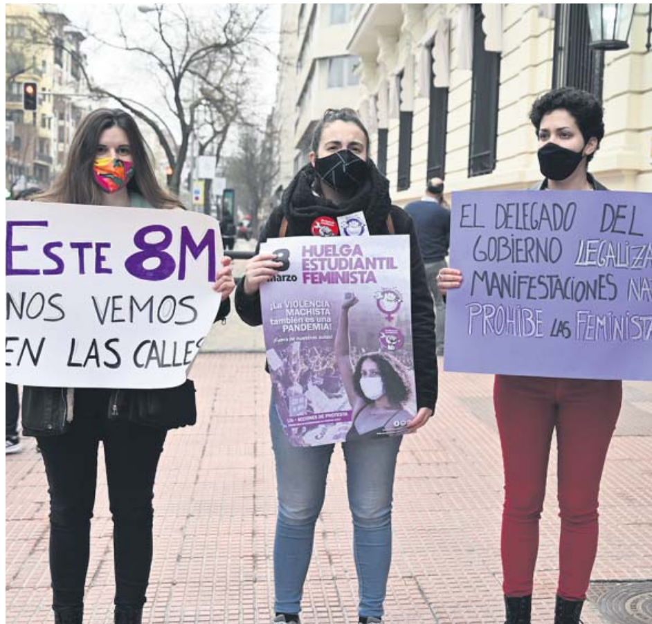
Estudiantes protestan contra la decisión de la Delegación del Gobierno en Madrid.

Feminismos Madrid, el colectivo convocante de los actos y concentraciones del Día de la Mujer en la capital, ha decidido recurrir ante los tribunales la prohibición de unas concentra-