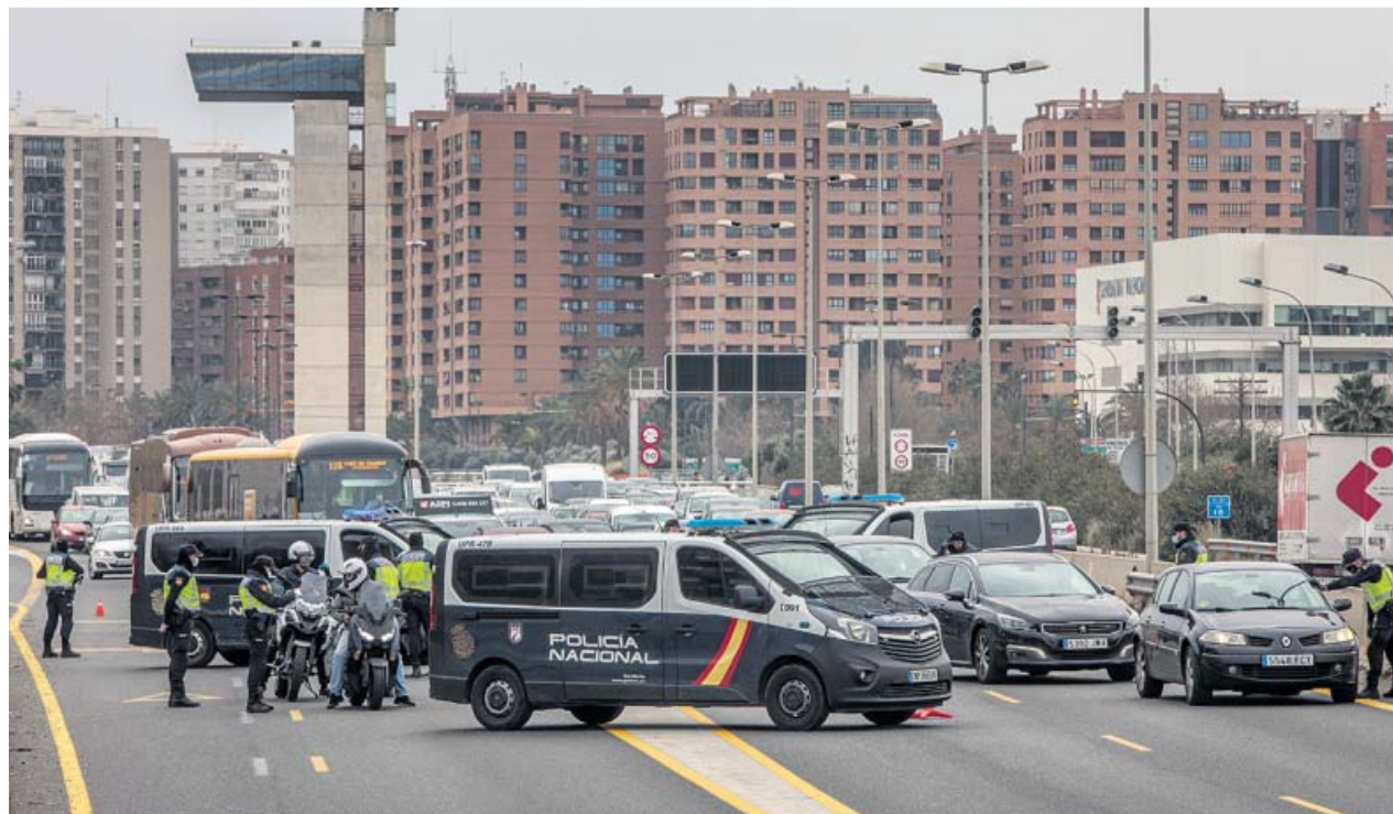
Control de movilidad por el cierre perimetral de las ciudades en Valencia.

El acuerdo se alcanzó por consenso pero no por unanimidad, porque contó con el voto en contra de la Comunidad de Madrid, y Canarias pidió ser una excepción por su condición insular. Horas antes, Isabel Díaz Ayuso había insistido en su rechazo al cierre perimetral de Madrid, recordando que comunidades que pusieron en pie esta medida hace meses no pudieron evitar el aumento de contagios ni la tercera ola. En su lugar,