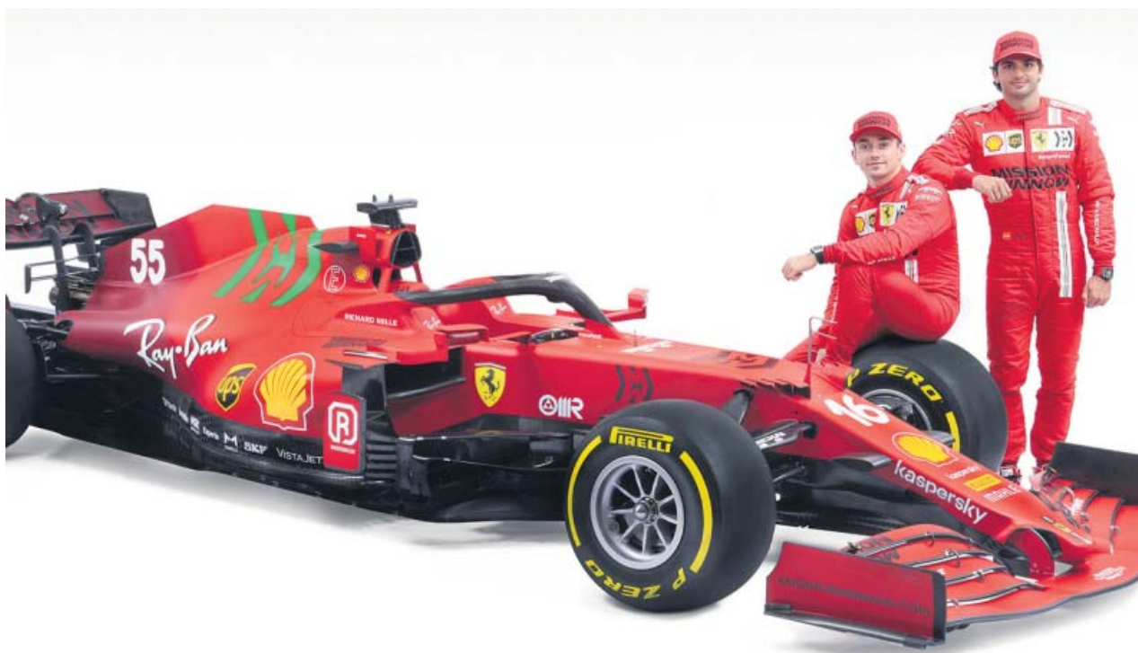
Sainz y Leclerc, junto a su nuevo monoplaza.

Ferrari mostró ayer al mundo el SF21, el monoplaza que estrenará Carlos Sainz como piloto de la Scuderia junto a Charles Leclerc. El monoplaza apuesta por la continuidad hasta cierto punto, introduciendo necesarias novedades para evitar el desastre del año anterior: un nuevo morro, suspensiones retocadas para mayor eficiencia aerodinámica, nuevo fondo plano en el suelo y en la parte trasera y, sobre todo, han trabajado en un nuevo motor completo. ●