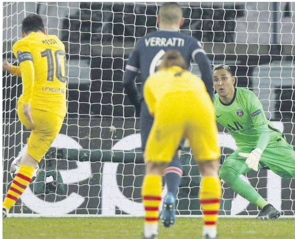
Leo Messi lanza el penalti que le detuvo Keylor Navas en el Parque de los Príncipes.

dos chuts del delantero galo, uno de Leo que dio en un defensa, un cabezazo de Busquets y el más claro, un disparo de Dembélé ante el que Keylor Navas se lució.