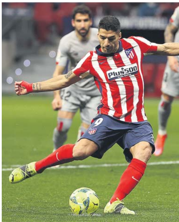
Luis Suárez lanza el penalti que significaría el 2-1.

El tanto no alteró el panorama y el partido siguió al rit-