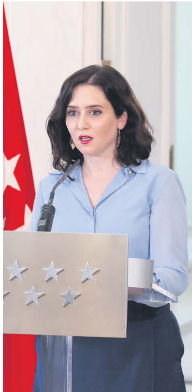
Díaz Ayuso, ayer, tras convocar elecciones en mayo.

mías, e incluso en ayuntamientos de la propia Comunidad de Madrid, nos ha llevado a esta situación», aseguró Díaz Ayuso en su comparecencia pública. Le bastaron apenas 4 minutos para justificar su sorpresiva decisión, pedir disculpas por ella e, incluso, hacer valer el proyecto del PP: «Quiero que ahora los madrileños sean los que elijan entre el socialismo o la libertad», aseveró.