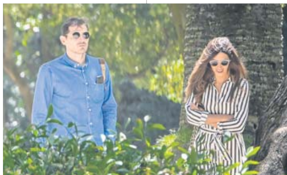
Iker Casillas y Sara Carbonero, en una imagen de 2019.

En cualquier caso, el mutismo atronador solo roto por el tímido «no voy a decir nada», pronunciado por Sara al salir del colegio en el que estudian sus hijos, podría sonar a la orquesta que tocaba cuando el Titanic empezó a hundirse. Quién sabe. ●