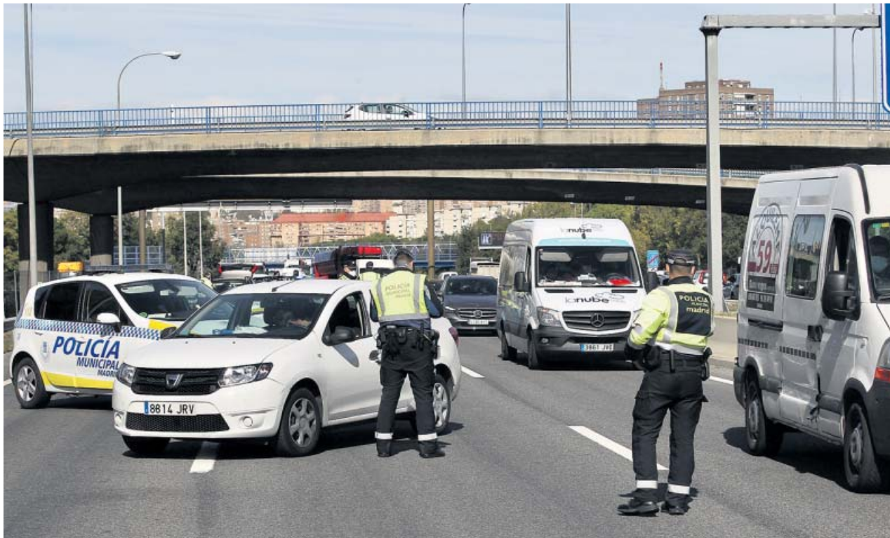
Control de policía vigilando un cierre perimetral en Madrid. JORGE PARÍS