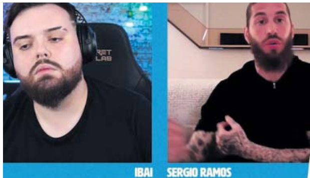
Charla entre Ibai Llanos y Sergio Ramos.

Sí confesó Ramos cómo le gustaría ser recordado cuando se retire. «Lo único que me preocupa cuando hablen de mí es que recuerden que fui alguien que siempre lo ha dado todo y que me he dejado la vida y el alma en este escudo», explicó. «Las leyendas se forjan con tus hechos. No puedes agradar a todos, pero no pueden borrar todo tu