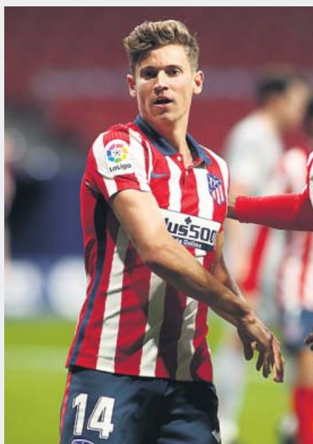
El descarte de Zidane

Dos jugadores cuestionados... y ahora las dos estrellas de la Liga