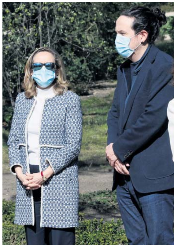
Los vicepresidentes Calviño e Iglesias, ayer.