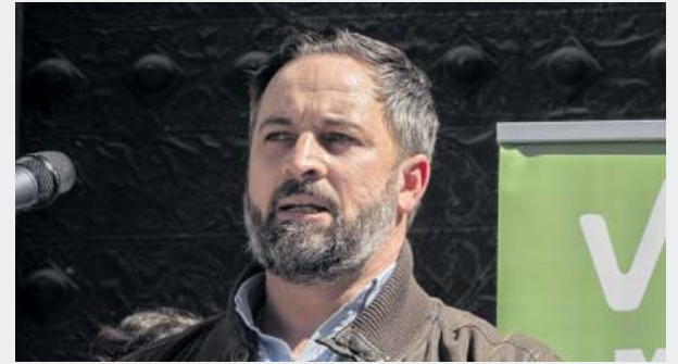
SANTIAGO ABASCAL Vox

Indefinición. Cs corre el riesgo de quedar en tierra de nadie con el último movimiento. Caída. Los últimos resultados electorales han sido muy negativos para la formación. División. Se mantienen las discrepancias internas, con voces que critican el giro.