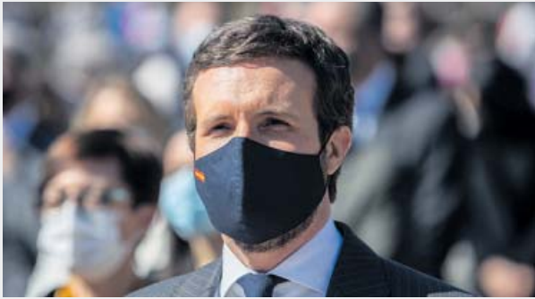
PABLO CASADO PP

Mayoría. El PP tiene la opción, si hay elecciones en la Comunidad de Madrid, de ampliar la mayoría. Oportunidad. El partido tiene la ocasión de absorber a Cs, tal como busca Casado. Espacio. Los populares podrían ampliar su espacio electoral a partir de ahora.