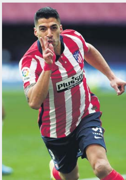
El 'regalo' azulgrana

Al Real Madrid todavía le recuerdan esta operación: vendió a un Llorente que no terminaba de cuajar al Atlético por 40 millones de euros.