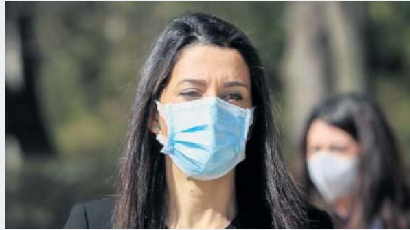
INÉS ARRIMADAS Ciudadanos

Murcia. El PP perderá uno de sus gobiernos autonómicos en favor de Ciudadanos y PSOE. Liderazgo. Si Ayuso va a más puede convertirse en la referente del partido. Derechización. El cambio de contexto puede llevar al PP a acercarse más a Vox.