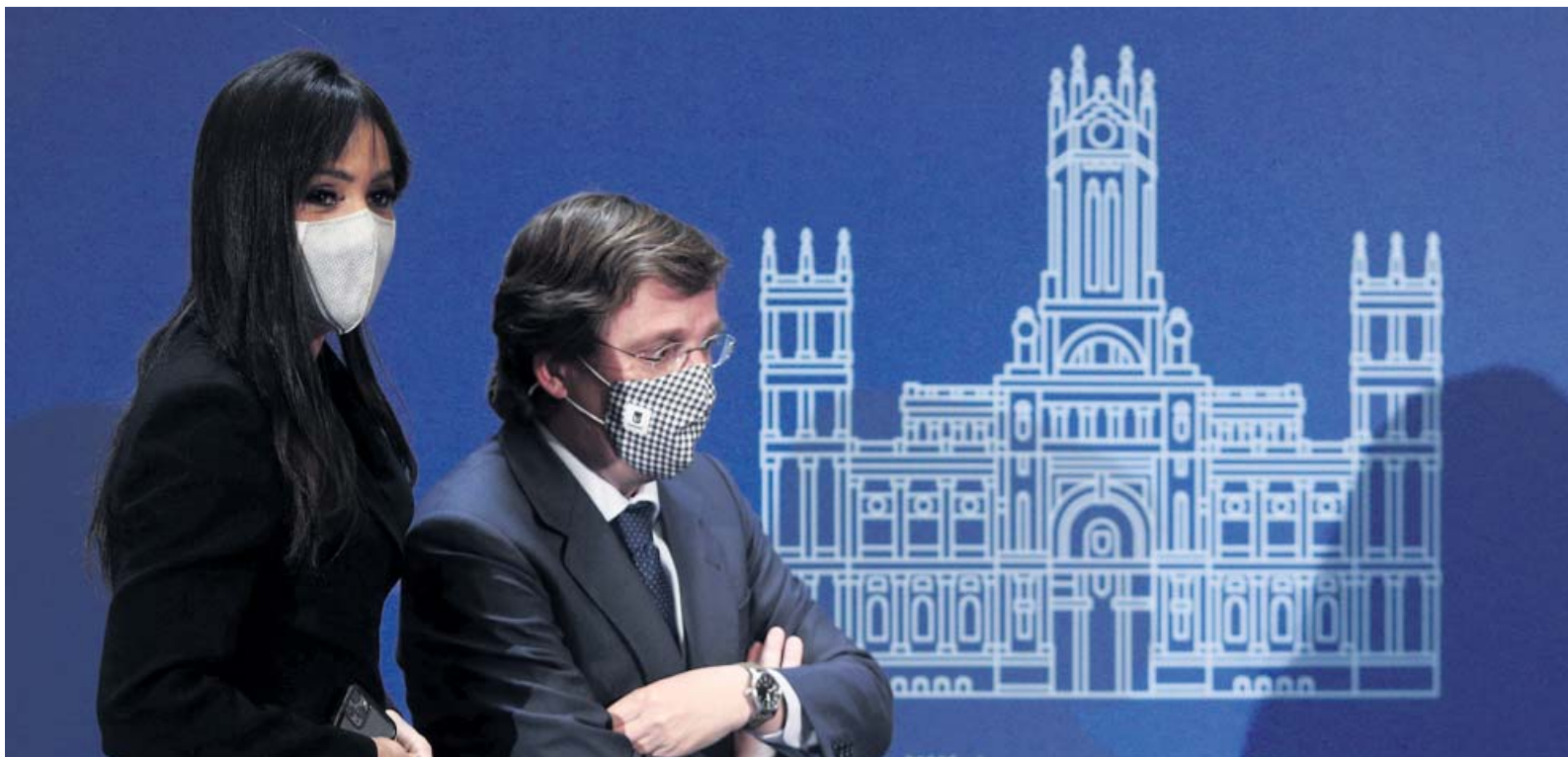
La vicealcaldesa de la capital, Begoña Villacís, y el alcalde, José Luis Martínez-Almeida, en su comparecencia de ayer.