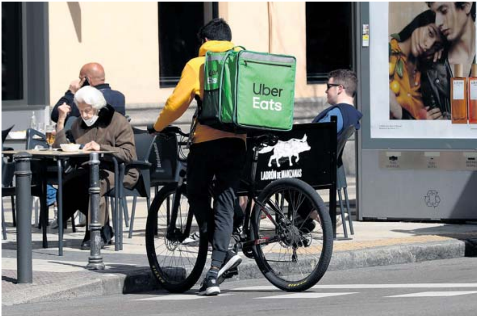
Un repartidor de la empresa Uber Eats, trabajando en bicicleta.