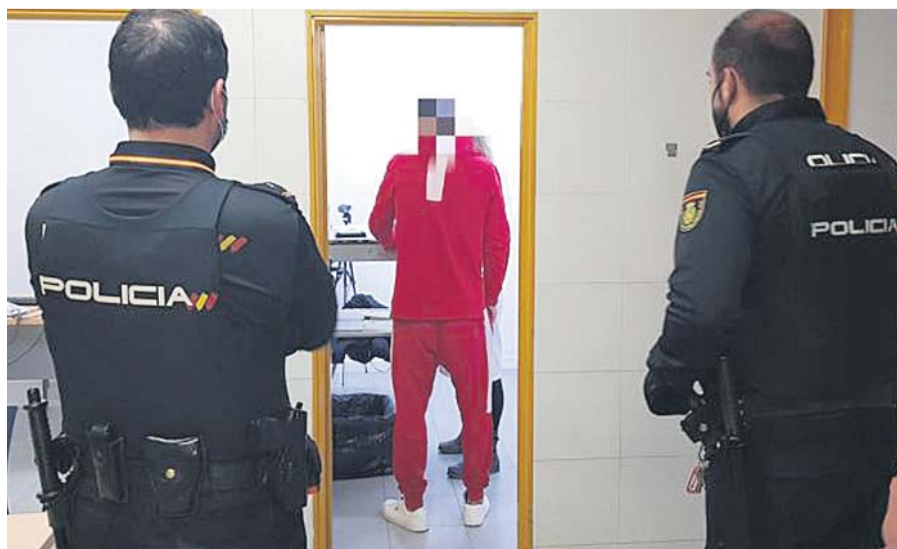
Agentes del Cuerpo Nacional de Policía tras arrestar a un ladrón que robaba en casas.