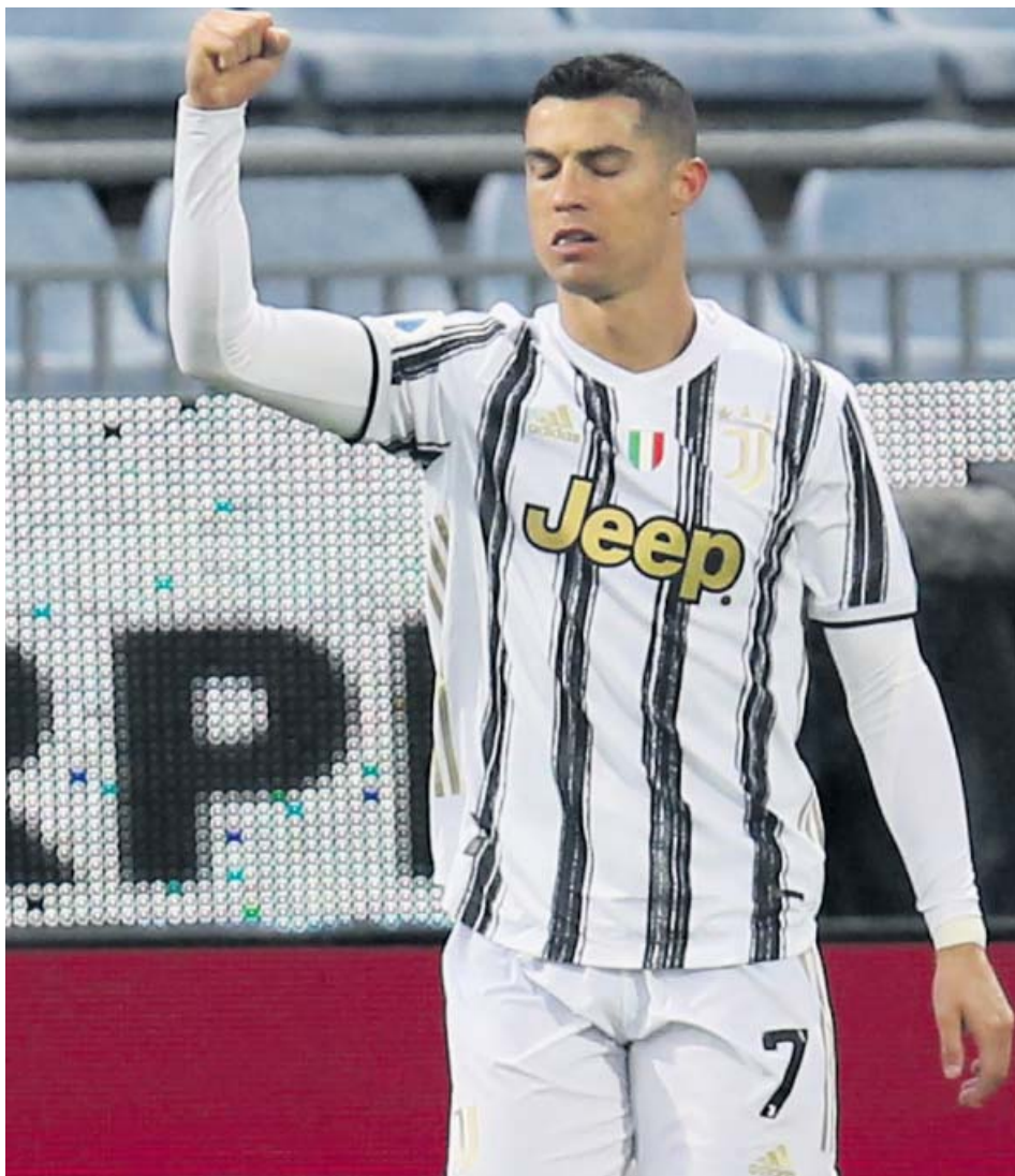
Cristiano Ronaldo celebra con rabia uno de sus goles al Cagliari.

Pero la respuesta del luso ha llegado en el campo. Donde más le gusta. Ante el Cagliari, apenas tardó algo más de media hora en hacer un hat-trick perfecto: primero marcó de cabeza, después con la derecha (de penalti) y finalmente con la izquierda en la victoria por 1-4. A sus 35 años, lleva 23 goles en 23 partidos. Hay Cristiano para rato. ●