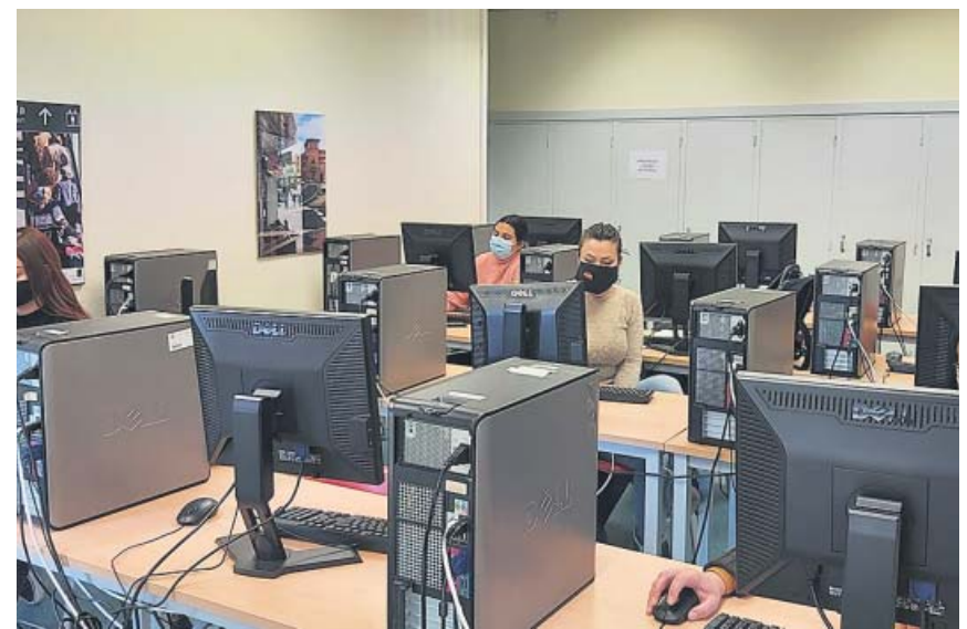
Fundación La Caixa impulsa la formación digital de más de 10.000 personas.

Estos trámites terminarán en torno al 23 de abril y será entonces cuando cada comunidad deberá hacer los suyos propios para que las ayudas lleguen a sus destinatarios finales. ●