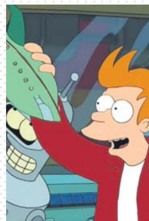
Bender y Fry, personajes de la serie Futurama . FOX

Pero el principal mérito de Futurama fue un elenco de