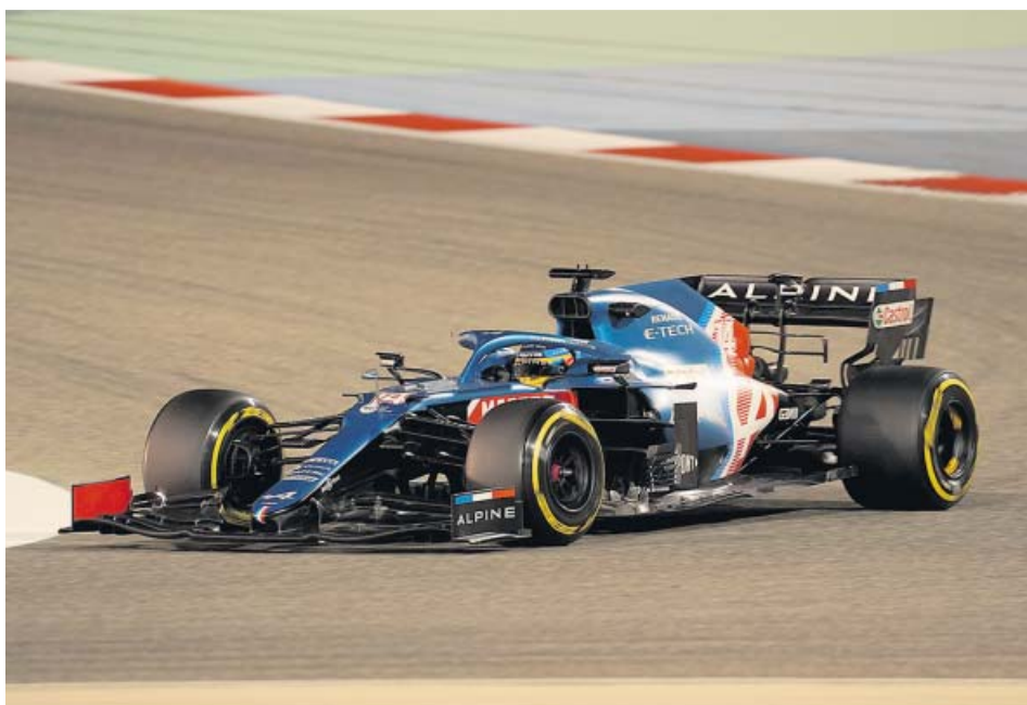
Fernando Alonso, al volante del Alpine A521, ayer, en el circuito de Baréin.

EL ASTURIANO no exprimió el Alpine con el neumático blando. Sainz mostró una gran regularidad y Red Bull marcó el ritmo