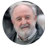
Por Diego Carcedo Periodista

Estoy bastante seguro de que una gran parte de los españoles lamentan la crisis que está sufriendo Ciudadanos, el partido que, hace apenas dos años, levantaba esperanzas en la regeneración de la democracia como ingrediente político susceptible de moderar el bipartidismo que se estaba convirtiendo en un duopolio —fundamental durante décadas en la consolidación democrática—, y que empezaba a dar muestras de fatiga.