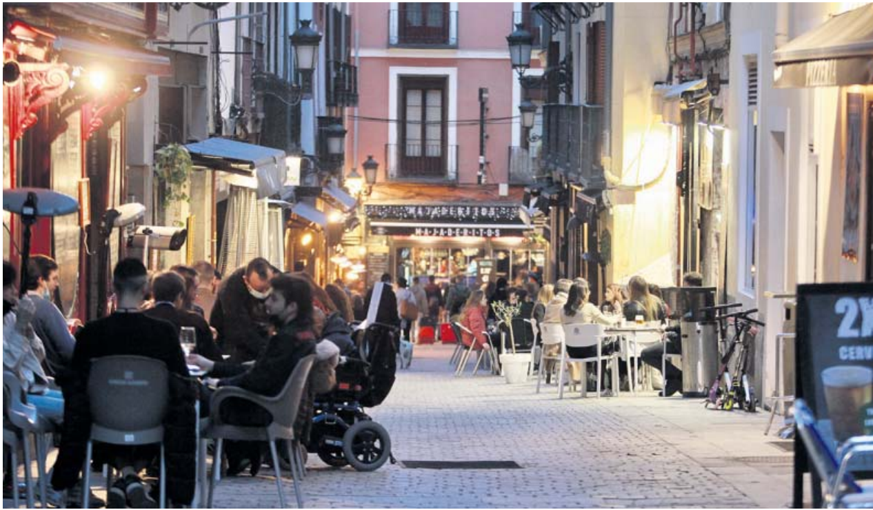
Los clientes disfrutaban de las terrazas del centro de la capital antes de cumplirse la hora del toque de queda.

Ayuso llevará a los tribunales el acuerdo de la Interterritorial porque no se adoptó por unanimidad ni lo considera eficaz