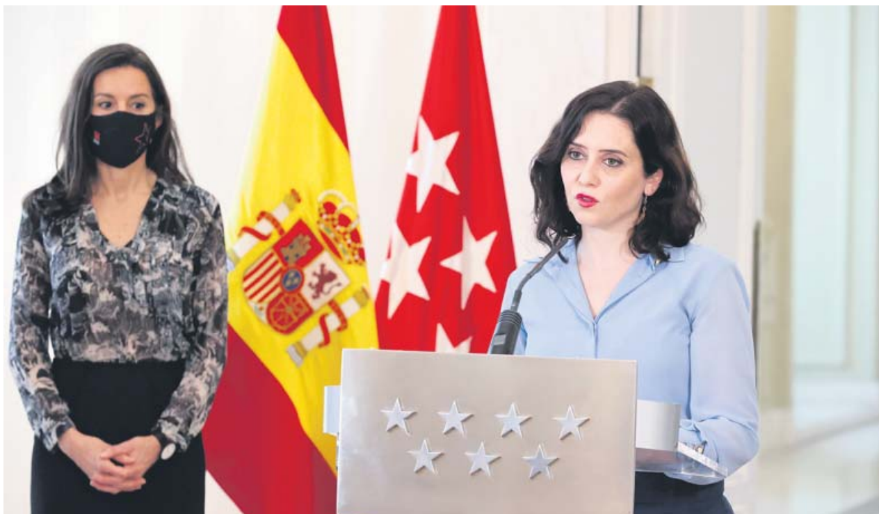
La presidenta regional, Isabel Díaz Ayuso, durante la comparecencia en la que anunció la convocatoria electoral.

AGUADO tacha los comicios de «despropósito» y la oposición se conjura para «echar» a Ayuso