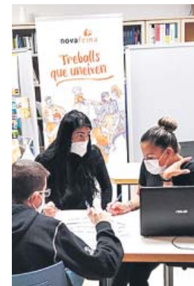
Jóvenes recibiendo formación en Valencia.

Esta iniciativa consolida la colaboración entre ambas instituciones iniciada en 2016 para ayudar a mejorar la empleabilidad de las per-