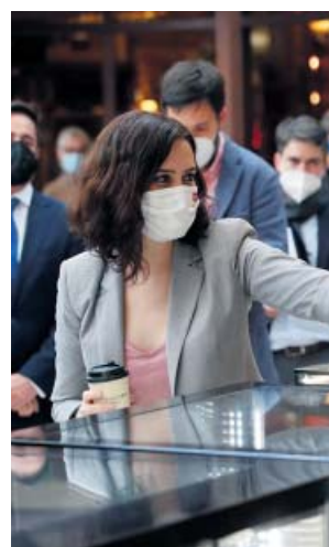
La presidenta Díaz Ayuso, ayer, en Arroyomolinos.

Asimismo, señaló que quiere gobernar en «solitario» porque está en su «derecho» de intentar formar un gobierno que «no se pueda bloquear». De esta forma, pretende conseguir una mayoría