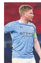
Kevin De Bruyne