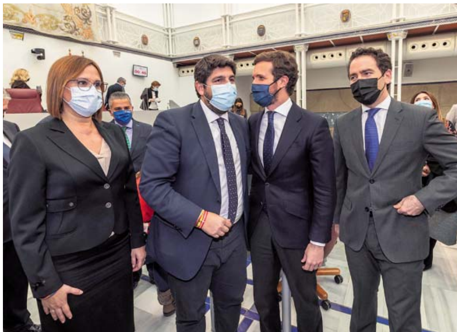
El líder del PP, Pablo Casado, acompañó ayer al presidente murciano, Fernando López Miras (2i).

El ministro añadió que se está trabajando en un plan estratégico que modernice el empleo público para que el acceso «tenga más en cuenta la capacidad y la aptitud y menos la habilidad memorística de los candidatos», y avanzó que se regulará la ampliación de los procesos de estabilización vigentes para promover así la estabilización de personal interino. ●