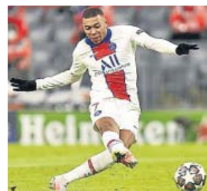
Mbappé, estrella en el partido ante el Bayern.

intención es tenerles a los dos este verano, pero el objetivo número 1 es Mbappé. Una vez el futbolista ya se ha negado a renovar, la pelota está en el tejado de los directivos. Florentino y Nasser Al-Khelaifi se sen-