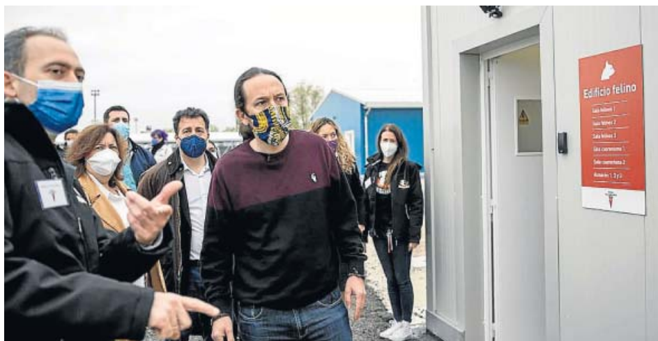
Pablo Iglesias, en una visita ayer a un refugio de animales.

«Todo el mundo sabe perfectamente a qué iban», dijo Iglesias sobre la presencia de Vox en Vallecas. «Insultan a los vecinos, les amenazan, les arrojan objetos (...) y cuando ven que no les funciona y que no iban a conseguir lo que