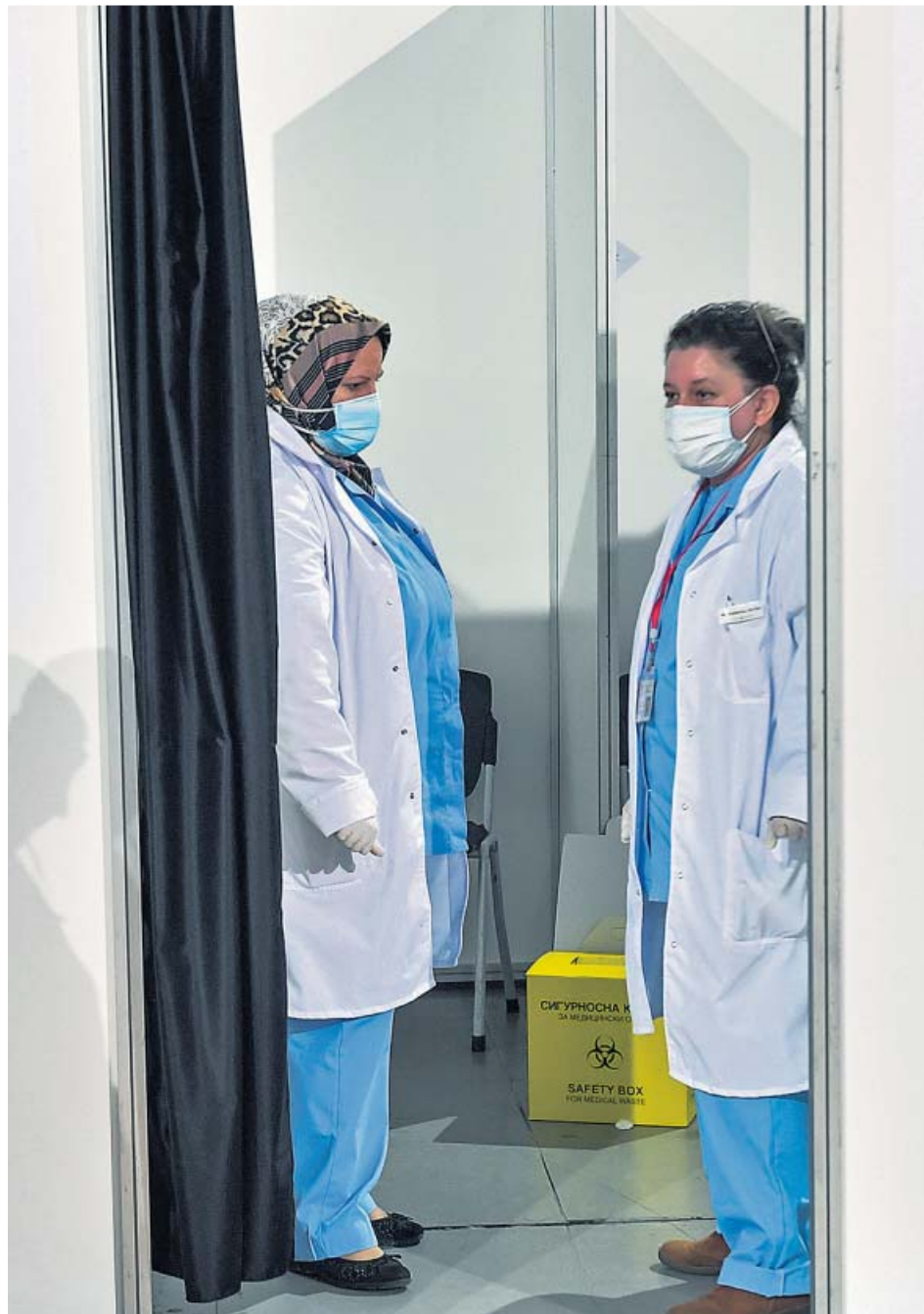
Enfermeras esperando pacientes para inocularles la vacuna de Sputnik, en Macedonia.

En Cataluña, la portavoz de la Generalitat, Meritxell Budó, mostró el martes su desacuerdo sobre la maniobra de Ayuso y