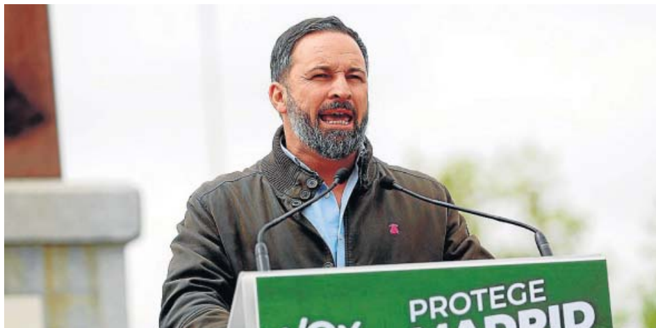
Santiago Abascal, en un acto de Vox en la plaza de la Vicalvarada ayer.

buscaban, Abascal desde la tribuna dice que a por ellos», afirmó el número 1 de la lista de Unidas Podemos al 4-M en un vídeo difundido a través de sus redes sociales. «Si esto pasara en Europa, nadie diría que los ultras son los buenos», añadió. Directamente, Iglesias responsabiliza a Abascal de haber provocado las cargas policiales al acercarse al cordón de seguridad pocos minutos después de su llegada a la plaza.