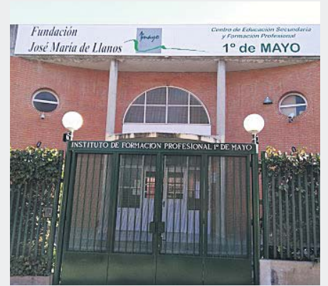
Fundación José María de Llanos

“ El Ayuntamiento cree que el académico de la Real Academia de Bellas Artes de San Fernando es merecedor de esta distinción dado que durante su trayectoria, y en concreto durante la pandemia, ha apostado por la difusión de la cultura en Madrid.