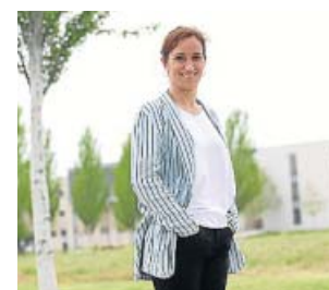
Mónica García.

La candidata de Más Madrid a la presidencia de la Comunidad de Madrid, Mónica García, acusó ayer a Vox y a su líder, Santiago Abascal, de ser los responsables de los altercados producidos en el acto de la formación en Vallecas. García aseguró que Vox acudió al barrio a hacer «turismo de provoca-