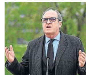
Gabilondo, en Alcorcón.

El candidato del PSOE, Ángel Gabilondo, pidió ayer dejar a un lado la «confrontación» y parar «la espiral de extremismos» en la que, a su juicio, está entrando la precampaña de las elecciones del próximo 4 de mayo. La clave, dijo, es hablar de los problemas «reales» de la ciudadanía, como la Sanidad.