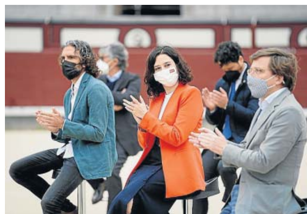
Isabel Díaz Ayuso, ayer, en Las Ventas.

La obra, de 270 centímetros de alto y 190 de ancho, ha sido financiada con los fondos recaudados a través de la corrida benéfica celebrada en Valladolid en 2016 en la que participaron Juan José Padilla, José Tomás, Morante de la Puebla, El Juli, José María Manzanares y Alejandro Talavante. Ese año, todos los compañeros de Barrio se unieron para poner en marcha esta iniciativa que culmina con la exposición de la obra.