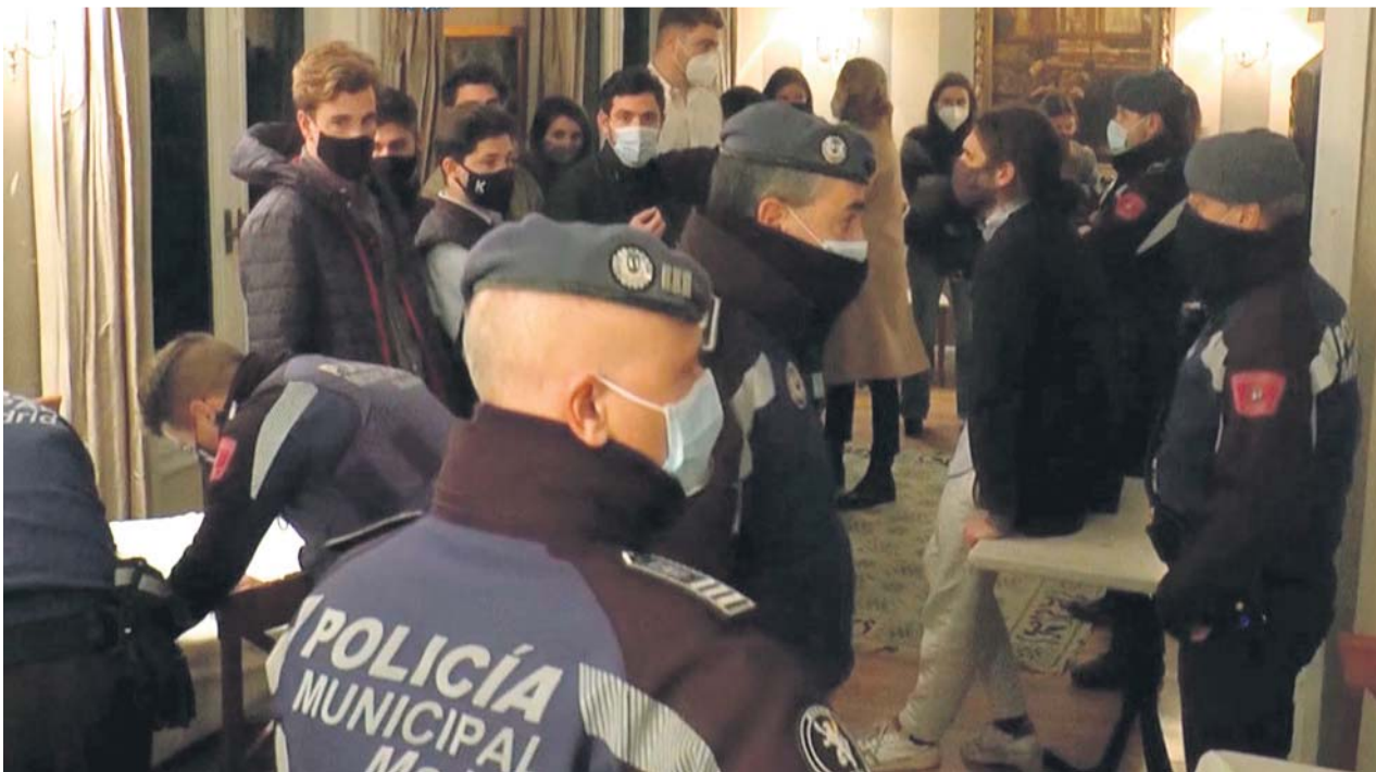
La Policía desaloja una fiesta ilegal.