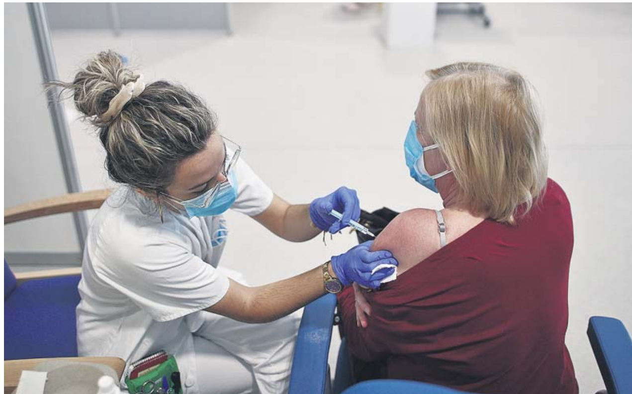
Una sanitaria vacunaba ayer a una mujer de entre 60 y 65 años en el Hospital Enfermera Isabel Zendal de Madrid.