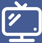
IMAGEN Y SONIDO