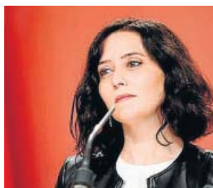
Isabel Díaz Ayuso.

La presidenta de la Comunidad de Madrid, Isabel Díaz Ayuso, condenó los altercados que tuvieron lugar en el acto de presentación de campaña de Vox en Vallecas y considera «asqueroso» que algunos intenten «adueñarse políticamente» de los barrios como si fueran suyos.