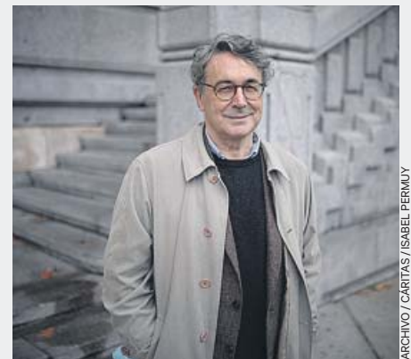
Andrés García Trapiello

“ El Consistorio quiere homenajear al cantante madrileño por su contribución al impulso del rock en España en general y en Madrid, «de manera muy especial». Durante su trayectoria, también colaboró con programas de radio y televisión.