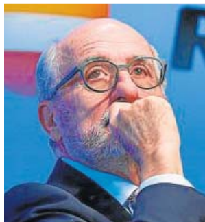
Antonio Brufau, presidente de Repsol.

La CNMC lleva tiempo vigilando de cerca los cambios de comercializador que las empresas del sector efectúan sin el consentimiento explícito de los usuarios. La ley respalda que todo ciudadano puede saltar de una compañía energética a otra cuando quiera, pero no permite que sean las compañías las que puedan traspasar su cartera de clientes. El Gobierno incluyó el veto a la comercialización puerta a puerta de contratos de electricidad y gas —causa más frecuente de estos cambios no deseados, según Facua— en el real decreto ley de medidas urgentes para la transición energética. La norma, vigente desde octubre de 2018, disparó la polémica entre las energéticas, que alegaron que perjudicaba a los más de 5.000 comerciales de todo el país. Pese al 'coto' del Gobierno y la lupa del supervisor, los con-