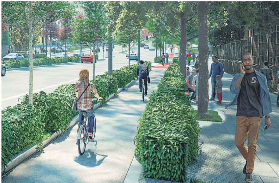
Recreación del carril bici proyectado en el bulevar de Joaquín Costa.

DESDE EL BULEVAR El Ayuntamiento habilitará un carril bici sobre la calle Vitruvio PROYECTO A final de año ejecutarán otro trazado de Plaza Castilla a Nuevos Ministerios