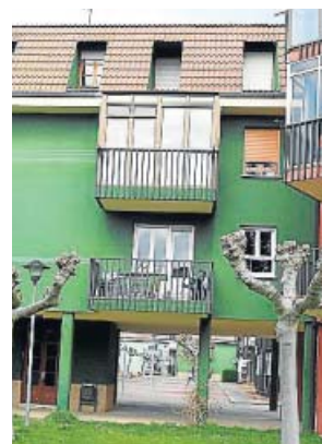
Vivienda en la que tuvo lugar el crimen.

en la tercera planta. El vecino de abajo, en declaraciones a la Agencia Efe, contó que les escuchó mantener una fuerte discusión y después, un fuerte golpe. El agresor salió instantes después de la vivienda, fue al centro médico y dijo a los vecinos que la había matado. «Estábamos mi mujer y yo y otra vecina en el descansillo de la