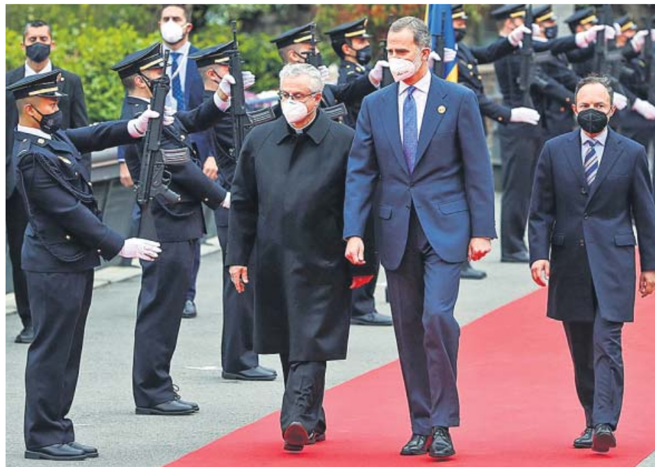
Felipe VI: «Iberoamérica puede contar con España». El rey Felipe VI, que fue recibido ayer con honores militares en Andorra, prometió a los líderes latinoamericanos que, «a pesar de los tiempos que estamos viviendo», podrán «contar siempre con España como un aliado fiel».

«España es uno de los principales países inversores en Iberoamérica» y quiere «seguir siendo una referencia en la re-