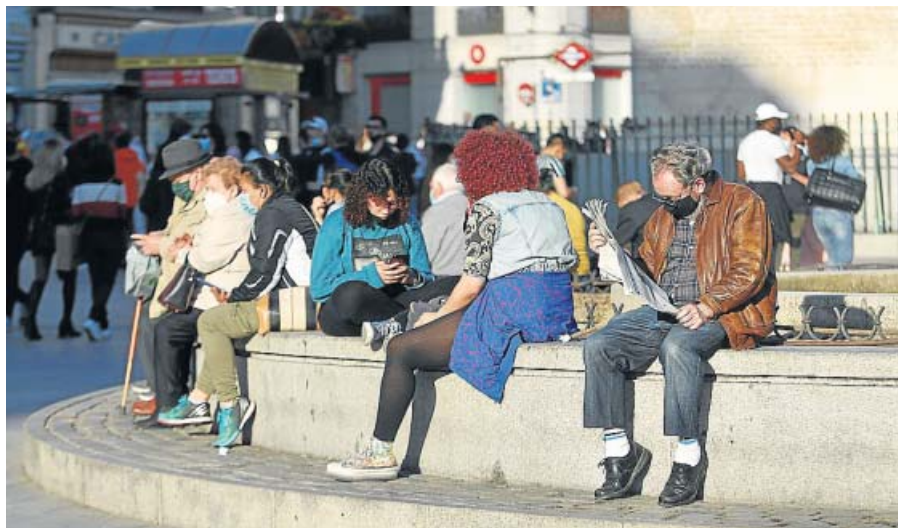
Un grupo de personas en Madrid, la región que más habitantes perdió. JORGE PARIS

ra contención en la reproducción como consecuencia de la crisis. La incertidumbre económica hace que las parejas ni se planteen en la actualidad tener hijos», afirma Marta Domínguez, profesora de Sociología de la Universidad Com-