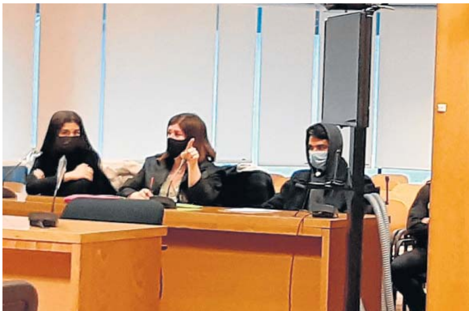
Imagen del juicio contra el canibal de Ventas iniciado ayer.