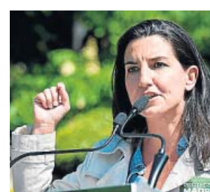
Rocío Monasterio.

Vox promete acabar con los narcopisos y con la ocupación ilegal de viviendas si gana las elecciones del 4-M. La cabeza de lista de la formación, Rocío Monasterio, se comprometió ayer con estos objetivos y lo hizo a las puertas de una vivienda usurpada en el barrio de Caraban-