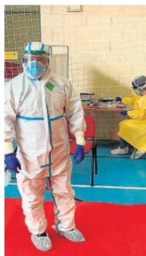
Dos sanitarios hacen test masivos en Andalucía.

La incidencia a 14 días subió ayer, no obstante, en varias comunidades, especialmente en el norte peninsular: La Rioja (+8,7%), el País Vasco (+7,5%) y Cantabria (+4,3%) fueron las que registraron los mayores ascensos, seguidas por Baleares (+3,1%), Castilla-La Mancha (+2,4%), la Comunidad Valen-