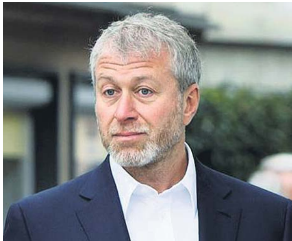
Roman Abramovich, dueño del Chelsea, fue el primero en mostrar su intención de marcharse.