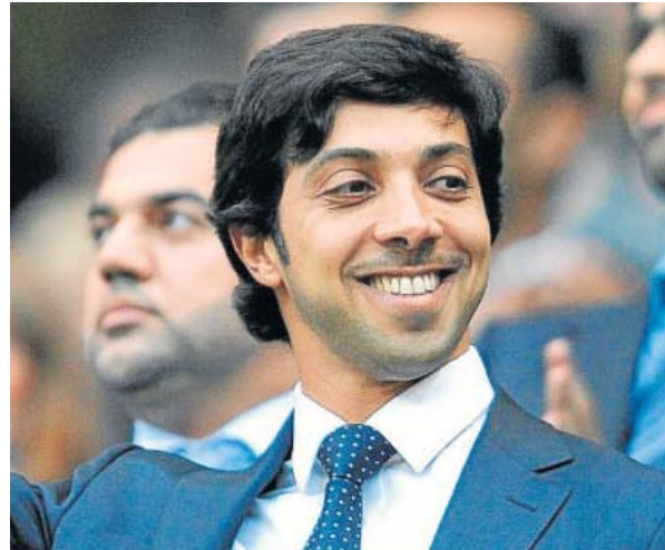
El jeque Mansour bin Zayed, dueño del Manchester City, fue el primero en hacer oficial su marcha.