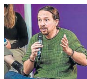
Pablo Iglesias.

El candidato de Unidas Podemos a presidir la Comunidad de Madrid, Pablo Iglesias, prometió ayer que, si gobierna, sacará a la región «de la desobediencia constitucional» en terreno fiscal y bajará el impuesto del IRPF a autónomos y a los trabajadores que menos ganan. En concreto, el partido morado ase-