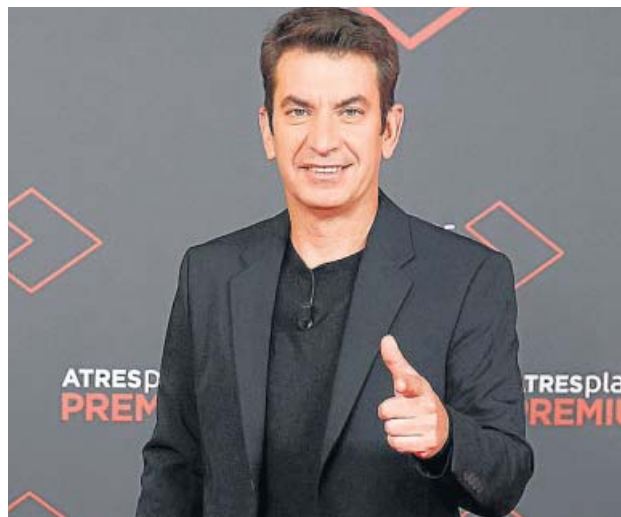
El presentador y actor Arturo Valls.

Además, se ruedan ya nuevas temporadas de Los elegidos , Toyboy , By Ana Milán y Luimelia y está a punto de estrenarse el concurso Drag Race . También habrá más reportajes biográficos en Pongamos que hablo de... con Iñaki López. ● I.Á.