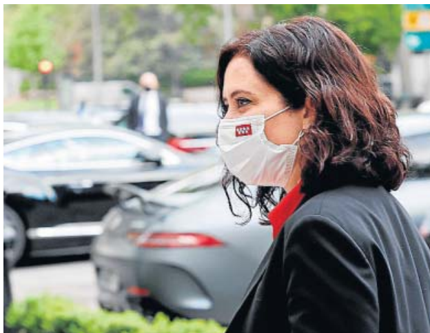
Díaz Ayuso, a su llegada al Hotel Mandarin Oriental Ritz.