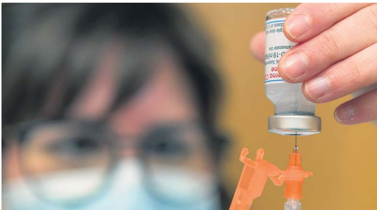
Una sanitaria saca una dosis de una de las vacunas contra el coronavirus para administrarla en Zaragoza.

LA AGENCIA europea ha registrado 8 casos de trombos «raros», pero los beneficios de la vacuna superan «con mucho» los riesgos SANIDAD reparte entre las CC AA las 146.000 dosis guardadas para inocularlas a personas de entre 70 y 79 años