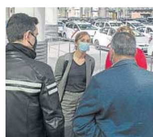
García, con el sector del taxi.

La candidata de Más Madrid, Mónica García, prometió ayer volver a aplicar en la Comunidad, de forma efectiva, la ratio de un VTC por cada 30 taxis para proteger el sector del transporte de pasajeros a precios regulados. García denunció que el PP quiere implantar la «ley de la selva» y «desregular y liberalizar» el