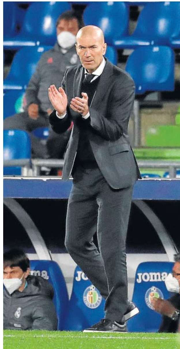
Zidane, en el partido de Getafe.

No hay problemas que parezcan alterar a Zidane, que mantiene el optimismo. Basta echar la vista atrás: «En ocho meses de competición ha pasado de todo. Estábamos en la calle, yo el primero, los jugadores no valían nada y no es así, nunca. Lo importante es que hay vida, estamos compitiendo y es lo que nos anima. Hasta el final, hasta el último día, lo vamos a pelear pase lo que pase. No sé si ganaremos o no, lo importante es la fuerza