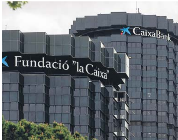
Sede de CaixaBank.

Además, propondrá «cambios en las condiciones laborales» hacia «un marco sostenible y uni-