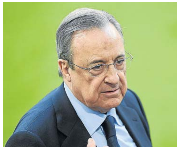
Florentino Pérez, el gran impulsor del proyecto, continúa confiando en que la Superliga salga adelante.

do saber 20minutos . Poco después, el Manchester City se unía a ellos, y renunció a formar parte de la competición. Fue el primero en hacerlo oficial, además. Antes, Pep Guardiola se había mostrado contrario a la competición.