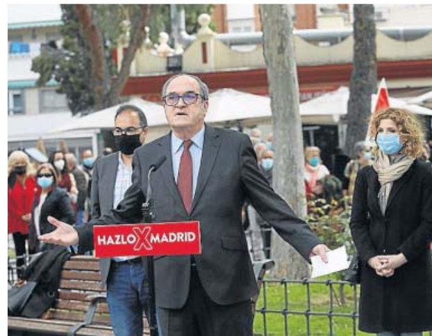
Ángel Gabilondo, en su visita de ayer a Leganés.