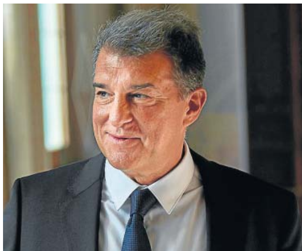
Laporta condiciona la presencia del Barça en la Superliga a lo que digan los socios en la Asamblea de mayo.