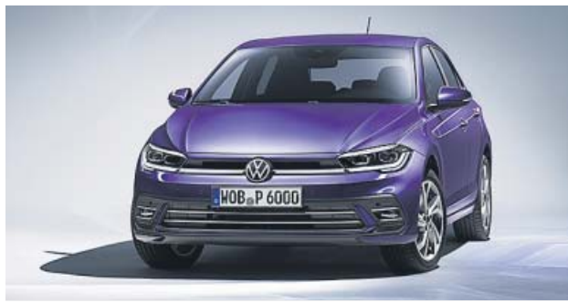
Los cambios exteriores lo asemejan al último Golf.

Según avance el verano llegará al mercado la versión actualizada del popular Polo. Estéticamente, la puesta al día afecta a los nuevos paragolpes y las ópticas por LED –las traseras más grandes y estilizadas–, mientras que por dentro cambia el volante y mejoran los acabados y las soluciones digitales, con pantalla de 8 (Digital Cockpit) o 10,25 pulgadas (Digital Cockpit Pro) para el cuadro de instrumen-