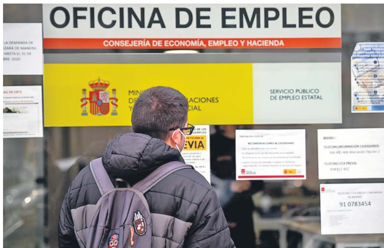
Un joven mira la información expuesta en los exteriores de una oficina de empleo. ÓSCAR DEL POZO

En este escenario, el Parlamento Europeo llega con una idea clara: no puede haber más restricciones para quienes tengan el pasaporte Covid. Según el ponente de la posición común de la Eurocámara, el español Juan Fernando López Aguilar, la prohibición de que haya restricciones adicionales es la cuestión que «probablemente» más dificultades suscitará para que Eurocámara y Consejo lleguen a un acuerdo. Lo que sí reconoce el Parlamento es que si en un Estado miembro hay restricciones que tienen que cumplir sus nacionales, también tendrán que cumplir las los turistas. ● C. PINAR