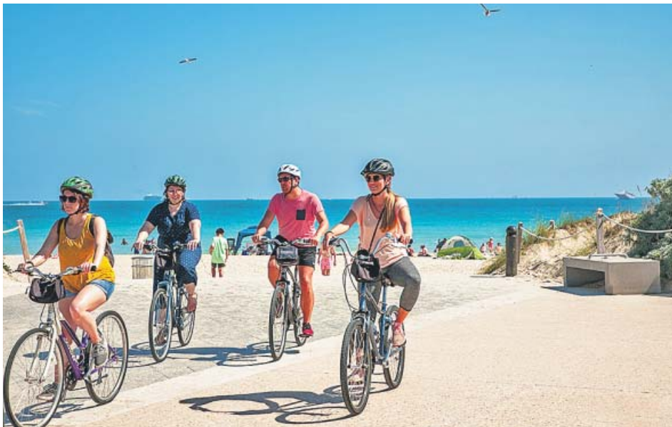
Turistas circulan en bicicletas alquiladas por el paseo de una playa.