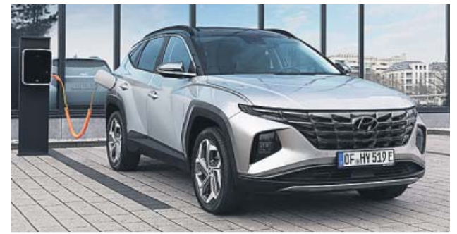
Esta nueva versión tiene tracción total y 265 CV de potencia.

El sistema híbrido cuenta con un motor T-GDi gasolina de 1,6 litros en combinación con un bloque eléctrico de 67 kW y una batería de 13,8 kWh de capacidad, lo que da al Tucson PHEV una potencia conjunta de 265 caballos, con una