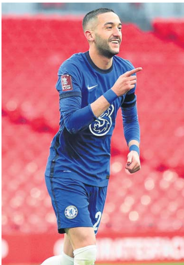
Karim Benzema y Hakim Ziyech, dos de los jugadores más talentosos que habrá hoy en el campo.