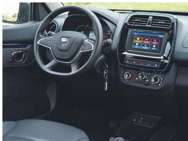
El interior es de estilo desenfadado y tiene toques de color.

El Spring, que mide solo 3,7 metros de longitud, 1,5 metros de alto y casi 1,6 de ancho, tiene un diseño atractivo, con ese toque SUV que está tan de moda y que ciertamente engancha. A pesar de su tamaño, el espacio por dentro es suficientemente amplio para cuatro personas, y además cuenta con un maletero de 290 litros.