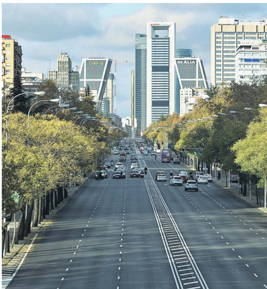
Imagen de archivo del Paseo de la Castellana. JORGE PARÍS

namiento del tráfico en condiciones similares a las actuales.