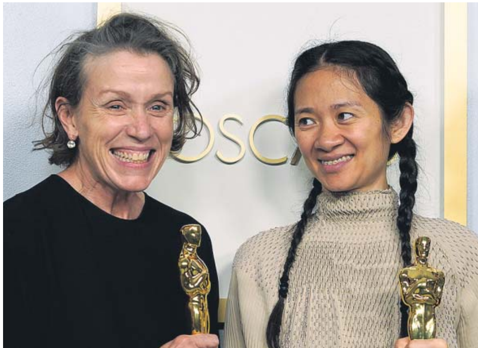
Frances McDormand y Chloé Zhao con dos de sus estatuillas por Nomadland.

El «Por favor, id a ver Nomadland en la pantalla más grande posible» en boca de Frances McDormand, triunfadora de la noche junto a Chloé Zhao (segunda mujer tras Kathryn Bigelow en ganar el Óscar a mejor dirección en 93 años) con las tres estatuillas (película, directora y actriz) para el filme que produce y protagoniza, quedó como el mensaje más revolucionario de la noche. Aunque más que revolución todo ha sido una cuestión de resiliencia, un intento de devolver protagonismo a los cines, de demostrar que estamos vivos y que necesitamos historias como las que ayer se repartieron los premios en una suerte de pedrea buenista que tuvo para casi todo el mundo, excepto para Sorkin y su El juicio de los 7 de Chicago .