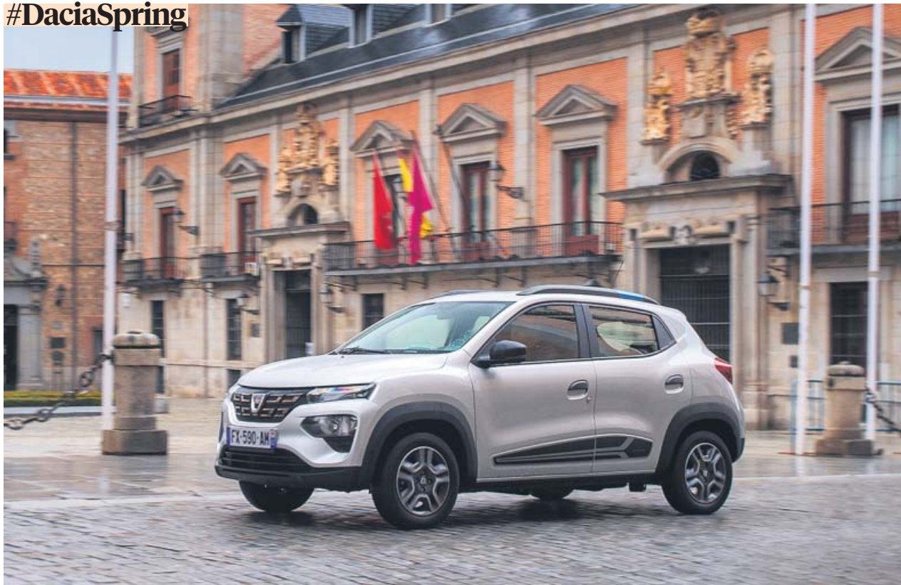
El Dacia Spring es un vehículo urbano con silueta tipo SUV que tiene en su precio uno de sus grandes argumentos. DACIA