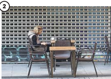
La agonía de la hostelería. Los hosteleros de Madrid, según datos de enero, perdieron un 18% de sus locales, que han cerrado definitivamente; un 9% del empleo y una facturación del 50%.