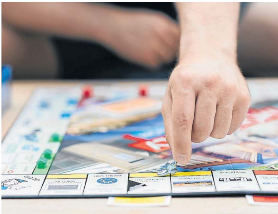
El clásico Monopoly es uno de los juegos preferidos por los españoles y líder en ventas.