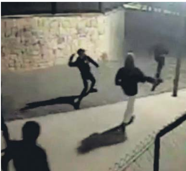
Algunos agresores, captados por una cámara de seguridad.

MENORES Ocurrió en febrero en Alicante. Nueve de los arrestados no llegan a 18 años SECUELAS La víctima ha sido operada en dos ocasiones por las graves fracturas