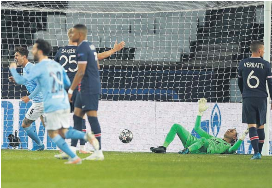
Keylor Navas, en el suelo, se lamenta tras el primer gol del Manchester City.