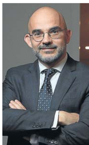
Carlos Núñez, presidente ejecutivo de Prisa Media. EP

Desde la compañía energética pasó a formar parte del selecto elenco de socios de la consultora internacional Oliver Wyman, centrado en el diseño de proyectos y reestructuraciones empresariales durante casi nueve años dentro y fuera de España. En 2014, llegó al Grupo