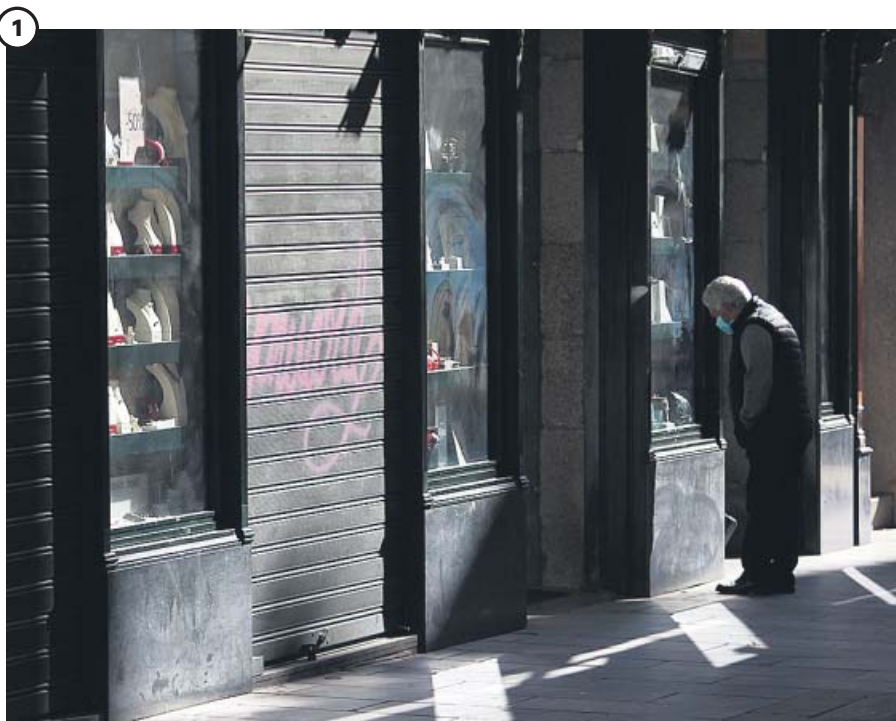
Los negocios echan la cancela. La pandemia ha asestado un duro golpe al comercio minorista tradicional. Este tipo de negocios en España perdieron más de 20.000 millones de facturación y se destruyeron 59.000 empleos en doce meses de pandemia, más los empleados en ERTE.