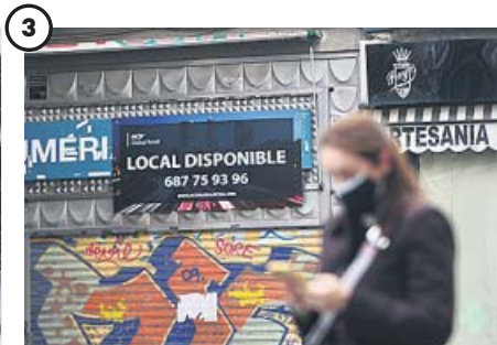
Cierre de locales. La caída del turismo por la Covid ha provocado que multitud de comercios en el centro de Madrid se hayan visto obligados a cerrar al no poder hacer frente a los costes.

ta convocatoria podrán cumplir sus solicitudes vía online , en la web de la Comunidad de Madrid, desde el próximo 1 de mayo.