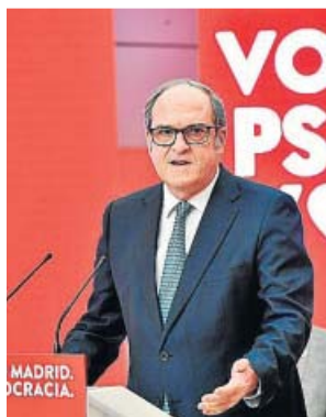
Ángel Gabilondo, ayer, en la sede de Ferraz.

«Cuando lleguen las amenazas y las ideas extremistas: cultura y educación. Para tener esto hace falta democracia», lanzó Gabilondo, que volvió a llamar al voto para «recuperar Madrid» bajo un «gobierno progresista».