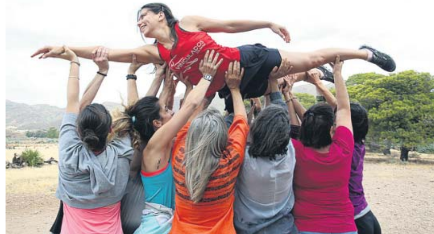
Un proyecto artístico a favor de la inclusión social de la mujer.

La investigación continúa abierta para detener a otros tres mayores de edad presuntamente implicados, quienes ya están plenamente identificados. ●