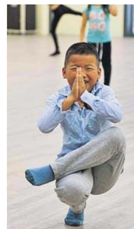
Proyecto de integración de la asociación Sudansa.

La convocatoria Art for Change de Fundación “la Caixa” impulsará proyectos artísticos y culturales participativos que ante la crisis social y cultural generada por la pandemia tendrán que afrontar las nuevas necesidades que están surgiendo en la sociedad. Por ello, la Fundación “la Caixa” este año ha aumentado el presupuesto destinado al conjunto de los proyectos con un to-