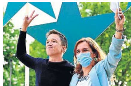
Más Madrid se encomendó a la Cuesta de Moyano, lugar de cierre de campaña de Carmena en 2015, para lanzar a Mónica García el 4-M.