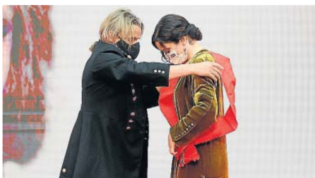
Nacho Cano 'devuelve' la distinción a Díaz Ayuso El ex de Mecano recibió la Gran Cruz de la Orden del 2 de mayo y tras dar las gracias afirmó que se lo merecía más la presidenta por apostar por abrir la cultura en la pandemia.

«La libertad es el leitmotiv de esta ceremonia (del 2 de mayo)», justificó la presidenta más tarde, a la que un micro abierto le jugó una mala pasada. «No puedo tener más ganas de que esto pase... es un plomo increíble», se le oyó. No se refería al acto del 2 de mayo, aseguró después, sino a la campaña. A esta hora, ya es historia. ●