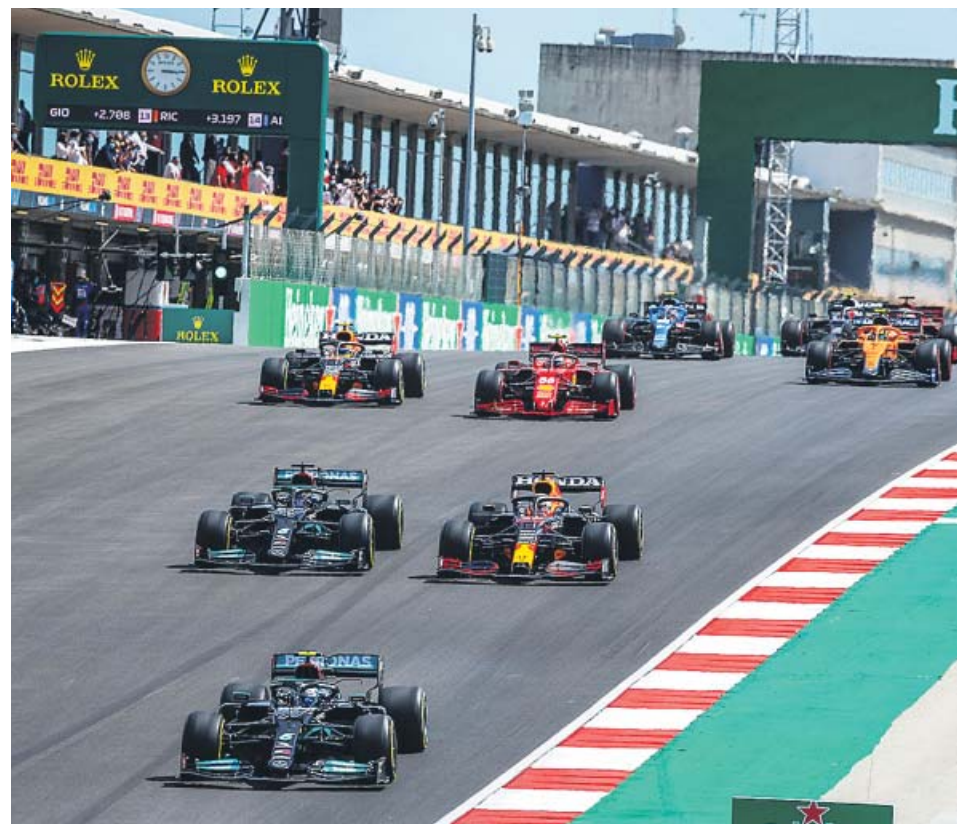
Bottas, perseguido por Hamilton y Verstappen en la salida del GP de Portugal.

Fernando Alonso, por su parte, vivió una carrera repleta de sobresaltos, como todo el fin de