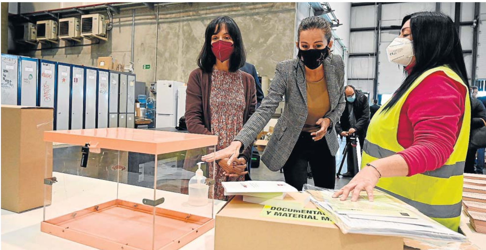
Material electoral preparado en un almacén de Alcalá de Henares para enviarse esta noche a los colegios.