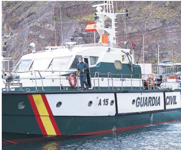
Operativo de búsqueda desplegado en Tenerife.