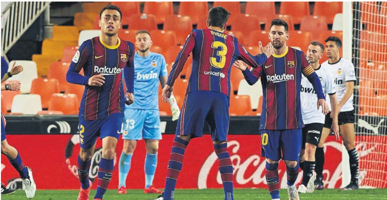
Leo Messi es felicitado por Gerard Piqué tras uno de los goles al Valencia en Mestalla.