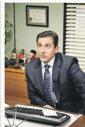
Steve Carell interpreta a Michael Scott.

El recurso a la empatía del espectador funcionó: The Office (US) aguantó nueve temporadas en antena (las