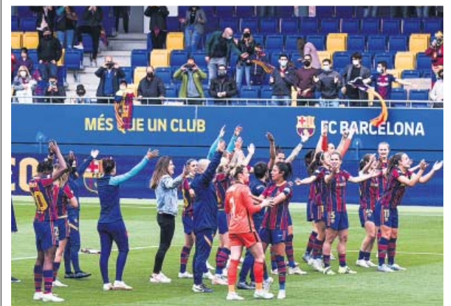
Las jugadoras del Barça celebran su pase a la final.