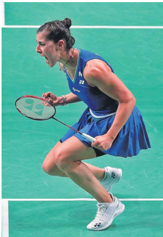
La española Carolina Marín celebra su victoria en el Campeonato de Europa de bádminton.

En el segundo set tuvo un comienzo arrollador. El parcial 4-0 de salida mostró las intenciones de la onubense, que, a