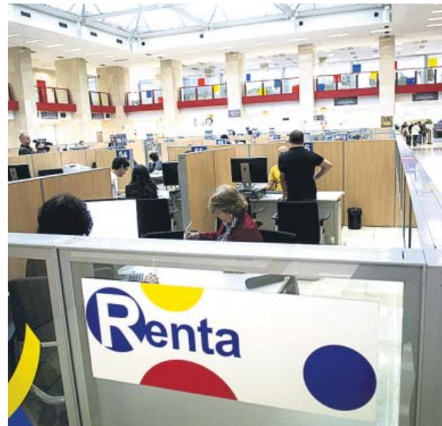
Oficinas de la Agencia Tributaria en Madrid.

Ante las informaciones de este plan del Gobierno de eliminar la tributación conjunta del IRPF, las críticas no se hicieron esperar por parte de toda la oposición. Por un lado, la portavoz del PP en el Congreso, Cuca Gamarra, dijo que así «Sánchez asfixia otra vez a clases medias y familias». Por otro, el líder de Más País, Iñigo Errejón, calificó esta medida de «un error en el peor momento» porque «si hay que recaudar no puede ser cargando un peso más sobre los hombros de quien menos tiene». Y la presidenta de Cs, Inés Arrimadas, también criticó que Sánchez celebrara el Día de la Madre «sableando a impuestos a cuatro millones de familias».