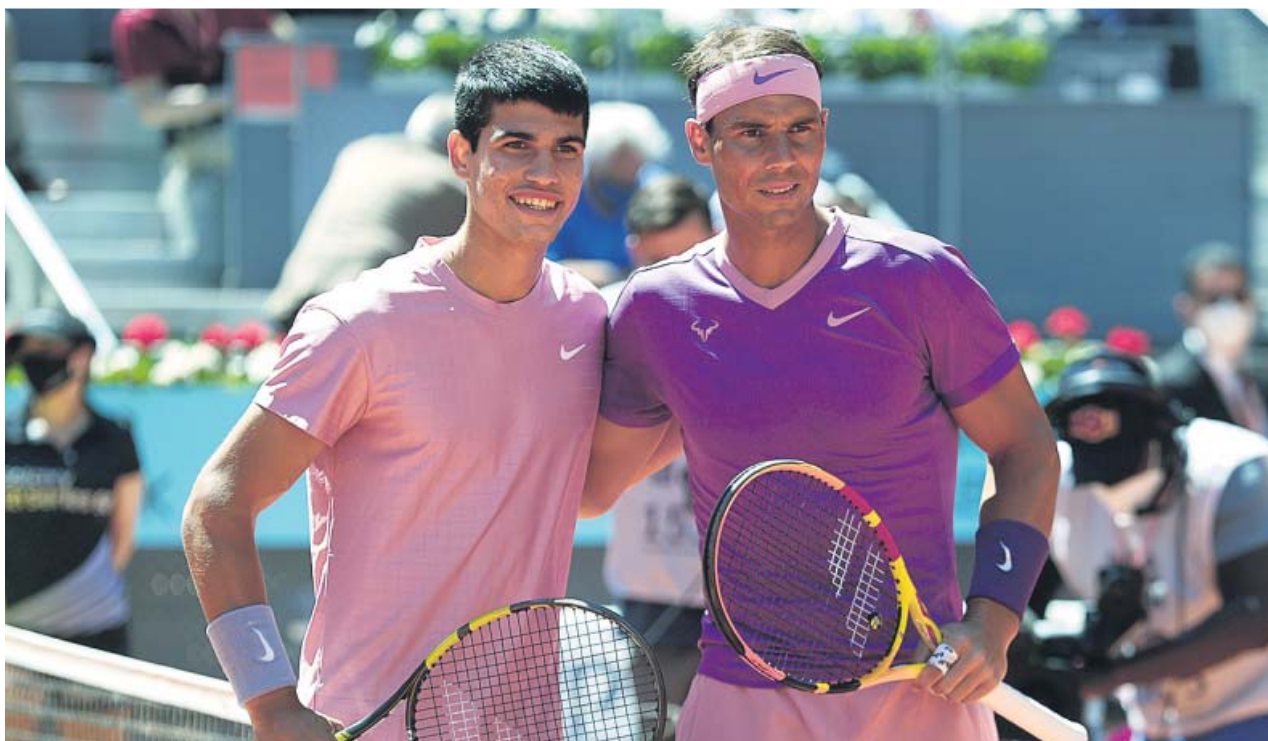
Alcaraz y Nadal posan en una foto para la historia.