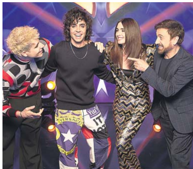
Javier Calvo, Javier Ambrossi, Paz Vega y José Mota.

En casa, el público debe tratar de adivinar quién canta bajo los disfraces y en plató lo harán de nuevo Javier Calvo, Javier Ambrossi y José Mota, y se unirá a ellos la actriz Paz Vega, que fue la ganadora de la primera edición como Catrina. Arturo Valls repite como presentador.