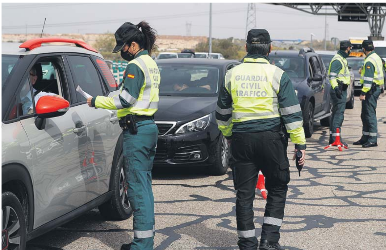
Un control policial para vigilar los incumplimientos de la normativa que impone cierre perimetral.