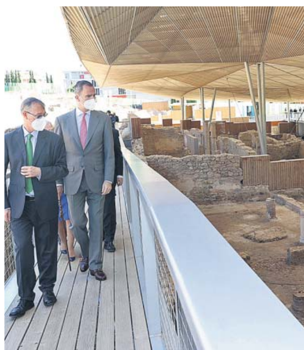
El rey Felipe VI durante la inauguración del museo.

El martes por la noche tuvo lugar una reyerta multitudinaria en los Rosales (Villaverde). Dos grupos con decenas de personas comenzaron a perseguirse a machetazos. Dos chicos de 13 y 16 años sufrieron lesiones leves.