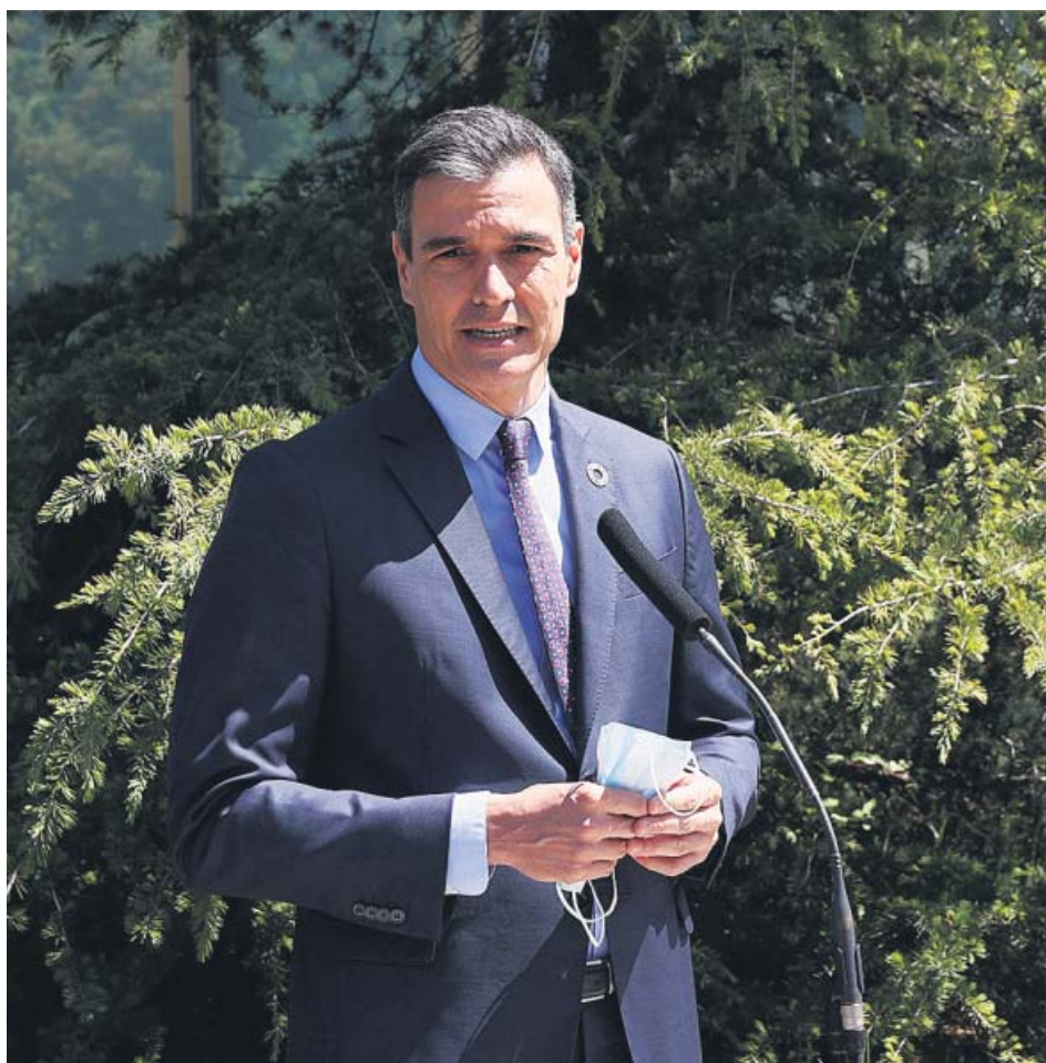
El presidente del Gobierno, Pedro Sánchez.

El apabullante triunfo de Isabel Díaz Ayuso en las elecciones madrileñas ha insuflado ánimos a la dirección nacional del PP, que ayer recrudeció su ofensiva contra el Gobierno central y retó al presidente Pedro Sánchez a convocar un debate sobre el estado de la nación, que no se celebra desde 2015. Menos de 24 horas después de que Ayuso otorgara a los populares un triunfo rotundo en la Comunidad de Madrid, dejando fuera de juego a un PSOE sorpassado por Más Madrid y provocando el abandono de la política de Pablo Iglesias, Pablo Casado celebró la reunificación del «centro y la derecha» y anticipó que la «ola» madrileña se convertirá en una «marea» estatal. Sánchez, por su parte, ale-