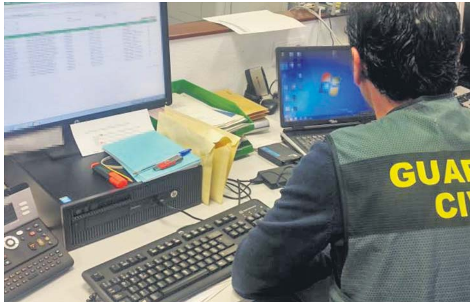
Agentes de la Guardia Civil luchan contra el cibercrimen.

Además, el fuerte incremento de las operaciones de comercio electrónico derivado de los