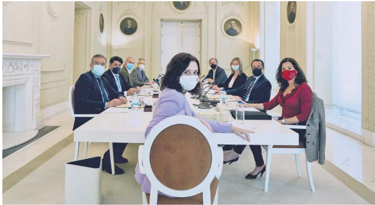
El consejo de gobierno en funciones, reunido ayer tras las elecciones del 4-M.

Otra resolución inmediata será la puesta en marcha de planes de ayudas para las personas que «se han quedado descolga-