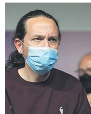
Pablo Iglesias anunció su dimisión este martes.

No obstante, el batacazo de este martes echó por tierra esa posibilidad. Tanto que, den-