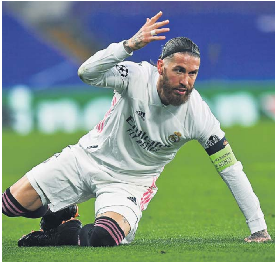
Sergio Ramos se lamenta durante el partido en Stamford Bridge.

Había acariciado el conjunto blanco el tan ansiado tanto, pero la respuesta de los de Tuchel fue contundente. Kanté arrancó con su habitual potencia desde la zona de tres cuartos, Harvets se quedó solo ante Courtois, picó el balón y lo mandó al larguero. En el rechace, Timo Werner a placer adelantó al Chelsea.