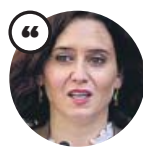
ISABEL DÍAZ AYUSO Presidenta en funciones de la Comunidad de Madrid

«Vamos a apostar por la libertad, por la vida, por las familias, por el futuro, por el autónomo y por el empresario»