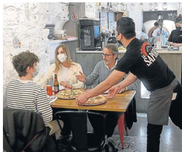
Unas personas cenando en un restaurante.

Obviamente, la situación ha favorecido este trasvase de consumo desde los bares y restaurantes hacia los hogares, vinculado principalmente al fenó-