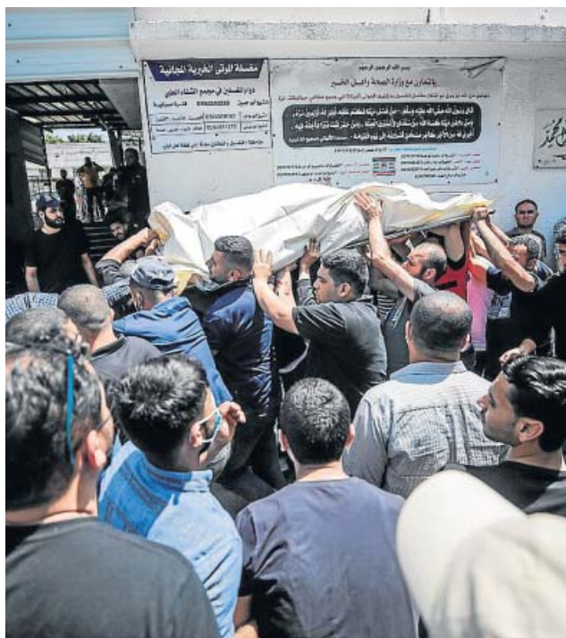
Funeral de un miliciano palestino en Gaza.

Al cierre de esta edición (23.00 h) eran ya 630 los proyectiles disparados en los últimos días por las milicias armadas de Hamás y la Yihad Islámica Palestina, según los datos del ejército de Israel. De hecho, ayer se produjeron las primeras tres víctimas mortales en el país; dos mujeres que perdieron la vida en la localidad hebrea de Ascalón —atrapadas entre los escombros de un edificio antiguo que carecía del refugio antiaéreo que es parte habitual de muchas