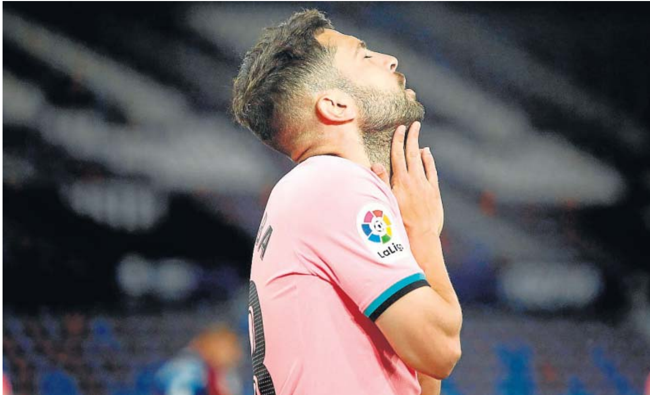
El jugador del Barcelona Jordi Alba se lamenta durante un momento del partido ante el Levante.

BATACAZO inesperado del equipo azulgrana, que se descuelga de la lucha por el título DOS GOLES de ventaja llegó a tener el Barça ante un Levante que nunca perdió la fe en sacar algo positivo ATLÉTICO Y MADRID lo tienen en su mano para que la lucha por la Liga sea un mano a mano entre ellos