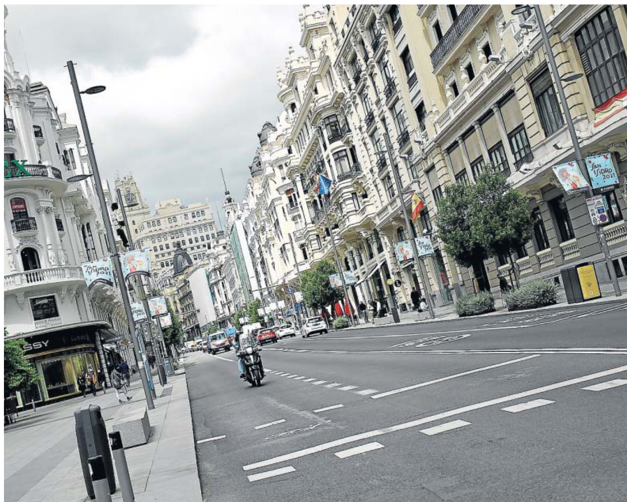
La Gran Vía, una de las principales vías en el interior de Madrid Central. JORGE PARÍS

A estos recursos se sumaron otros dos liderados por la Comunidad de Madrid y la mercantil DVuelta Asistencia Legal. Los denunciantes entendían que Madrid Central