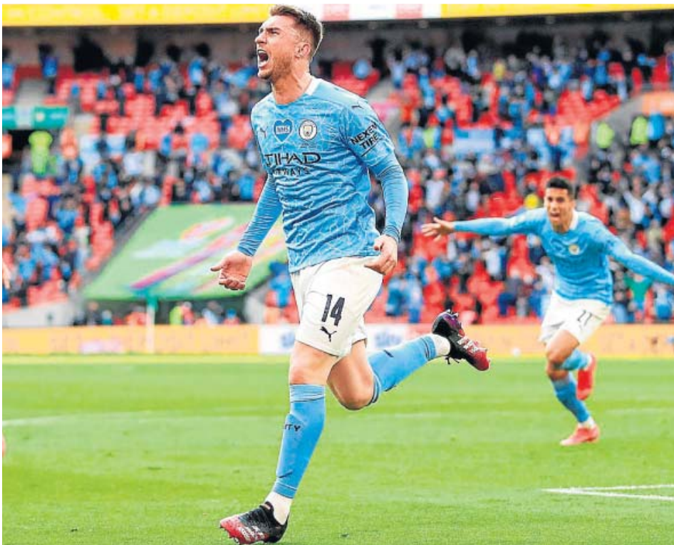
Aymeric Laporte celebra un gol en un partido del Manchester City.