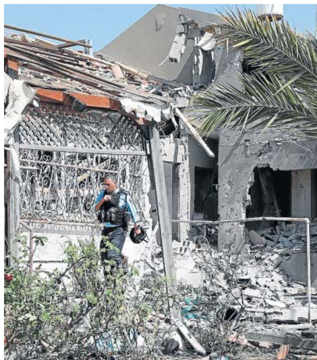
Una vivienda tras el impacto de un misil palestino en Asdod.

Esta escalada de violencia tiene su origen en los fuertes disturbios que se han venido produciendo en Jerusalén, marcados por los intensos enfrentamientos entre palestinos y las fuerzas del orden israelíes. La chispa que los desató fue el bloqueo de las escalina-