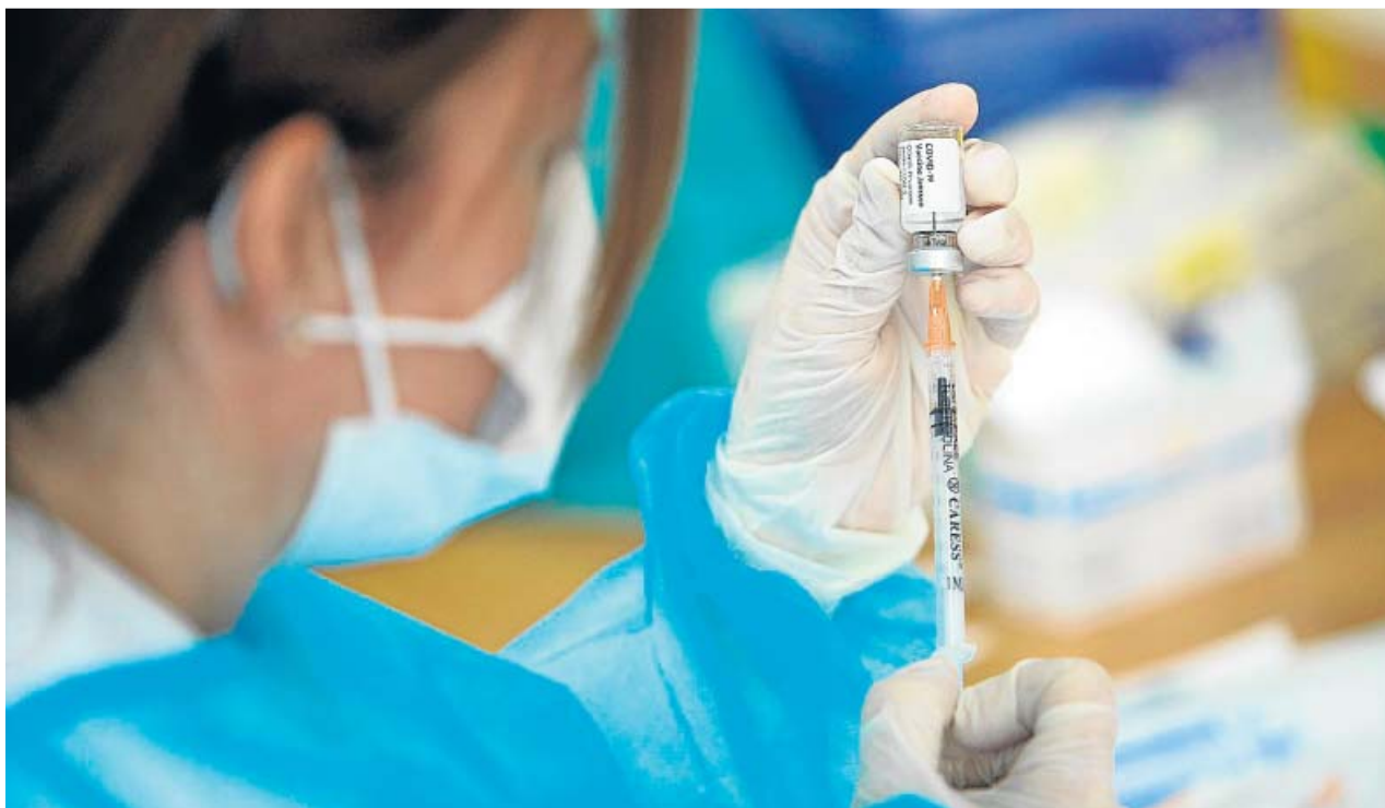
Una sanitaria prepara una dosis de la vacuna monodosis de Janssen.

El texto estima que «las primeras personas en recibir la segunda dosis tras la ampliación a 16 semanas del intervalo de separación entre dosis deberán hacerlo en la semana del 24 de mayo» y que después el intervalo «recomendado» de AstraZeneca volver a ser el que era, de 10 a 12 semanas. Este intervalo se alargó a la espera del ensayo clínico del Instituto de Salud Carlos III que estudia si es seguro poner a quienes recibieron la primera dosis de AstraZeneca la segunda de Pfizer. ●