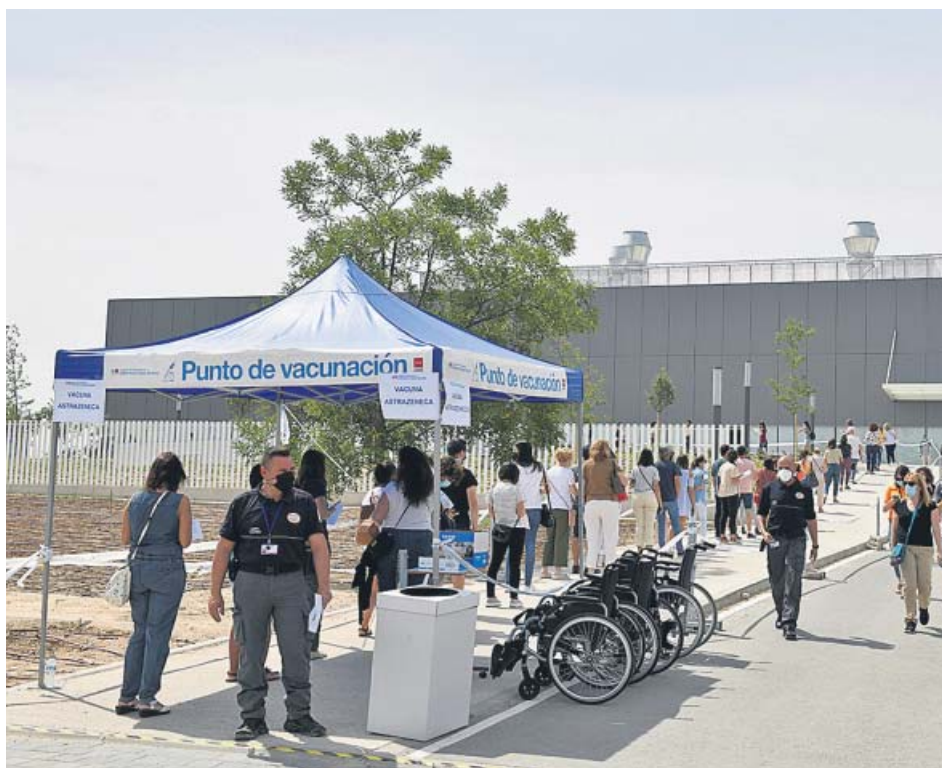
Cola en el hospital Zendal de menores de 60 que fueron a completar su pauta con AstraZeneca.

INMUNIZADOS El 22% de la población madrileña ya tiene la pauta completa y el 43%, al menos una dosis