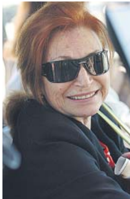
Rocío Jurado, en una imagen de 2005.

Abanderada de los homosexuales, la artista se ponía frenética ante la ho-