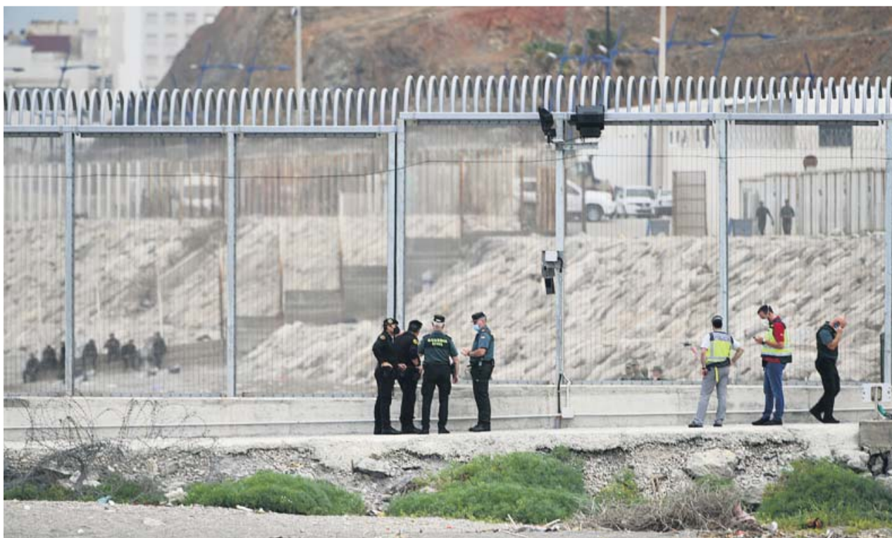
Agentes de la Guardia Civil, ayer, en la valla del Tarajal tras abortar el intento de 10 inmigrantes de cruzar a Ceuta a nado.