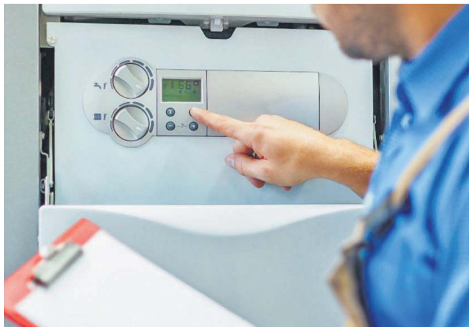
Un técnico realizando la revisión de una caldera de gas. JORGE PARÍS

No obstante, si la caldera es superior a 70kW las revisiones se deben hacer anualmente, y cada 5 años en el caso de calenta-