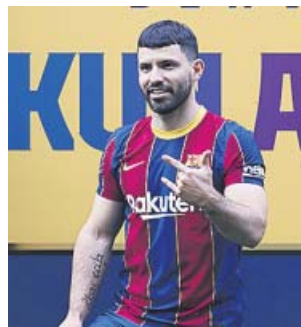
Agüero, ayer durante su presentación azulgrana.

acuerdo para su incorporación al club a partir del 1 de julio, una vez terminado su contrato con el Manchester City. Firmará contrato hasta la finalización de la temporada 2022/23 y tendrá una cláusula de rescisión de 100 millones de euros», anunció el club.