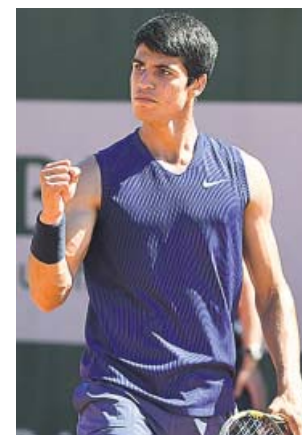
Alcaraz celebra su triunfo en París.

Hasta entonces, prosiguen debutando jugadores en la arcilla