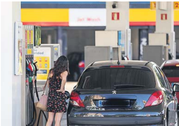
Una mujer en una gasolinera.

El encarecimiento de los carburantes y combustibles disparó la inflación anual del IPC al 2,7%, según el INE