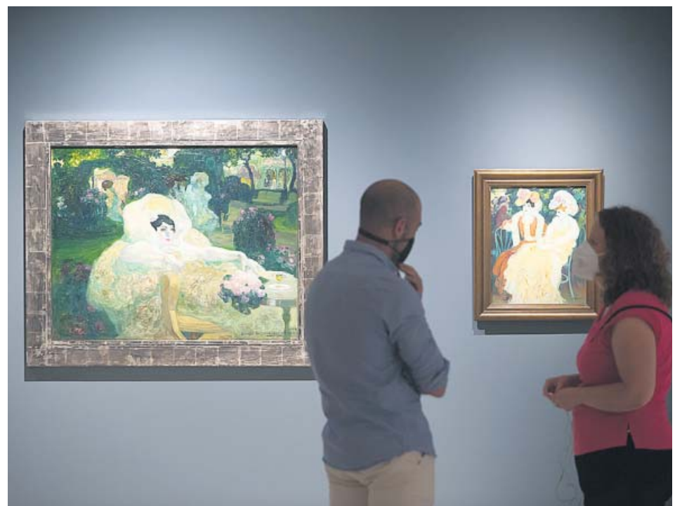
Exposición Pintar la luz , en el Museo Carmen Thyssen de Málaga.

Puedes leer muchas más noticias sobre famosos en nuestra edición digital.