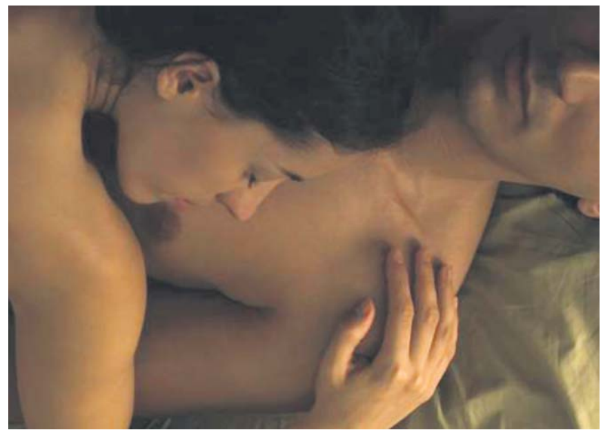
Los hábitos sexuales estables y el uso del preservativo son factores de protección.

La franja valle va desde las 00.00 horas hasta las 08.00 horas de los días laborables de lunes a viernes, así como a las 24 horas (es decir, todo el día) de los días festivos de ámbito nacional no sustituibles y los fines de semana. El consumo de electricidad que se produzca en este tramo se beneficiará de un precio muy inferior al de la franja llana, y aún más notable respecto a la franja punta, registrando un precio un 95% menor respecto al de dicha franja. ●