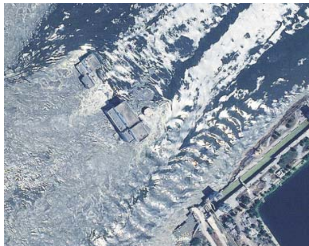
Imagen desde un satélite de los daños en la presa.

trataron de secar sus sótanos, algunos de ellos comentaban que la inundación del pueblo merecía la pena porque es lo que impidió el avance del Ejército del Kremlin.