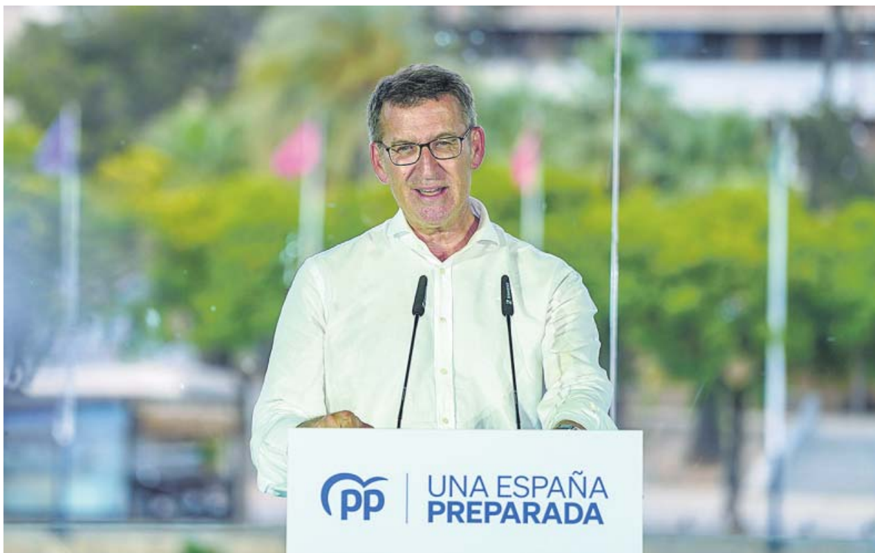
El presidente del PP, Alberto Núñez Feijóo, durante su intervención ayer en la reunión de la Junta Directiva Regional del PP-A.

AFIRMA que no habrá más de 14 carteras y eliminará, entre otras, la correspondiente a Igualdad DICE que derogará la ley trans y la de memoria democrática y hará ajustes en otras, como la de educación RETA a Sánchez a no presentarse a la investidura si no gana las elecciones, algo que hará él mismo si pierde