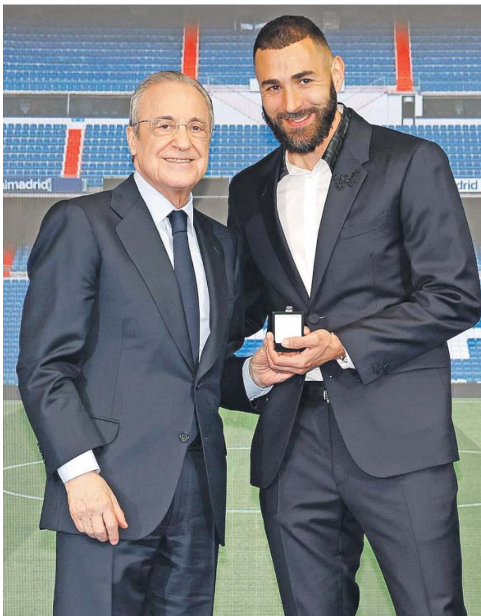
Florentino Pérez y Karim Benzema en la despedida del delantero francés.

La de ayer fue una despedida íntima a petición del delantero francés, fiel reflejo de su personalidad. Pese a ser el segundo máximo goleador de la historia del Real Madrid y el que más títulos tiene, cinco Champions entre ellos, su acto de despedida desprendió humildad. Estuvieron presentes Carlo Ancelotti y solamente cuatro jugadores (Courtois, Modric, Lucas Vázquez y Na-