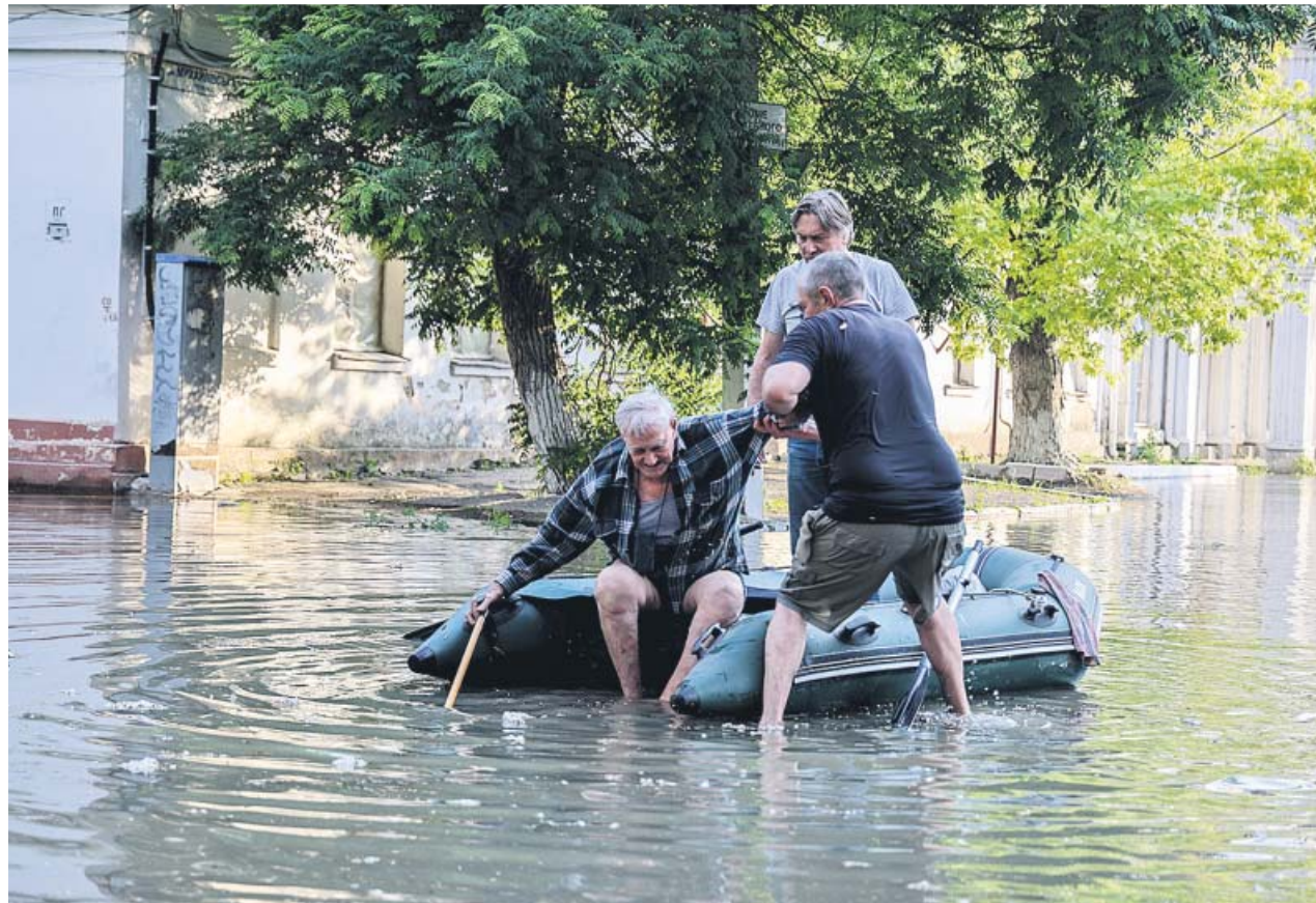
Voluntarios ayudan a un anciano que tuvo que ser evacuado de su hogar por las inundaciones en Jersón.

El ataque, calificado de «terrorismo» por Kiev, ha obligado a desalojar de sus hogares a 16.000 personas e inundado 80 localidades. Moscú rechaza la autoría de la operación