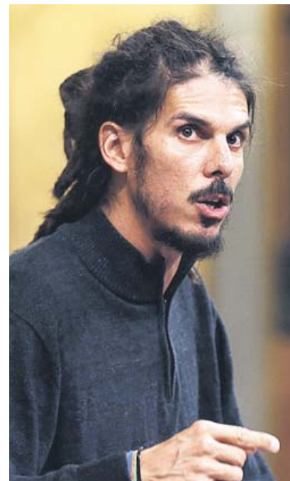
De izquierda a derecha y de arriba a abajo, los negociadores: Yolanda Díaz (Sumar), Ione Belarra (Podemos), Joan Baldoví (Compromís), Ada Colau (BComú), Mónica García (Más Madrid) y Alberto Rodríguez (Proyecto Drago).