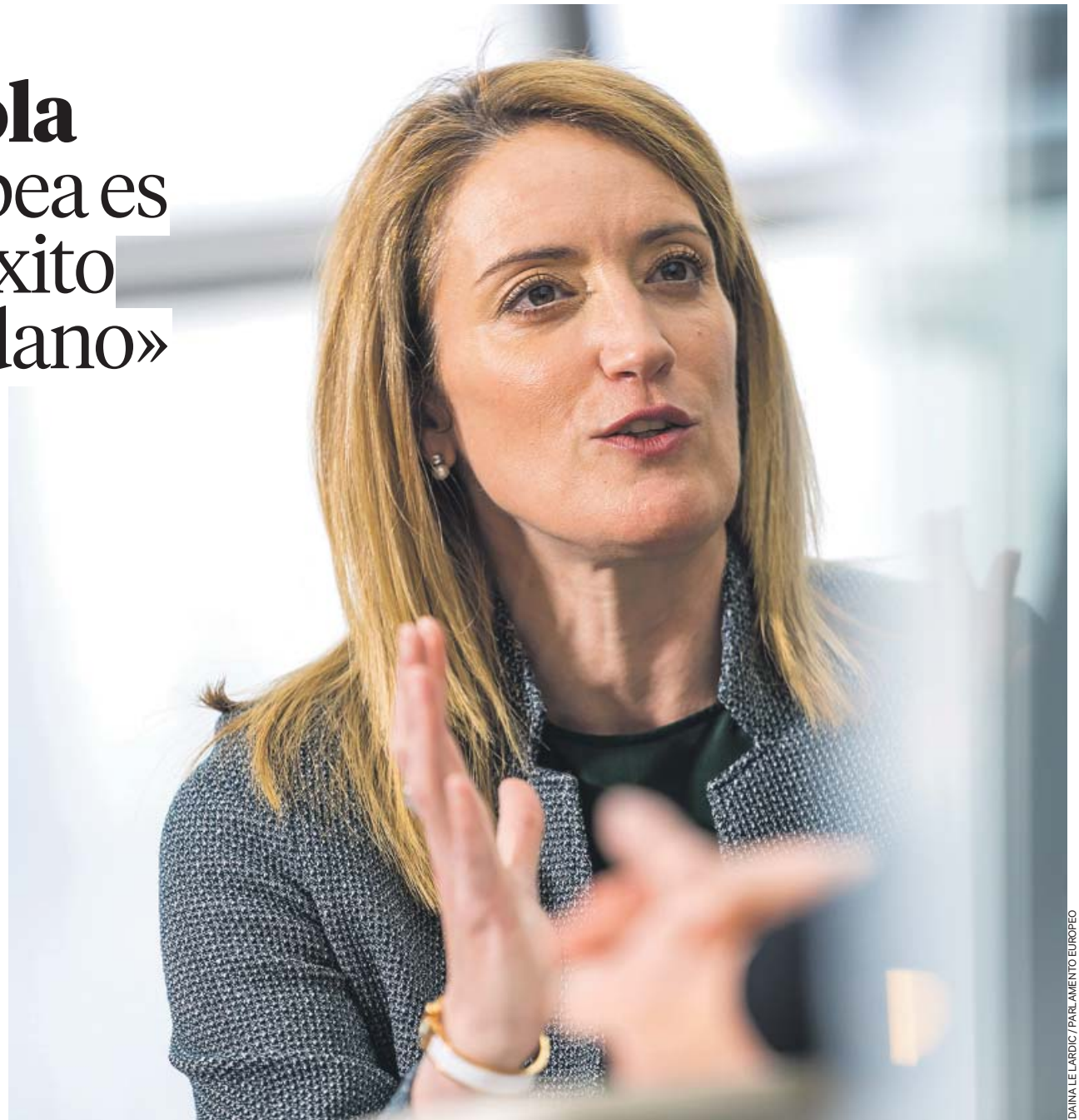
DANIEL LAROCHE / PARLAMENTO EUROPEO

¿Teme que el Parlamento Europeo que salga de las próximas elecciones esté más polarizado o radicalizado? Sí. Creo que en el pasado pensamos que manteniendo al electorado estable, a la gente que quiere votar y participa, los extremos no crecerían. Estábamos completamente equivocados. Dejamos de hablar a esos votantes que pensábamos que no eran nuestros, pero creo que podemos volver a ellos. Hay que acercarse a quienes creen que la mayor preocupación es la migración, a quienes creen que lo es el medio ambiente o a los que están preocupados por la economía. Quiero que el centro político les hable, no los márgenes, porque en los márgenes hay retórica que