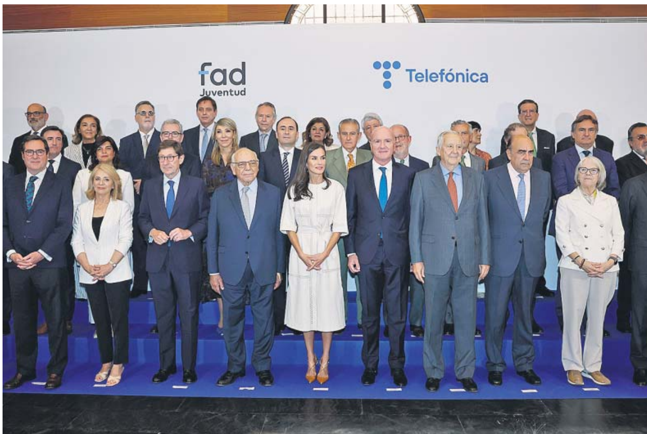
La reina Letizia presidió el Patronato Fundación FAD Juventud en la que participó la presidenta de Heraldo, Paloma de Yarza.