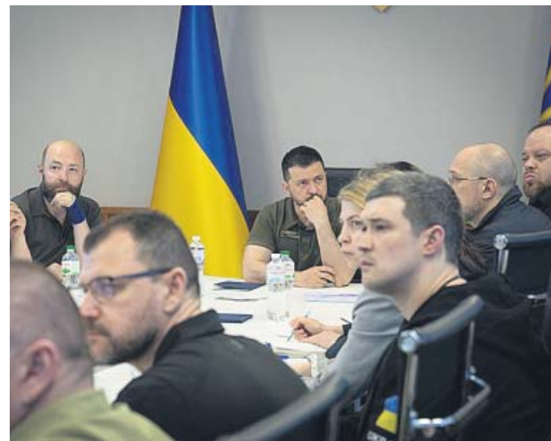
Zelenski convocó al Consejo de Seguridad Nacional.

En vísperas de la contraofensiva en Jersón, en septiembre del año pasado, la ciudad natal de Zelenski fue alcanzada por ocho misiles de crucero que dañaron su sistema de agua e