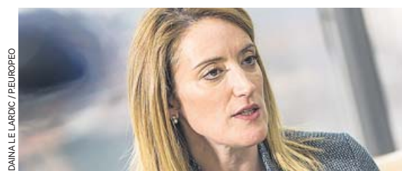
DANNA LE LARVIC / FOLIOPEO

«La Unión Europea es una historia de éxito para cada ciudadano»