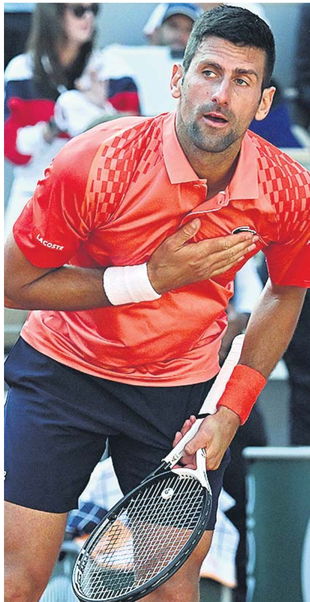
Carlos Alcaraz (i) y Novak Djokovic (d) en sus respectivos partidos de Roland Garros.