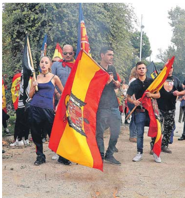
Manifestación de grupos de ultraderecha, en Barcelona.

Además de estos incidentes, colectivos de ultraderecha y antifascistas se manifestaron ayer por separado en las inmediaciones de plaza de España y de la estación de Sants, en Barcelona, en defensa de la unidad nacional los primeros y en contra de la represión los segundos. La marcha ultraderechista congregó a 350 personas, según la Guardia Urbana, bajo una intensa vigilancia de Mossos, y terminó en la montaña de Montjuïc, donde varios asistentes quemaron una bandera estelada. ●