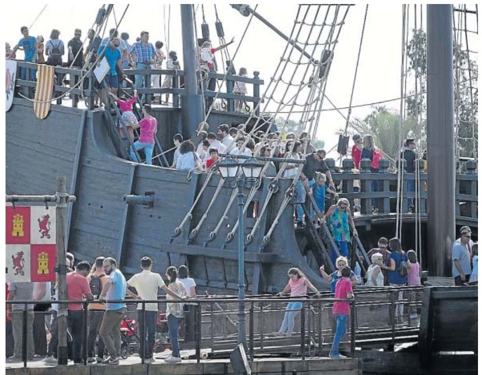
Cientos de personas visitaron ayer en Palos de la Frontera las réplicas de las naves de Colón.

En cuanto a los partidos políticos, el estudio muestra que los órganos directivos están ocupados en un 39,4% por mujeres y en un 60,6% por hombres. Podemos «es la formación con una presencia femenina más elevada (57,6%) en su Consejo Ciudadano y el PSOE-A cuenta con datos cercanos a la paridad, con un 48,9%». Por su parte, IU-LV CA alcanza un 43,3% de mujeres en 2017. En cuanto al PP andaluz, es el único que no presenta registros de representación equilibrada por sexo en su Comité Ejecutivo Regional, contando con un 35,2% de presencia femenina». Ciudadanos no ha facilitado datos. ● R.A.