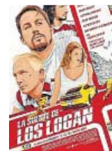
2017. Director: S. Soderbergh Reparto: Channing Tatum, Adam Driver, Daniel Craig, Katie Holmes

Y así comienza el disparate, una aventura ligera repleta de chistes y personajes carismáticos que confía en que el espectador se la tome tan poco en serio como la película se toma a sí misma. Mención especial merece una escena carcelaria que ya es, sin duda, el mejor tributo rea-