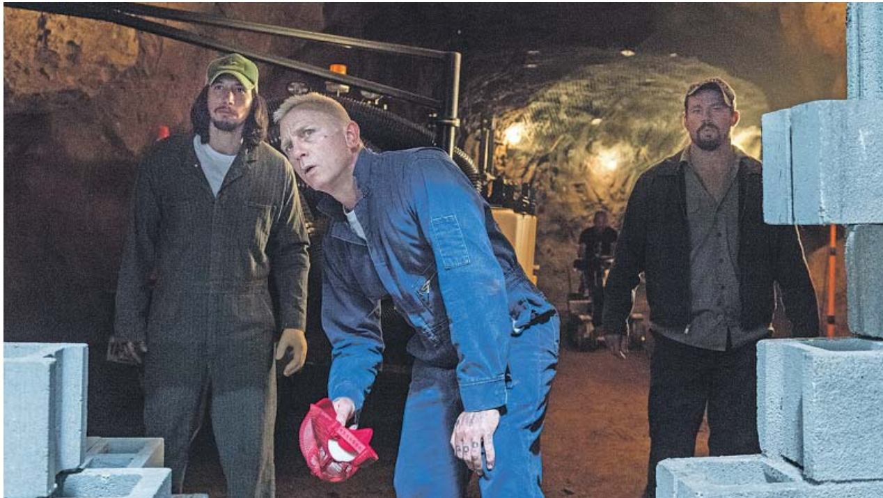
Adam Driver, Daniel Craig y Channing Tatum conforman el trío protagonista.

con una historia perfectamente construida, narrada con gracia e inteligencia y, sobre todo, poniendo mucho cariño en los personajes.