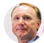
DAN BROWN El escritor, en la Feria del Libro de Fráncfort

«Amo a Cataluña y amo a España, espero que consigan solucionarlo, es una situación dolorosa»