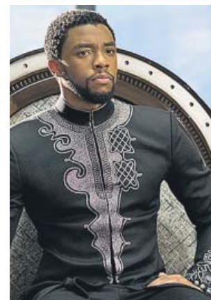
Chadwick Boseman es el héroe Pantera Negra. MARVEL

Tras la muerte de su padre, el príncipe T'Challa vuelve a su tierra para ser nombrado rey de Wakanda, una nación africana