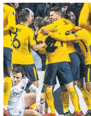
Los jugadores del Atlético celebran un gol.

La Real Sociedad no pudo pasar del empate en Anoeta ante Salzburgo, a pesar de un partido excelso del canterano Odriozola. La Real tuvo que remontar un