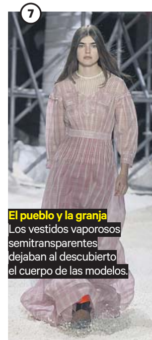
El pueblo y la granja Los vestidos vaporosos semitransparentes dejaban al descubierto el cuerpo de las modelos.