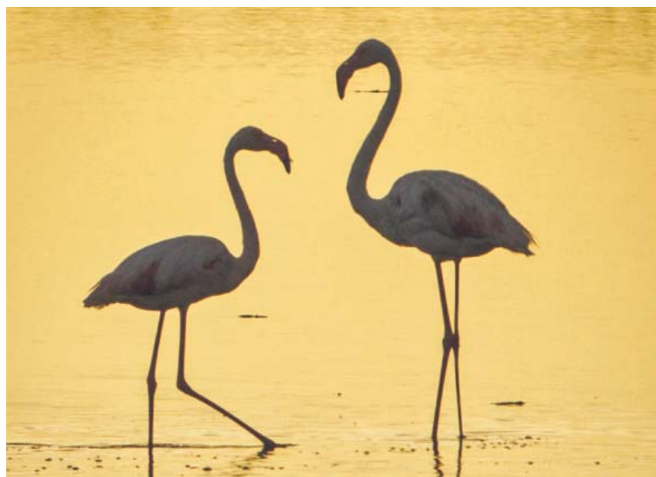
Dos flamencos en la reserva de la biosfera Marismas de Odiel.

Los trabajadores de Cetursa-Hostelería mantendrán los paros parciales de tres horas en la estación de esquí de Sierra Nevada por los «incumplimientos» de la empresa pública a la hora de aplicar el convenio colectivo.