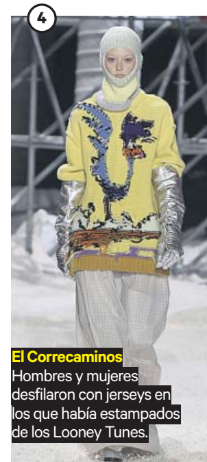
El Correcaminos Hombres y mujeres desfilaban con jerseys en los que había estampados de los Looney Tunes.