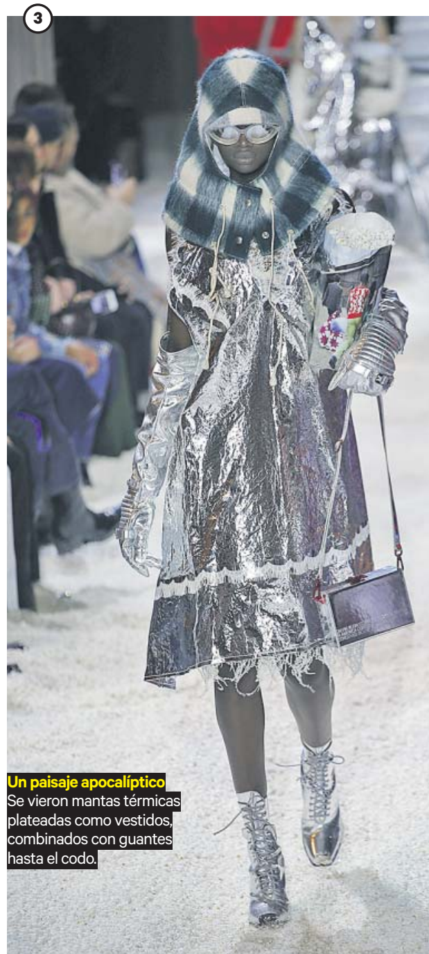
Un paisaje apocalíptico Se vieron mantas térmicas plateadas como vestidos, combinados con guantes hasta el codo.