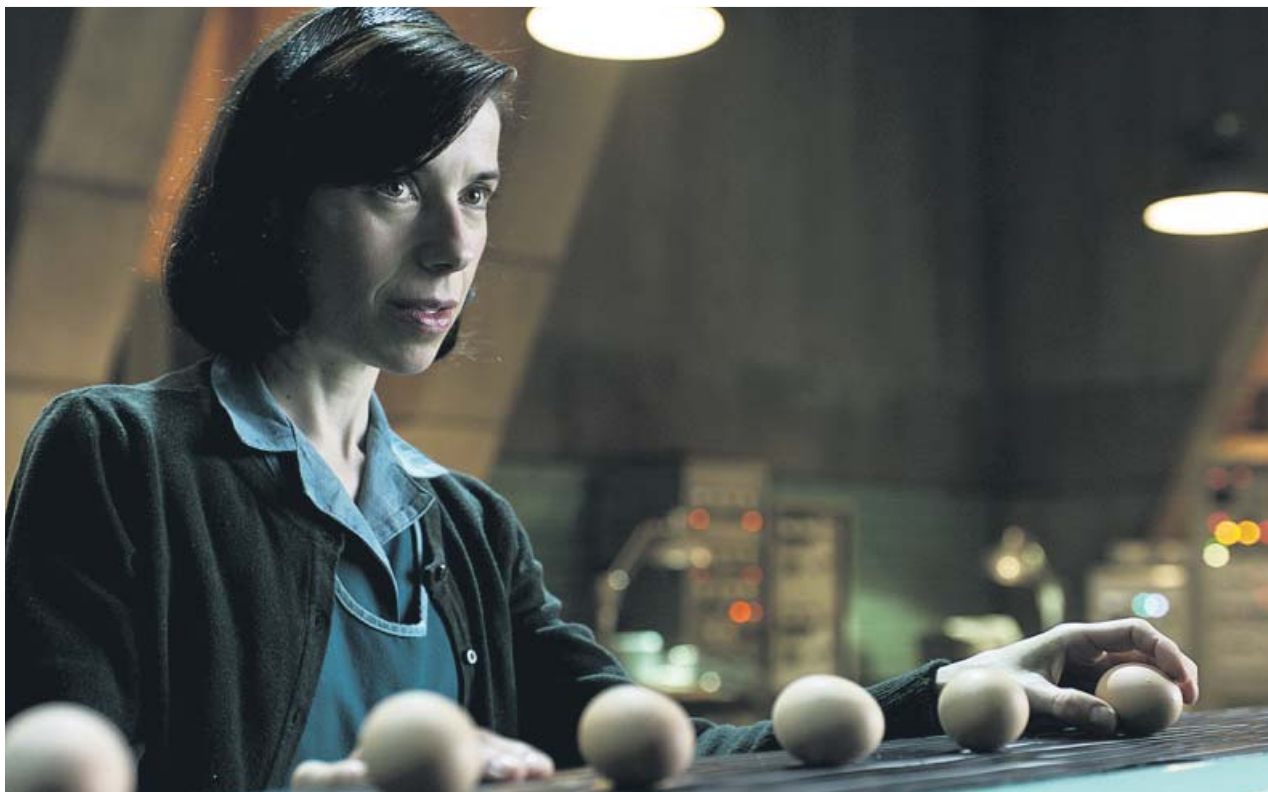
Elisa (Sally Hawkins) ofrece huevos cocidos a la criatura marina interpretada por Doug Jones.