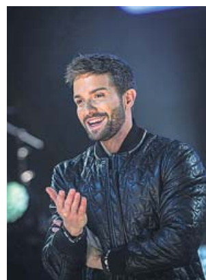
Alborán, ayer, presentando su gira Prometo.

Prometo es el nombre de su nueva gira, que comenzará el 1 de marzo en Ciudad de México y comprende 30 fechas en nuestro país y 23 por Latinoamérica. Con gran parte de las entradas agotadas, en España recalará el 18 de mayo con dos shows consecutivos en Málaga. Además, ofrecerá cuatro actuaciones en Madrid (29 y 30 de junio, 31 de julio en el Teatro Real y otra el 8 de diciembre) y tres más en Barcelona (8 y 9 de junio y 21 de diciembre). ● R. C.