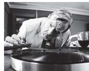
Una historia de humor ácido y giros inesperados. AVALON

Janet es una política progresista que acaba de dar un gran