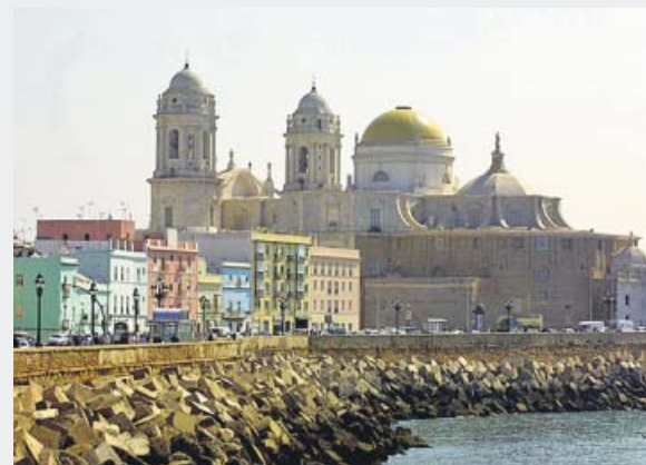
Vistas de la Catedral de Cádiz. ARCHIVO

euros fue la tarifa media diaria de los hoteles en las zonas vacacionales.