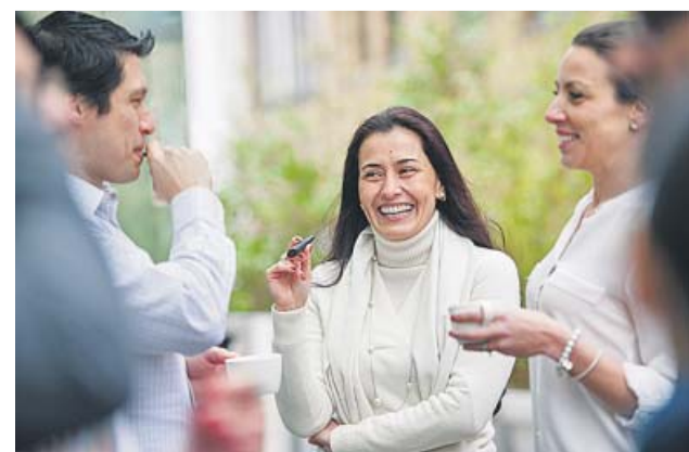
Tabaco sin combustión.

Estos vapeadores fueron los primeros en comercializarse en España. Llegaron a principios de 2008 y su diseño generalmente imita un cigarrillo o una pipa. En su interior contiene una batería para calentar una solución líquida que acaba conver-