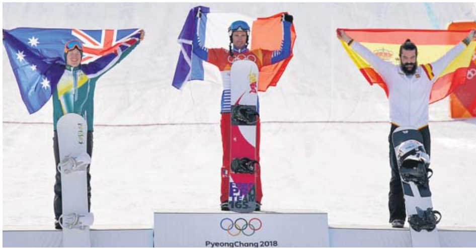
Regino Hernández, con la bandera de España, en el podio olímpico de PyeongChang.

El 'rider' de Ceuta consiguió el bronce en el cross de snowboard de los Juegos Olímpicos de PyeongChang. Es la tercera medalla de España en toda su historia olímpica invernal