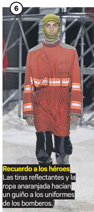
Recuerdo a los héroes Las tiras reflectantes y la ropa anaranjada hacían un guiño a los uniformes de los bomberos.