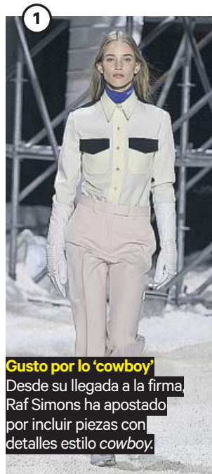
Gusto por lo 'cowboy' Desde su llegada a la firma, Raf Simons ha apostado por incluir piezas con detalles estilo cowboy.

Estados Unidos, a examen: una mirada al otro lado del sueño americano