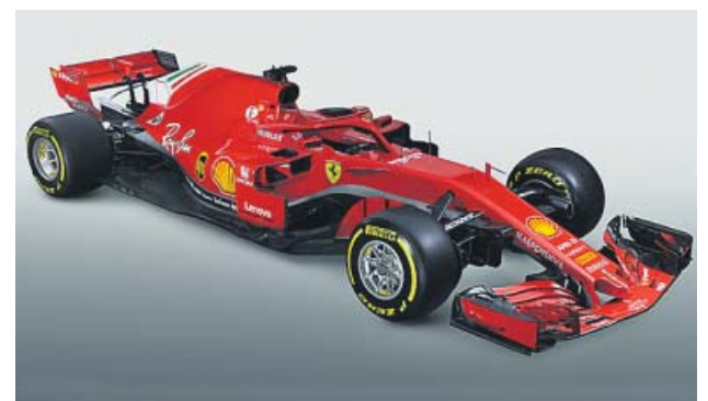
FERRARI Y MERCEDES