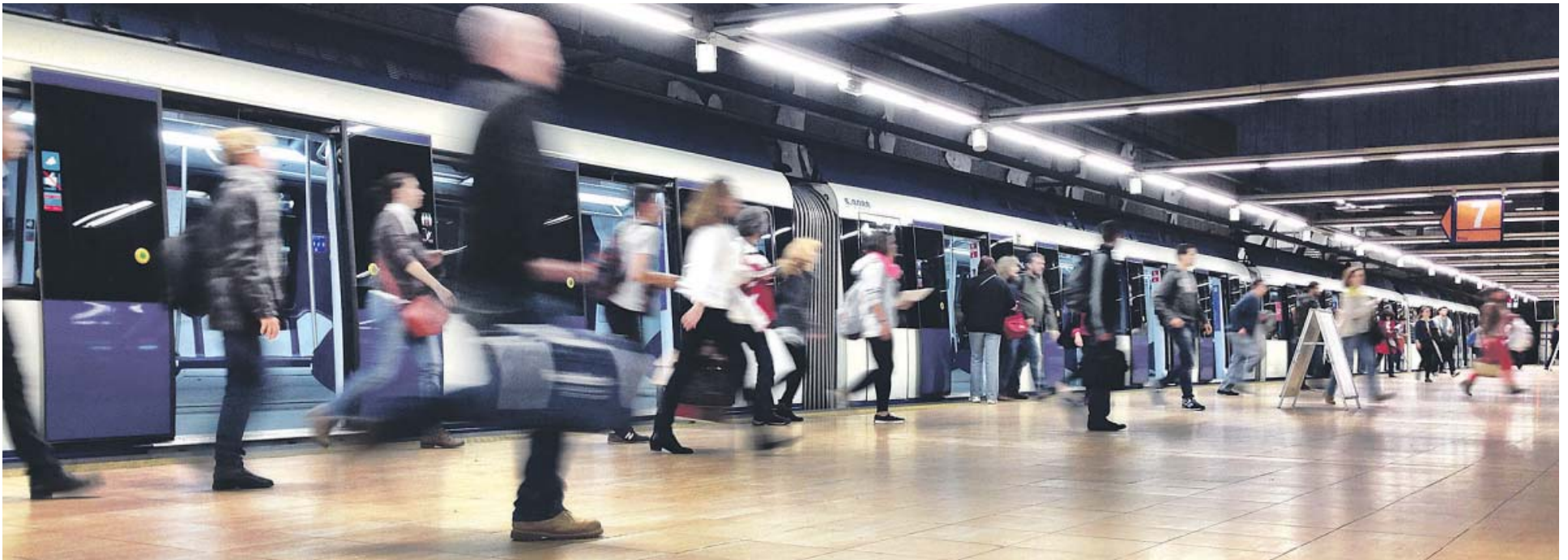
El Metro y otras opciones de transporte público son la elección del 39% de españoles. JORGE PARÍS