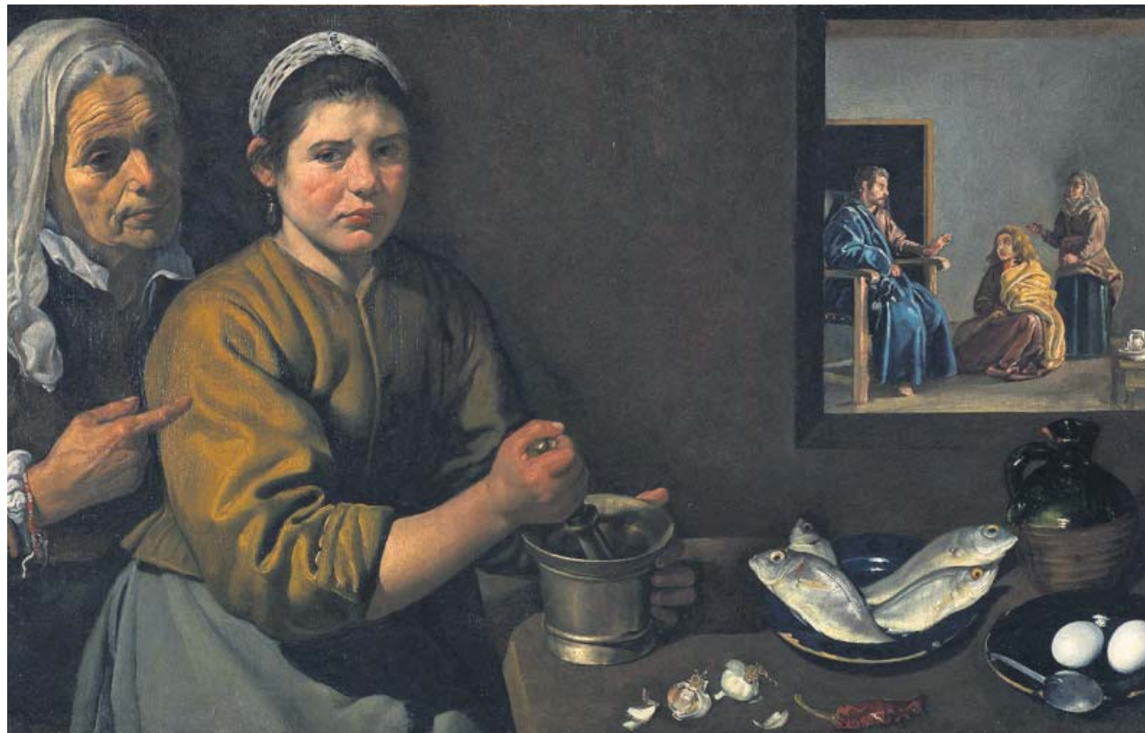
La obra de Velázquez Cristo en casa de Marta y María (1618) forma parte de la exposición Spanish still life . PALACIO DE BELLAS ARTES DE BRUSELAS

¿Quién se ha quedado con el muñeco que hace de bebé? Creo que era alquilado. Era un muñeco hiperrealista y un poco creepy [horripilante]. ●