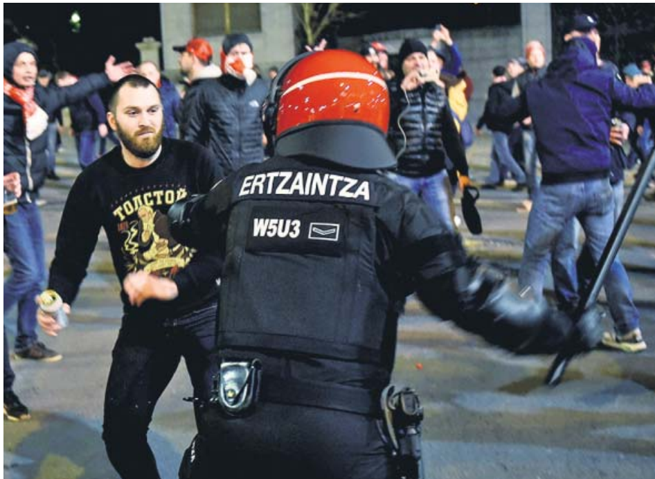
Un agente de la Ertzaintza carga contra un aficionado del Spartak.