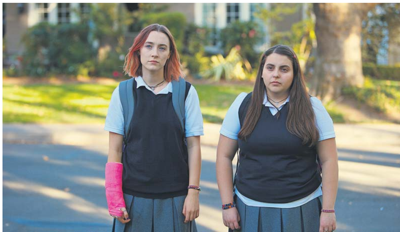
La protagonista de la película, Lady Bird , junto a su mejor amiga Julie.

De todas ellas Lady Bird es, con diferencia, la más típica de todas. A saber, el relato de una joven rebelde y descarada de una familia de clase media con problemas económicos que, en los últimos años de instituto, no tiene claro su futuro. Aquí entran todos los lugares comu-