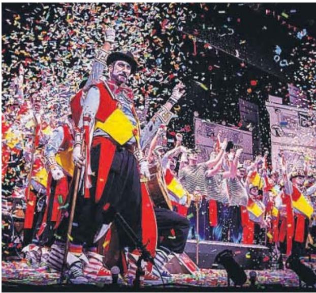
Actuación de este año del coro Don Taratachin .