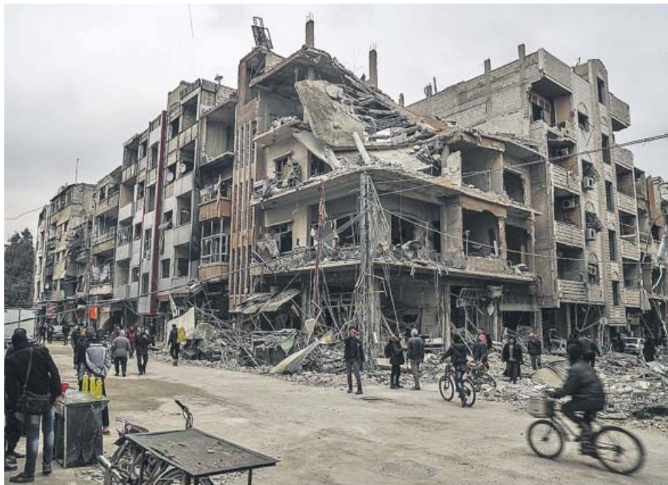
Vecinos inspeccionan edificios tras los bombardeos en Duma, feudo rebelde de Guta Oriental.