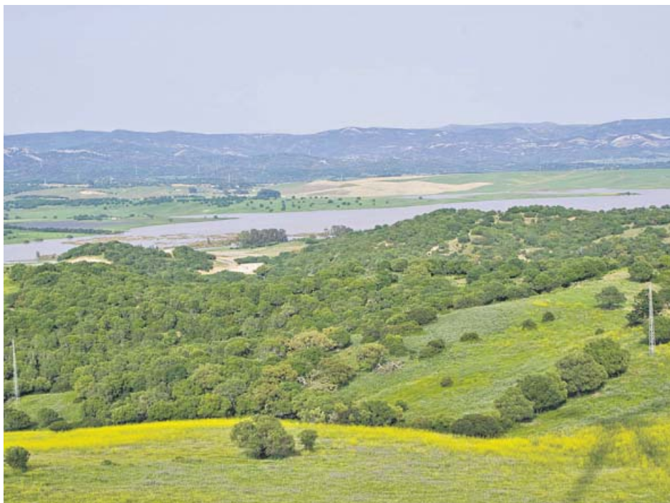
Cola del embalse de Barbate.