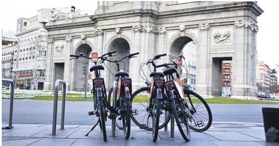
A.B. / ROBERT RAMOS

El crecimiento de los tramos de carril bici en las urbes y la aceptación cada vez mayor de las dos ruedas ha acelerado el proceso municipal de regulación, todavía incompleta.