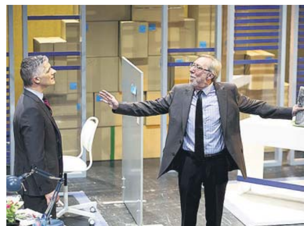
Un momento de la representación.

La obra es un «hechizo de sirenas» que apela, según su director, Antonio C. Guijosa, a esa «llamada del amor que dejamos ir», un texto de Al-