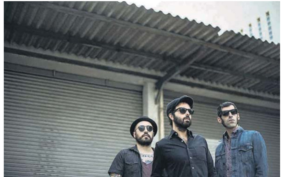
Los tres componentes de la banda madrileña Sidecars .

Palacio de Exposiciones y Congresos. Fibes. Avenida Alcalde Luis Uruñuela s/n. Hoy, mañana y el martes 27, a las 20.30 horas. De 27 a 54 euros en www.fibestickets.es