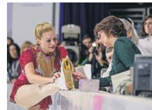
Margot Robbie hace un trabajo de Óscar.

Este biopic nominado a tres Óscar utiliza una narración muy poco convencional que