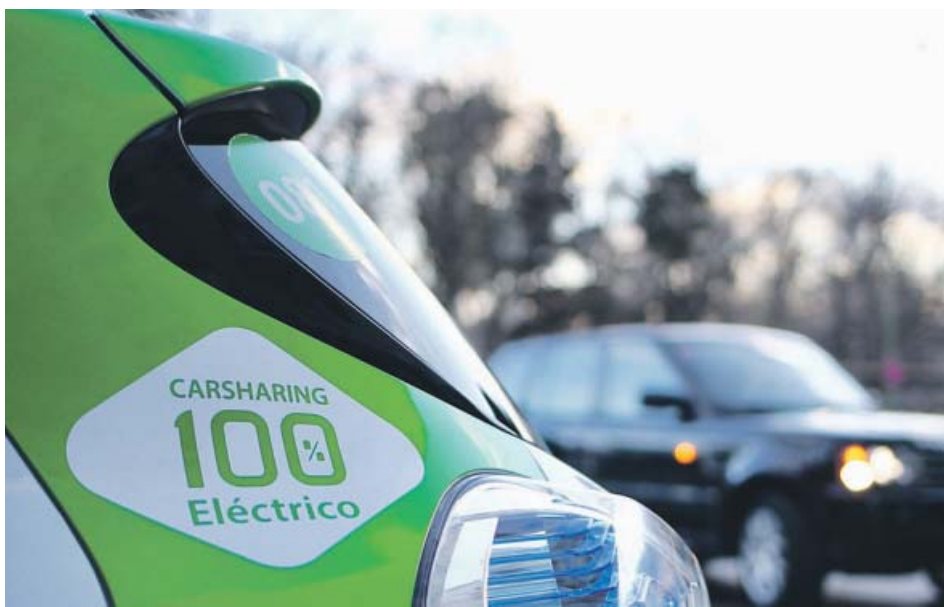
Avancar es una de las alternativas de 'carsharing' que más triunfan. JORGE PARÍS