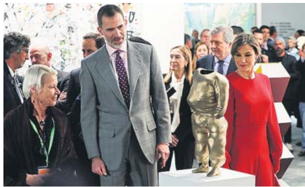
Los Reyes observan la obra He-Hop , de Erwin Wurm.

En la edición del año que viene, Perú será el país invitado de honor, una costumbre que este año se ha sustituido por el futuro como temática de la feria. ● R. C.