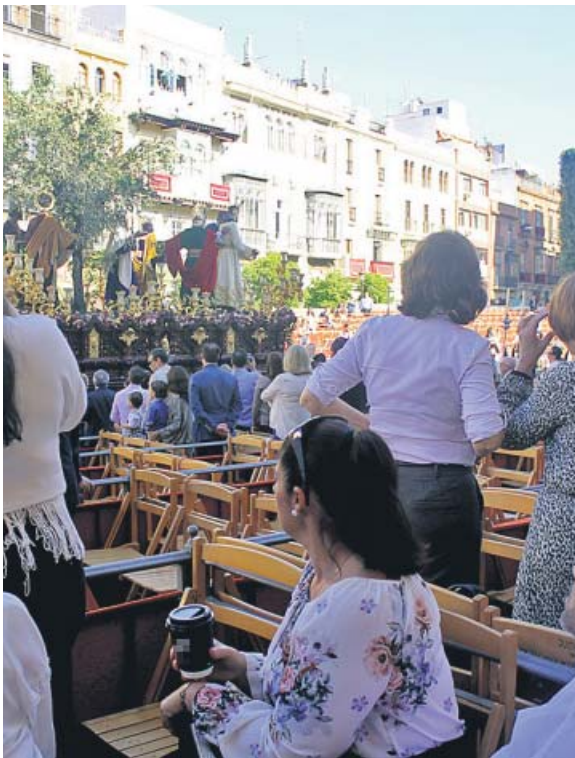
Sillas en la Carrera Oficial de Sevilla.