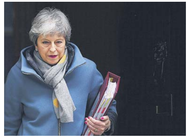
La primera ministra británica, Theresa May.

Entre los países de la Unión, Alemania apuesta por un plazo amplio, mientras que Francia se ha posicionado a favor de un aplazamiento corto. En España, el ministro de Asuntos Exteriores, Josep Borrell, es partidario de unas elecciones en Reino Unido. Con todo, Theresa May trató ayer de hacer autocrítica, y lanzó un órdago para presionar a su Parlamento de cara a una nueva votación: «El pueblo británico merece más de lo que esta Cámara le ha dado hasta ahora». ●