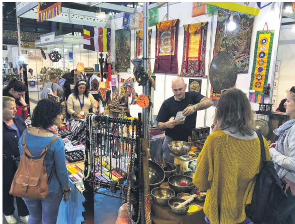
Zona expositiva de la edición de Natura Málaga del pasado año.

La Feria de Vida Saludable y Sostenible, Natura Málaga, que tendrá lugar entre los días 5 y 7 de abril en el Palacio de Ferias y Congresos de Málaga (Fycma), contará con actividades infantiles a través de manualidades de reciclaje y aprovechamiento de recursos en el espacio Natuteca (en la zona expositiva), desde un prisma educativo y que fomente el consumo responsable, actividades que llegarán de la mano de la Unión de Consumidores. ● R. A.