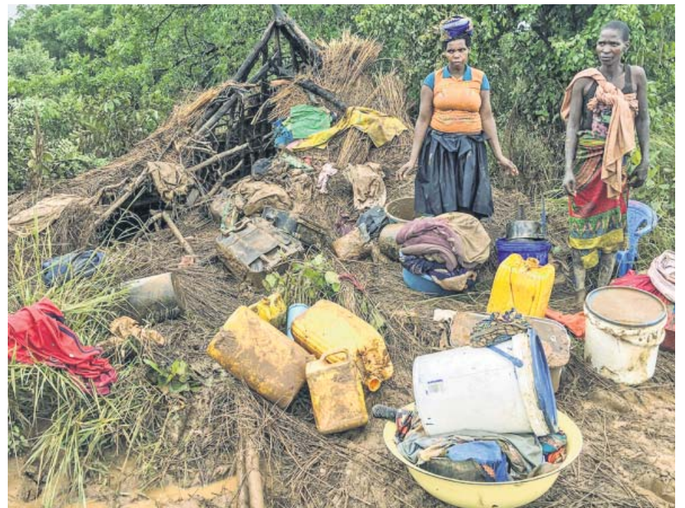
Varias personas amontonan sus pertenencias en una zona inundada en Mozambique.