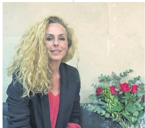
Rocío Carrasco durante la entrevista. s.o.

La modelo desmiente con contundencia su sonada detención en el aeropuerto de Madrid, pero hay documentación que sostiene todo lo contrario. Se avecinan curvas, y no precisamente las suyas... ●