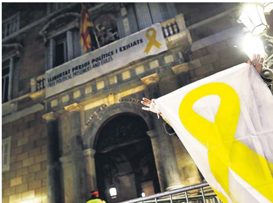
Una persona despliega una pancarta con un lazo amarillo frente al Palau de la Generalitat, ayer.

Mossos. La JEC puede recurrir a la Conselleria de Interior para que los mossos retiren los lazos y vigilen que no se vuelven a poner.