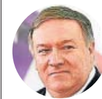
MIKE POMPEO Secretario de Estado de Estados Unidos

«La presión sobre Irán funciona, pero [EE UU e Israel] necesitamos aumentarla y expandirla»