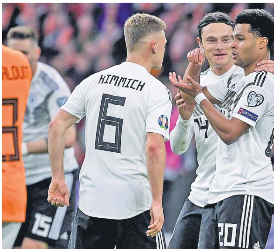
Serge Gnabry celebra su gol a Holanda junto a Joshua Kimmich y Nico Schulz.