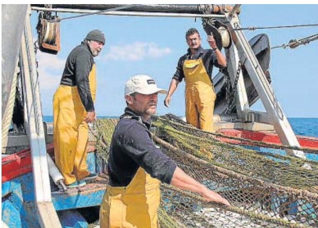
Pescadores participantes en el proyecto Upcycling the Oceans .

El proyecto estuvo presente el pasado año en cuatro puertos andaluces –Sanlúcar de Barrameda, Barbate, Chipiona y el Puerto de Santa María, todos ellos en Cádiz–. Gracias a la colaboración de 310 pescadores al frente de 65 barcos de arrastre, se consiguieron liberar en las aguas de la comunidad 2.500 kilos de basura. «El mar es para Andalucía uno de sus más preciados tesoros, por eso no podemos ser indiferentes ante un