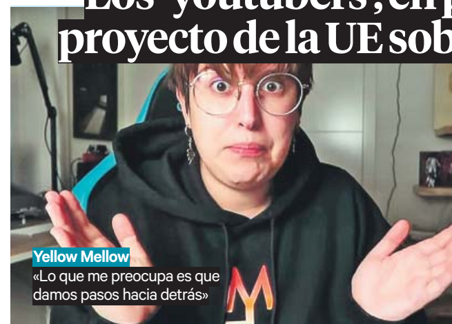
Yellow Mellow «Lo que me preocupa es que damos pasos hacia atrás»