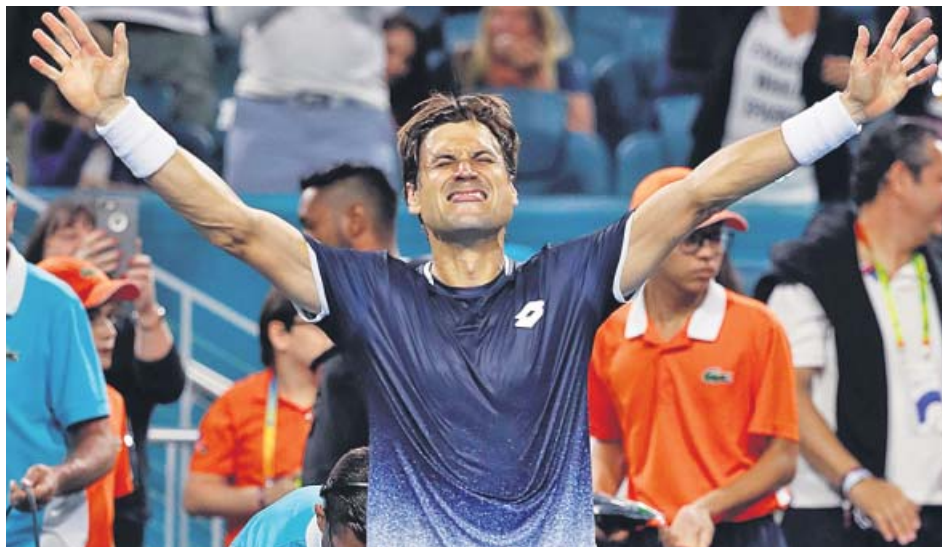
David Ferrer celebra su victoria ante Zverev en el Masters de Miami.

«Esta victoria ante Zverev significa mucho para mí porque no entraba en mis planes. Es un día especial porque es mi último año como tenista