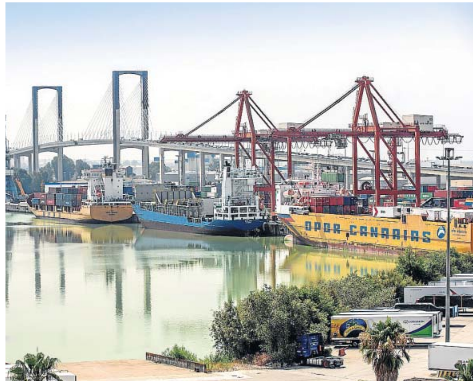
Vista de una de las zonas del puerto de Sevilla.

El Ministerio de Fomento fue el principal inversor (229 millones), con obras de AENA y Enaire a la cabeza, seguidas de las relativas a las autoridades portuarias. A estas se suman las de Renfe y ADIF, las de carreteras y Correos. Le siguió el Ministerio para la