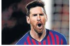
Messi, duda para el derbi del sábado.