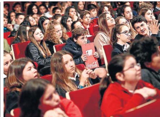
Los concursantes, preparados para escribir.