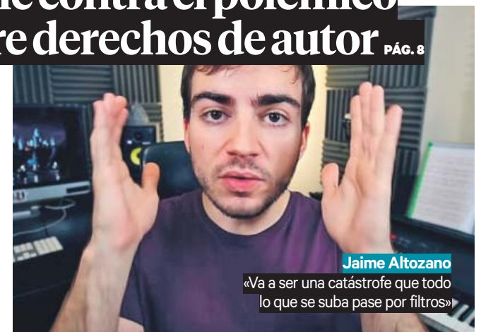
Jaime Altozano «Va a ser una catástrofe que todo lo que se suba pase por filtros»