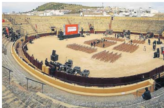
El coso de Osuna, preparado para la proyección. I. A.