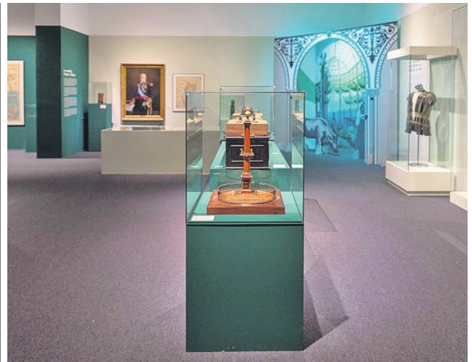
Vista de una de las salas de la exposición Los héroes de Baler , en Toledo.

En esta cartografía se pueden seguir itinerarios de una veintena de novelas con fuerte relación con la urbe, situados allá donde pasa la mayor parte de su acción, como La ciudad de los prodigios , de Eduardo Mendoza, Historia abreviada de la literatura portátil , de Enrique Vila-Matas, el inicio del Quadern Gris de Josep Pla en la Universidad de Barcelona o Últimas tardes con Teresa , de Juan Marsé. ● EFE