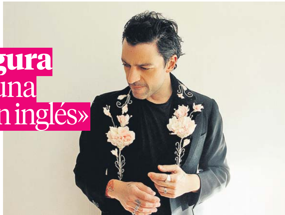
HOOK MANAGEMENT / SONY MUSIC

Ha grabado el disco en su casa. ¿Tiene aire mediterráneo? Sí le veo cierto punto mediterráneo, como siempre he tenido, aunque no haya castañuelas o guitarrones de folclore. Cuenta que el cambio se produjo cuando cumplió 40. ¿Es Amenaza tormenta producto de una crisis? No, es un punto más. Creo que la edad pesa en diferentes grados: soy padre de familia numerosa y no me veo como un chaval; eso suma para que luego tome decisiones. No porque cumpla 40 me pongo a cantar en castellano, pero sí que suma. Sintió la necesidad de dar un giro, ¿no? Sí, pero también porque mi carrera ya había dado una vuelta de 360 grados y necesitaba un descanso, para retomarla en un tiempo.