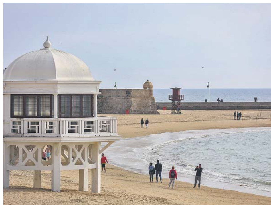
Imagen de la playa de La Caleta, en la ciudad de Cádiz.

El estudio La Caleta e intermareales rocosos asociados: una ventana permanente al conocimiento de la biodiversidad marina (BioCaleta) , financiado por la Fundación Biodiversidad y el Ministerio para la Transición Ecológica, ha permitido identificar, al menos, diez especies marinas que son absolutamente nuevas para la ciencia en todo el mundo. Aunque la cifra podría aumentar. ● R. A.