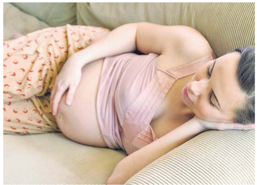
El diagnóstico prenatal temprano y un seguimiento exhaustivo son vitales.

La localidad de Aznalcóllar de unos 6.000 habitantes, fue el escenario del mayor accidente ecológico minero de la historia de Europa. En 1998, la rotura de una presa que retenía aguas de contaminadas de una mina vertió toneladas de contaminantes en el entorno de Doñana. ●