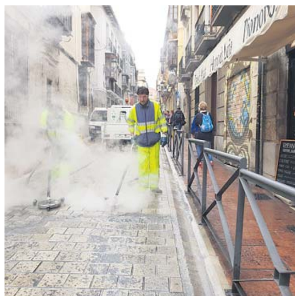
Operarios limpian la cera en una calle de la ciudad.