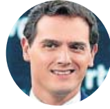
Albert Rivera Candidato de Ciudadanos

«Señor Sánchez, baje del Falcon, baje del avión. Aterrice»