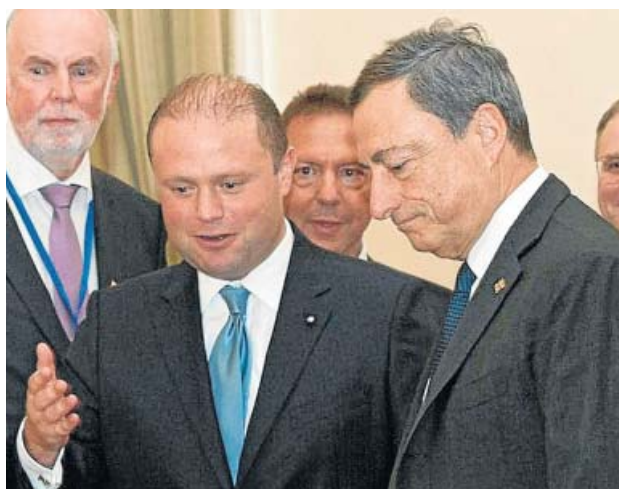
De izquierda a derecha y de arriba abajo, el portugués António Costa en su toma de posesión; el primer ministro sueco, Stefan Löfven; la rumana Viorica Dăncilă, y el maltés Joseph Muscat en una recepción a Mario Draghi.