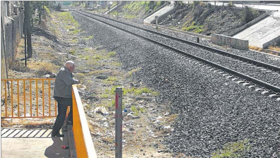
La basura rodea a la vía del tren que divide el centro de la pedanía de Javalí Nuevo en dos partes.

JAVALÍ NUEVO. 20 minutos ha estado en la pedanía para saber qué es para los vecinos lo mejor y lo peor de vivir en la localidad