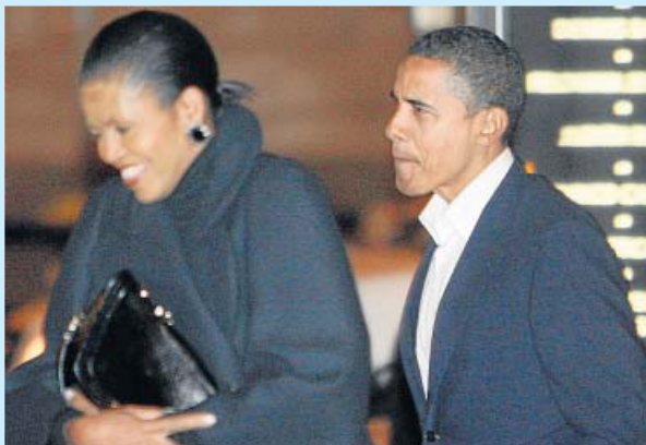
Cena con Michelle y reunión con Bush. Barack Obama cenó el sábado en un restaurante de Chicago con su mujer (en la foto, a su salida). Hoy se reúne con Bush en la Casa Blanca.