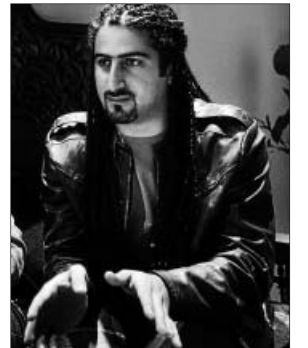
Omar Osama Bin Laden, en una fotografía de junio.

Sus intereses están representados por el grupo Saudí Binlادن, un conglomerado dedicado a la construcción y la gestión financieras. El 11-S, el grupo tenía 36.000 empleados en 30 países.