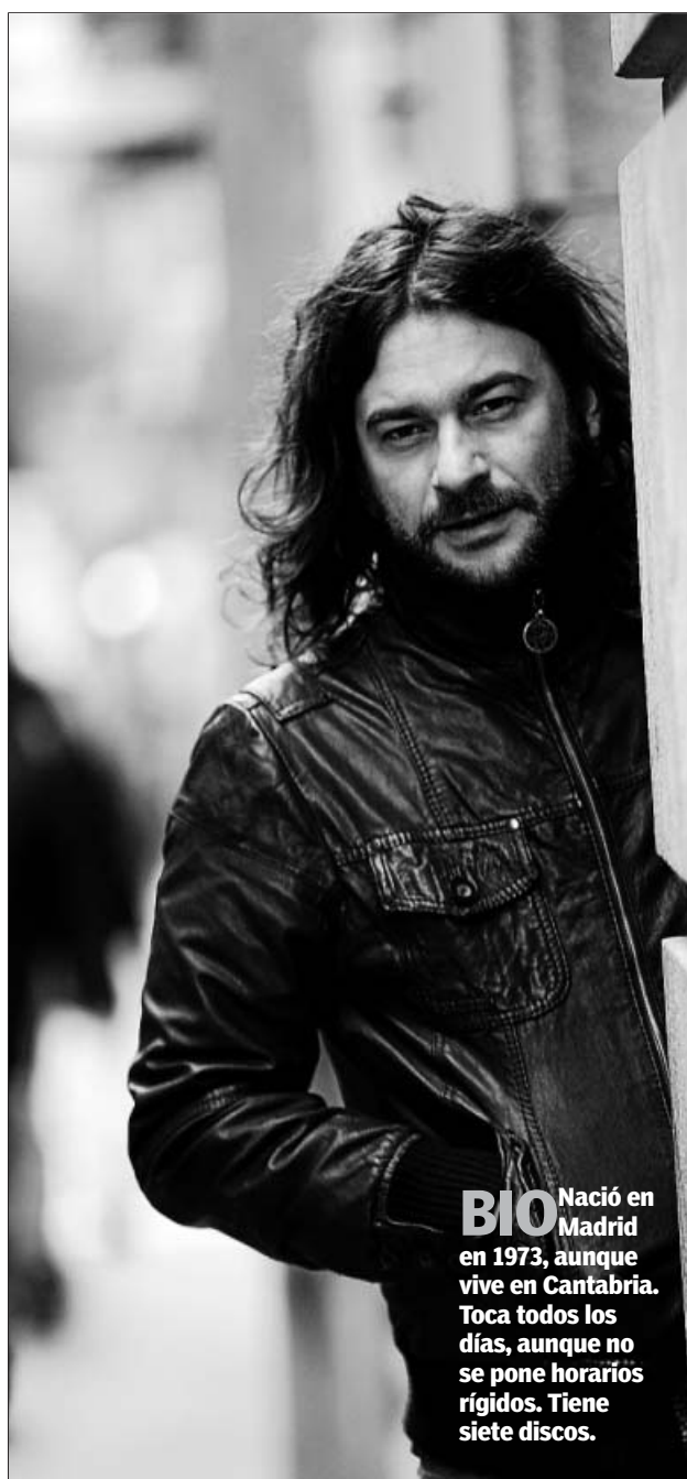
BIO Nació en Madrid en 1973, aunque vive en Cantabria. Toca todos los días, aunque no se pone horarios rígidos. Tiene siete discos.

«Cerrar los ojos es una forma de meterme en las canciones, de concentrarme»