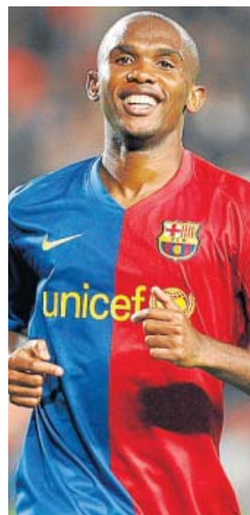
Samuel Eto'o lleva 13 goles en diez partidos.

En la segunda parte el Valencia se acomodó en el césped. Los apuros eran testimoniales, con un Getafe que poseía el balón, sí, pero que realmente no acosaba a Renán. Y a la contra, con golazos de Joaquín y Vicente, los de Emery finiquitaron el compromiso.