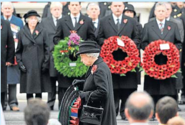
Domingo del Recuerdo. La reina Isabel II de Inglaterra, durante la conmemoración ayer en Londres del fin de las hostilidades en la I Guerra Mundial, de la que se celebra el 90 aniversario.