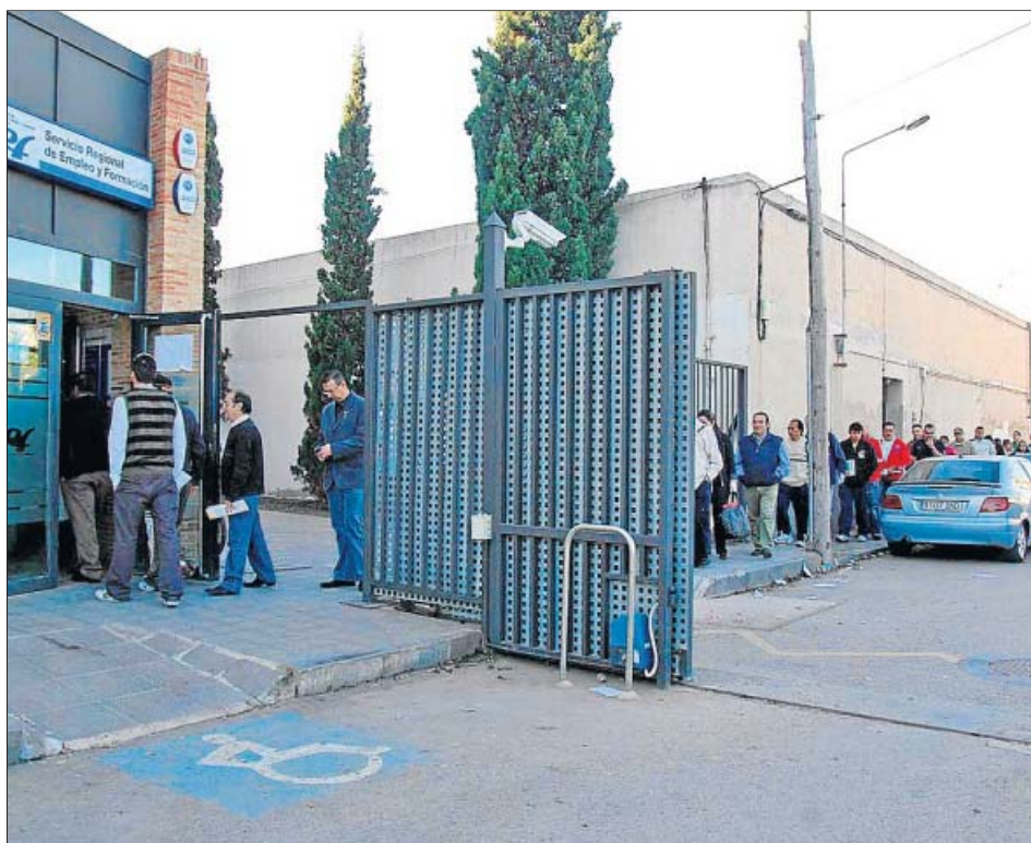
Así de larga es la cola a primera hora de la mañana en el SEF de Cartagena.

En la Región de Murcia ya hay 80.977 parados. El pasado mes de octubre el desempleo aumentó un 66,4% con respecto a octubre de 2007, lo que nos convirtió en la comunidad que ha registrado el