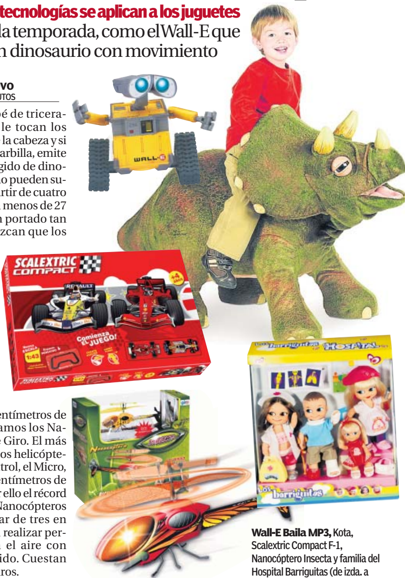
Wall-E Baila MP3, Kota, Scalextric Compact F-1, Nanocóptero Insecta y familia del Hospital Barriguitas (de izda. a dcha. y de arriba abajo).

La tecnología también se ha incorporado al robot más tierno de la Disney. Uno de los múltiples productos basados en este personaje animado es Wall-E Baila MP3, que se mueve y parpadea al ritmo de su propia música y permite la conexión con un reproductor. Cuesta alrededor de 46 euros.